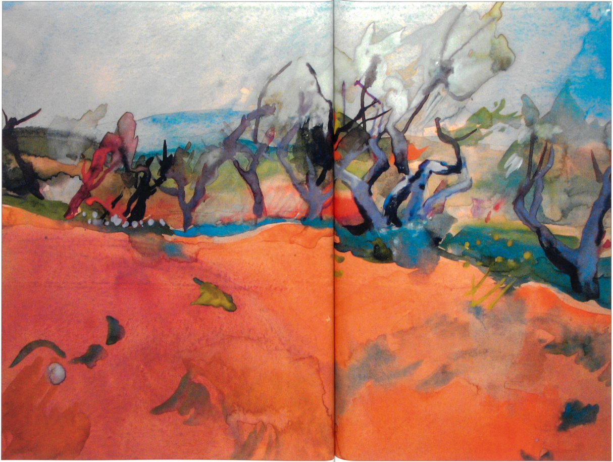
Coghuf (Ernst Stocker), südfranzösische Landschaft mit Olivenbäumen, 1936, 34,8 × 47,6 Zentimeter, Sammlung Robert Spreng, Reiden: Abbildung 4.