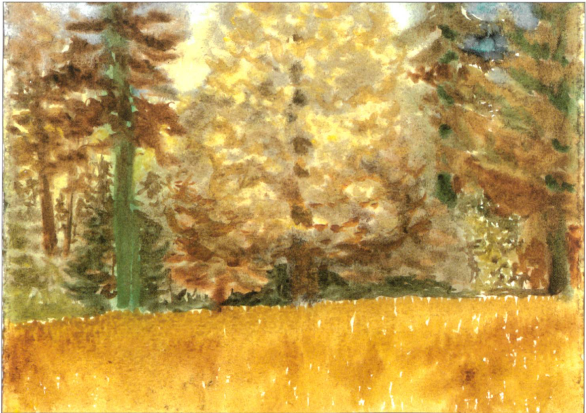
Kurt F. Hunkeler: Der Altishofer Wald bei der Pünte im Herbst.