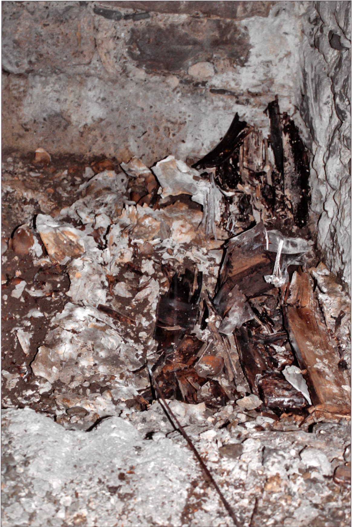
Der zerfallene Kindersarg stammt wohl aus der Zeit um 1900.