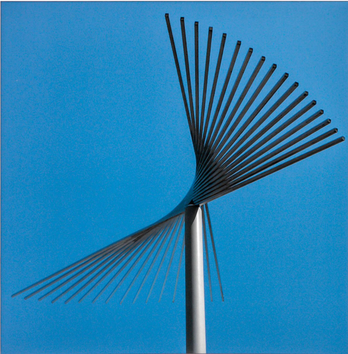
«Die Feder», eine Skulptur von Gunter Frentzel, auf dem Platz, wo die Wallfahrtskirche von Oberbüren stand (abgebrochen um 1530).

Oberbüren der bekannteste und bedeutendste Wallfahrtsort dieser Art. (Anzumerken ist, dass der Landvogt von Büren an den Erträgen des Wallfahrtsortes sehr interessiert war.) 1753 verbot der Bischof von Konstanz die Wallfahrten mit tot geborenen Kindern. Diese Stellungnahme wurde aber kaum beachtet. In Bayern war das ehemalige Prämonstratenser Kloster Ursberg in der Diözese Augsburg berühmt. Von 1686 bis 1720 wurden jedes Jahr über fünfhundert