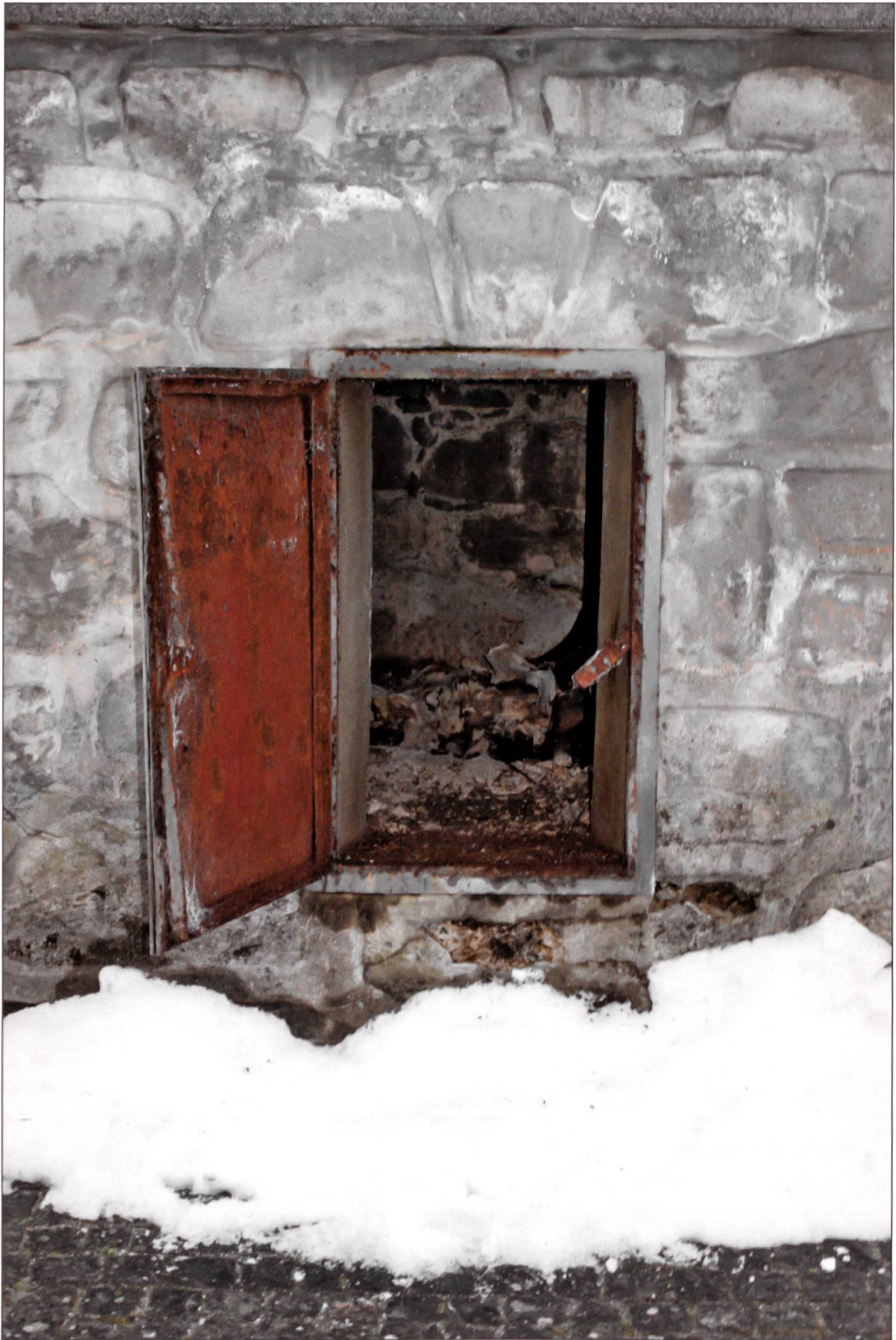
Blick in das «Chelelöchli» von Willisau.