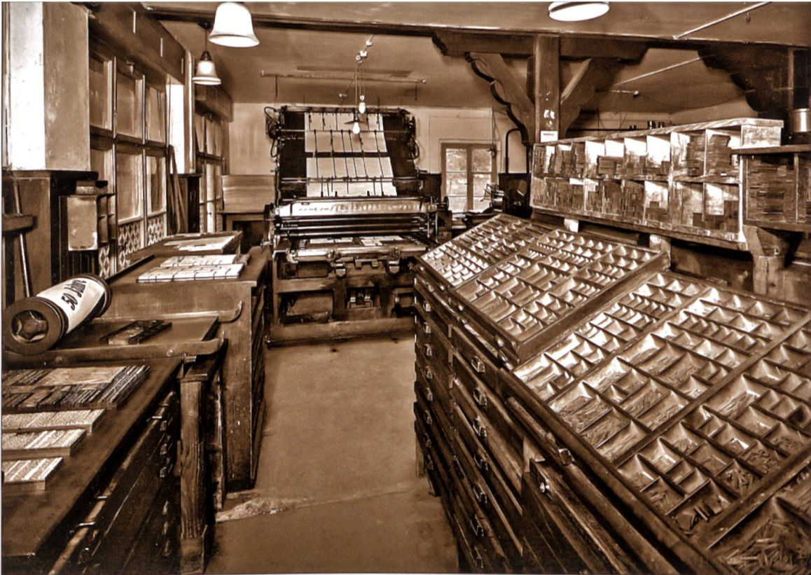
Hier zeigt sich der technische Wandel besonders deutlich: Blick in die ehemalige Setzerei.

lung der Familie fördern, aber auch den politischen und wirtschaftlichen Fragen die gebührende Aufmerksamkeit schenken». Das neue Produkt erhielt den Namen «Die Familie» und erschien erstmals in der zweiten Dezemberwoche 1921. Gedruckt wurde es in einem Gebäude in der Nähe des Bahnhofs. Den dadurch entstandenen Übernamen «Vatikan» trägt dieses bis heute.