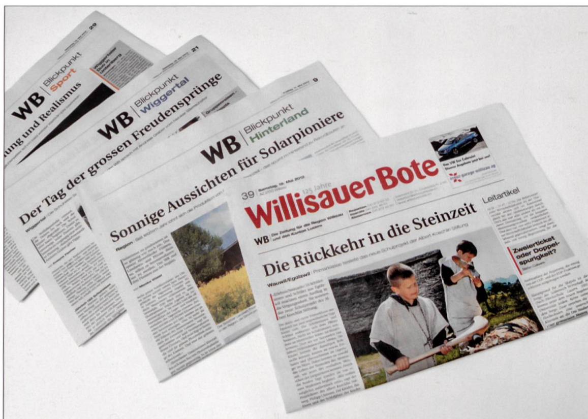
Heute präsentiert sich der WB als moderne 4-Bund-Zeitung.

erscheint der «Willisauer Bote» im Internet mit einem komplett überarbeiteten Auftritt. Dieser enthält sowohl Fotogalerien als auch in Eigenregie produzierte Videos über lokale Ereignisse. Gleichzeitig liefert WB-Allmedia regionale News auf spezielle TV-Bildschirme in Geschäften und Cafés. Als eine der ersten Lokalzeitungen der Deutschschweiz ist der «Willisauer Bote/Wiggertaler Bote» seit dem 8. April 2011 zudem auch in digitaler Form als E-Paper erhältlich. Der WB kann also auf der ganzen Welt gelesen werden.