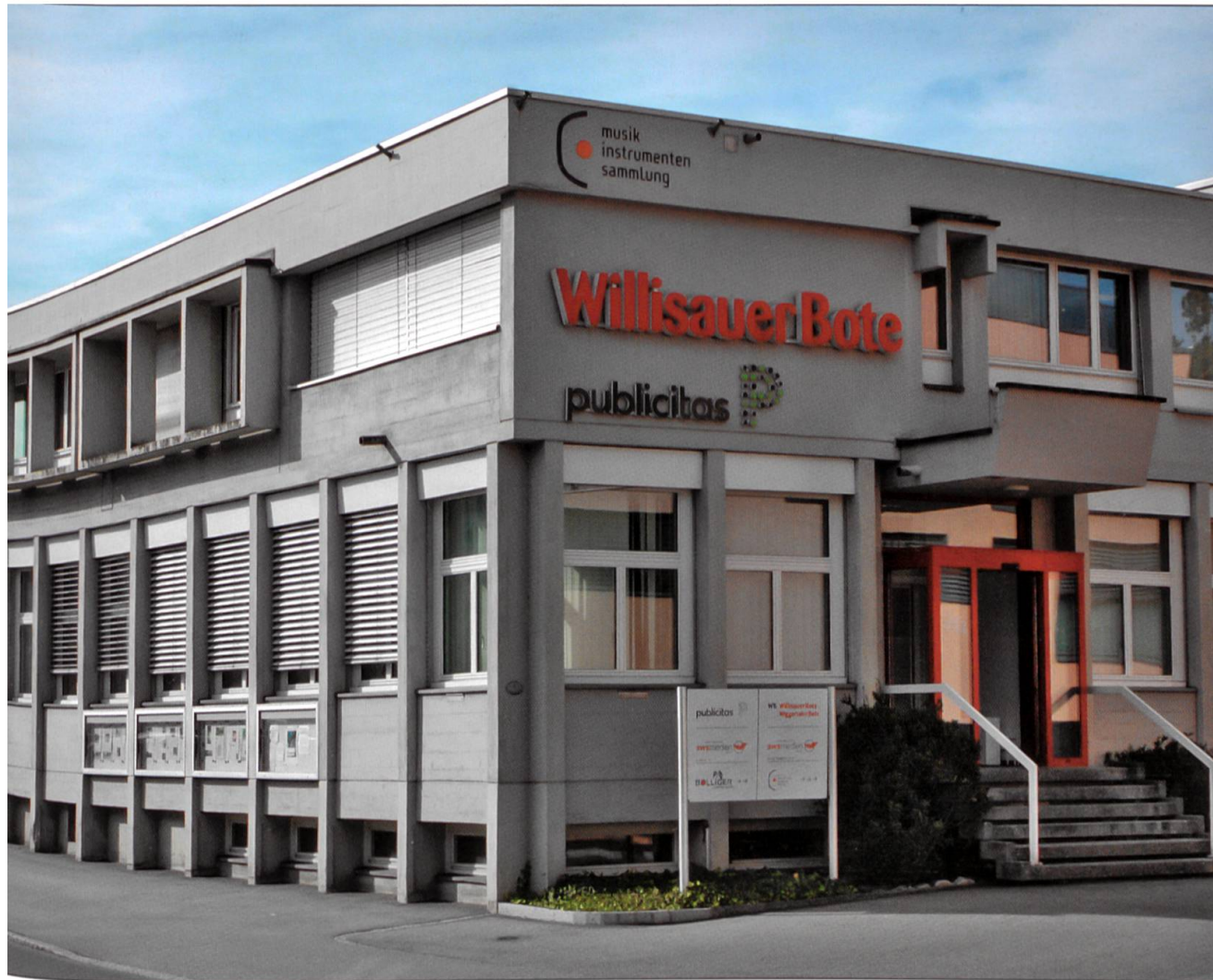
Das Gebäude der SWS Medien AG Verlag im Jubiläumsjahr 2012.

eben gerade wegen des Internets: «Unser Grundauftrag bleibt wichtiger denn je: ein verlässlicher Kompass in einer immer unübersichtlicheren Flut von Nachrichten und Ereignissen zu sein. Glaubwürdigkeit spielt dabei eine zentrale Rolle.»