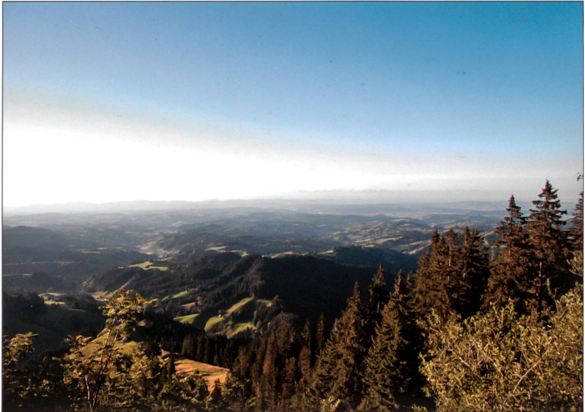
Blick vom Napf über Nebikon...