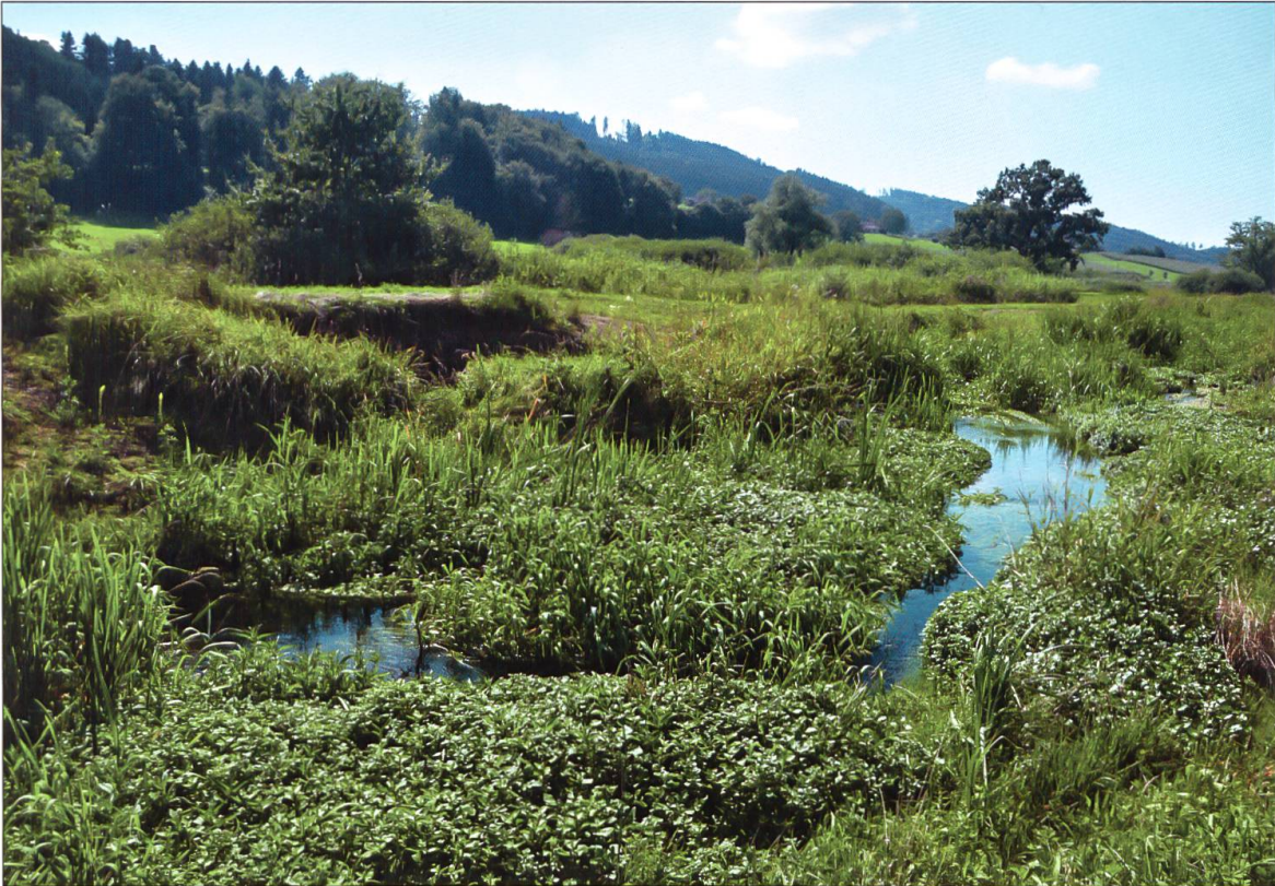
... fließt der Hürnbach wieder frei und mäandriert.