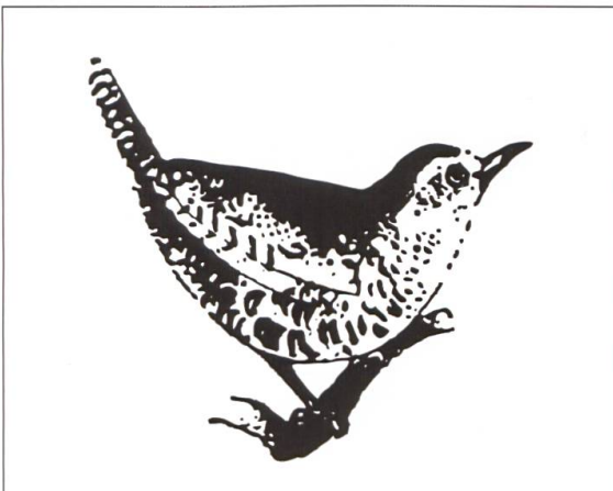
Auch das Vereinssignet unterliegt dem Wandel: Logo Zaunkönig 1973 und neu seit 2013.