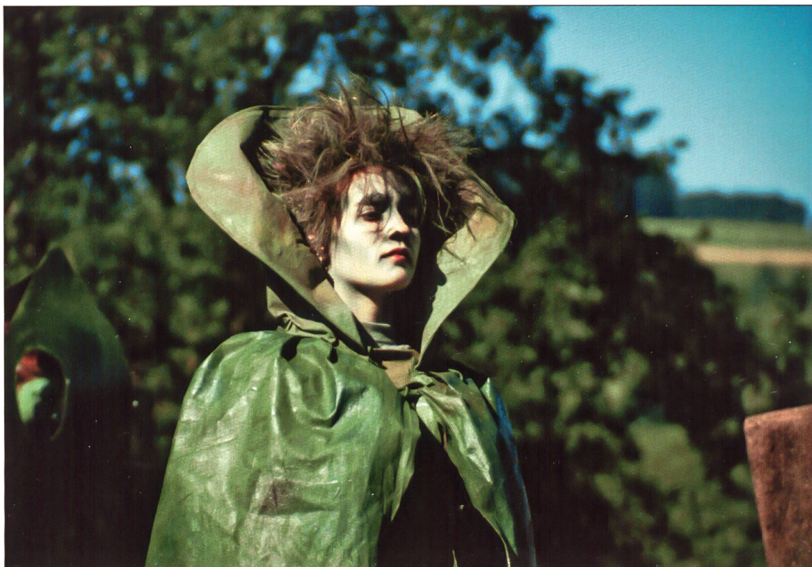
Aufführung direkt im Uffiker-Buchsermoos: sagenhaftes Schultheater an den Moostagen 2000.