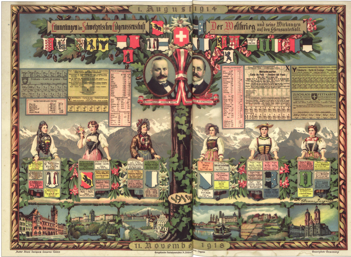
«Der Weltkrieg und seine Wirkung auf den Lebensunterhalt». Graphische Kunststätten A. Tribi & Cie. Artau - Lugano. Autor: Diani Jacques, Locarno.