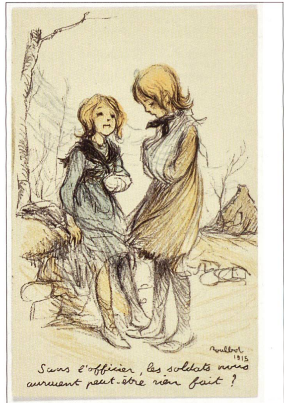
Französische Postkarten aus der Zeit des Ersten Weltkriegs.