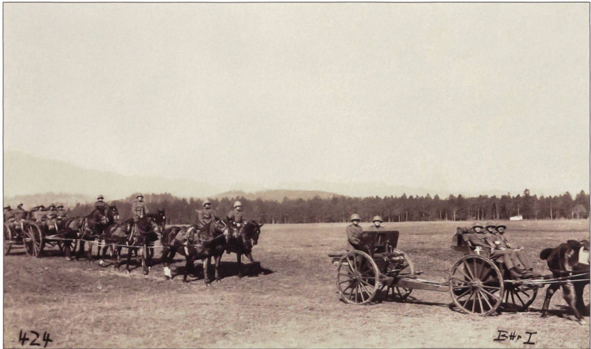
Undatierte Foto, Batterie I.

schule» 9 verschärfte den sozialen Zündstoff in der Schweiz. Zwar beschäftigte sich der Bundesrat 1912 mit kriegswirtschaftlichen Fragen, allerdings nur unter dem Aspekt der Versorgung der Armee mit Getreide. Ziemlich leichtfertig ging der Bundesrat davon aus, dass man «sich bei längerer Kriegsdauer zwecks Sicherstellung der Landesversorgung einer der kriegsführenden Mächte anschliessen» müsse. 10 «So bestand die einzige Kriegsvorbereitung in einem knapp zwei Monate reichenden Getreidevorrat.» 11 Das Versorgungsproblem wurde vor allem von Generalstabschef Theophil Sprecher erkannt, der deutlich zum Ausdruck brachte, dass «die Erhöhung der Getreidevorräte auf einen längeren Bedarf, wenigstens für 100 Tage» 12 , notwendig sei, aber Bundesrat Giuseppe Motta «blockierte jeden Versuch, die Vorräte zu vermehren, denn die Schonung der Finanzen schien ihm