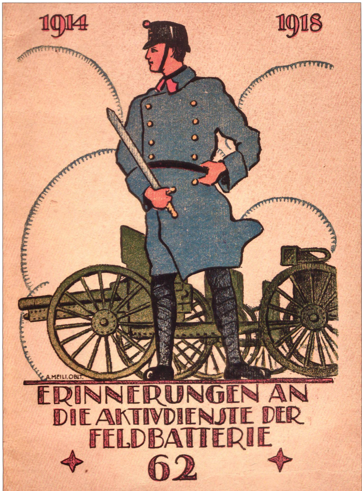
Erinnerung an die Aktivdienste der Feldbatterie 62. Buchdruckerei Al. Ziegler, Luzern 1920 (Broschüre mit Schwarz-Weiss-Fotos). Die Feldbatterie 62 war der Feldartillerie – Abt 22 eingegliedert, welche ihrerseits Teil des Artillerie-Regiments 8 der Felddivision 8 war. Die Batterie war mit 7,5 Zentimeter Feldkanonen ausgerüstet.