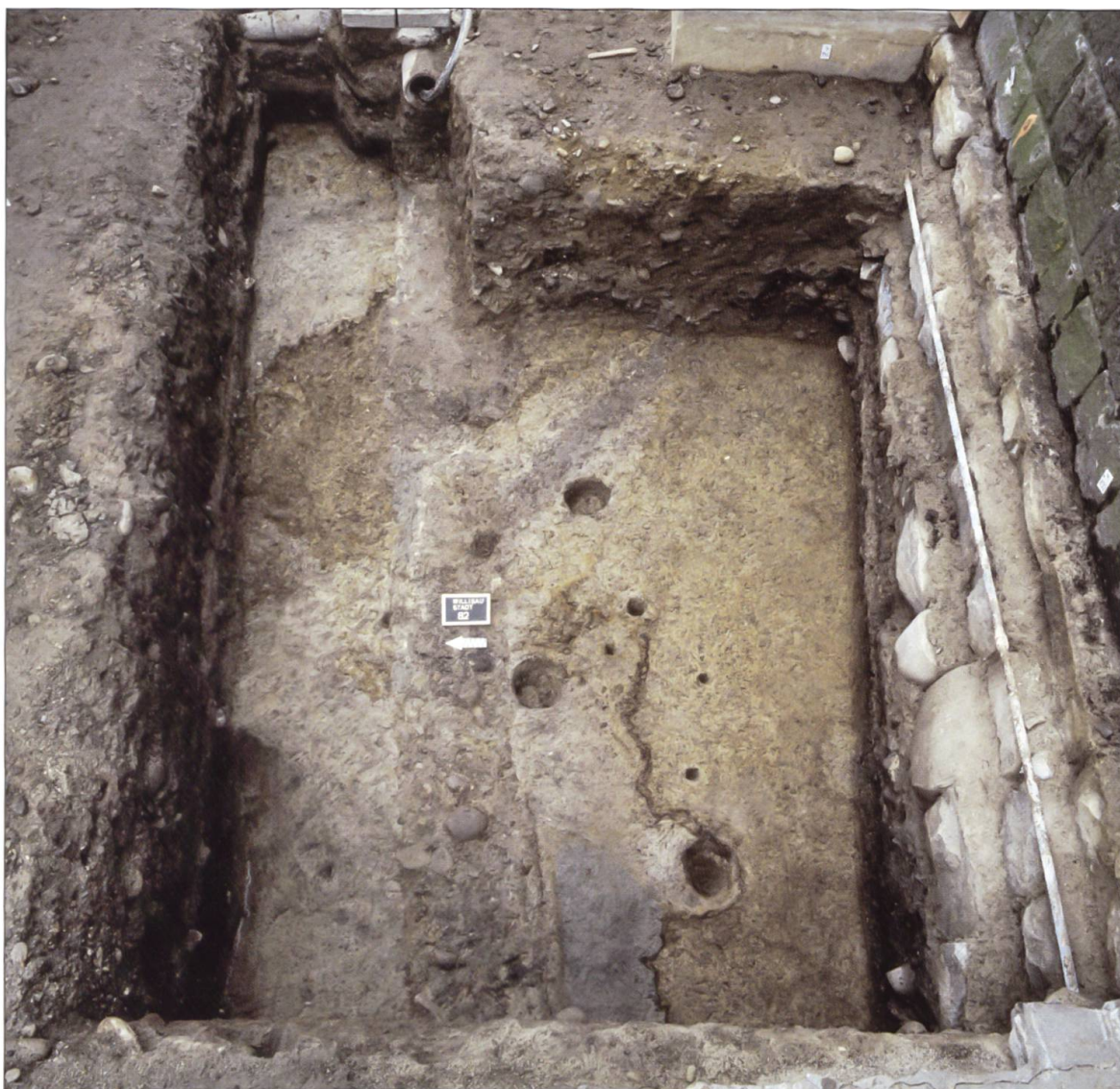
Am Fuss der Kirchhofmauer zeichnen sich in einer Grabungsfläche von 1995 verschiedene Pfosten- und Staketenlöcher ab, welche von der Besiedlung Willisaus vor der Stadtgründung zeugen.