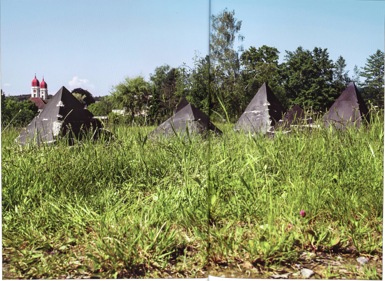
Stalpur-Pyramiden, 2010. Spezialspalt mit Additiven und Mineralstoffen; Breite/Tiefe/Höhe: 1,80/1,80/2,10 Meter; Gewicht: 3,2 Tonnen. Kunstkarte der Heimatvereinigung Wiggental, Aktion Altbau Sorg zur Heimat 2013.