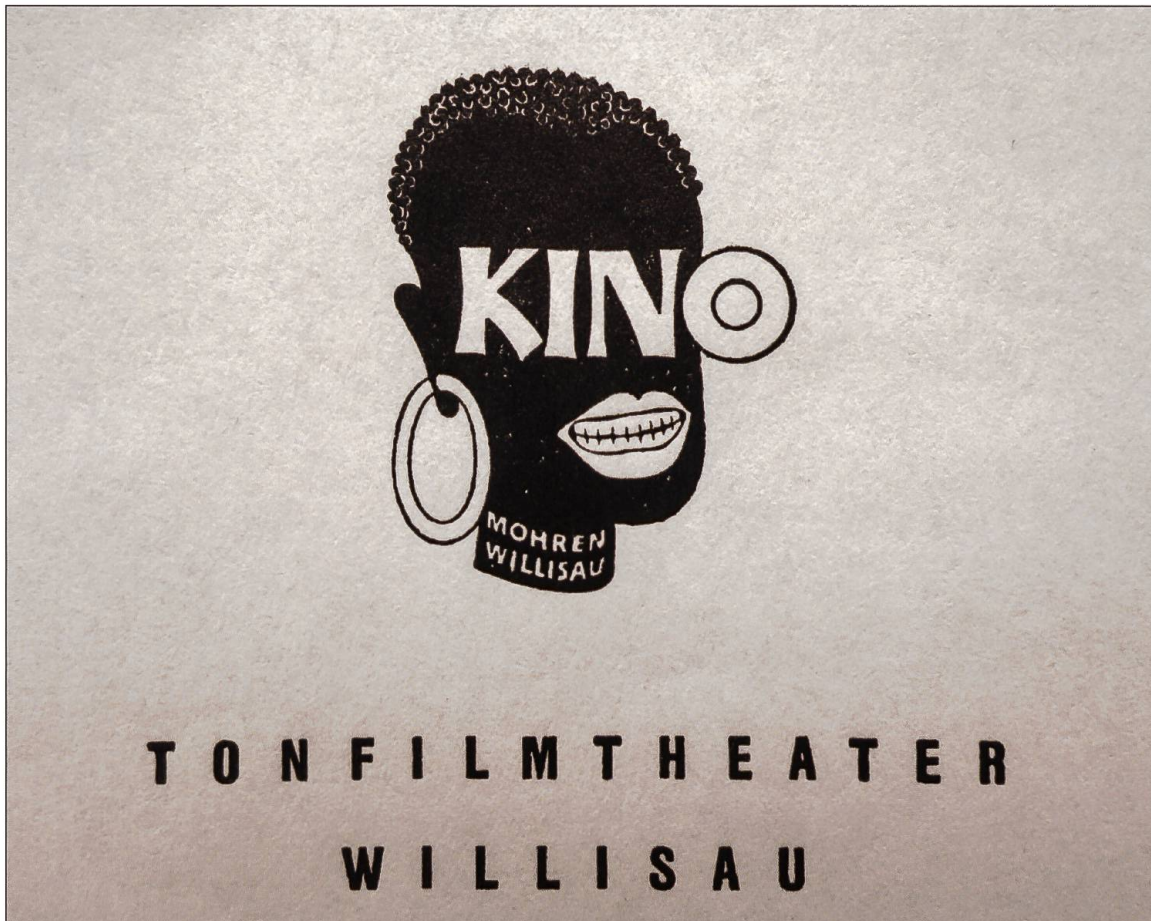
Briefkopf, Logo Kino Mohren in Willisau, 1948. Staatsarchiv Luzern, Signatur A 1195/698