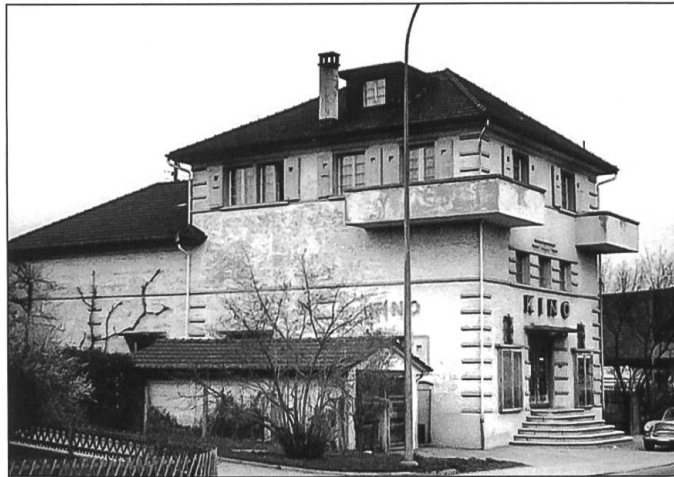
Das Kino Capitol in Reiden, undatierte Aufnahme des Kinobetreibers Friedrich Umbricht, wahrscheinlich kurz nach der Schliessung 1972.

Nahe der Kantonsgrenze eröffnete Fritz Plüss aus Zuchwil in Reiden 1933 das «Capitol» in einem Neubau an der