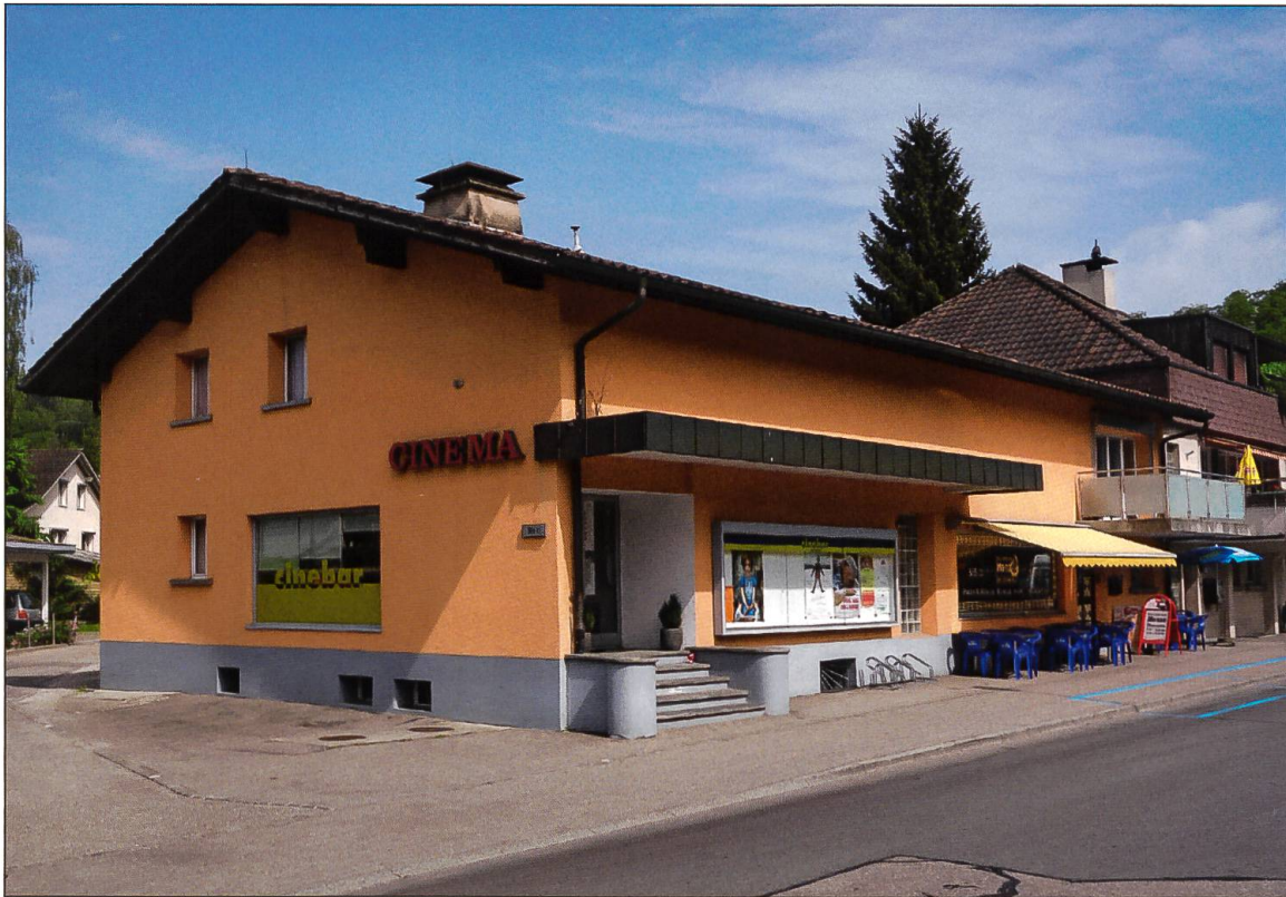
Das Kino Mohren in Willisau, Mai 2015.