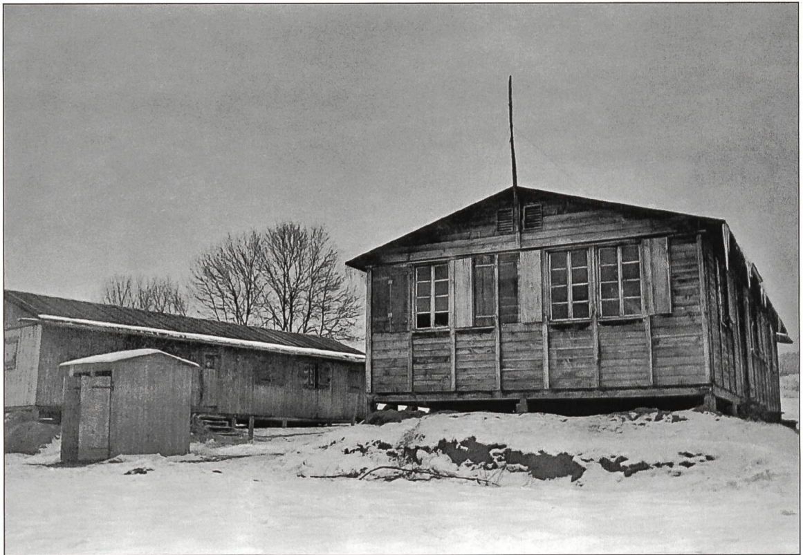
Straflager Wauwilermoos im Winter 1944.

Der psychisch überforderte und mit Nazi-Deutschland geheim sympathisierende Lagerkommandant André Béguin im Wauwilermoos.