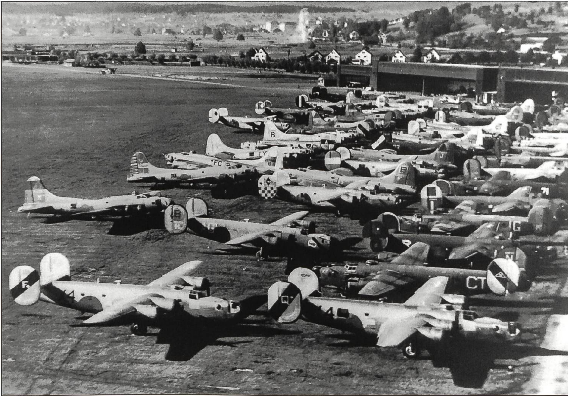
Auf dem Flugplatz Dübendorf wurden zur Landung gezwungene oder notgelandete amerikanische Bomber abgestellt: Amerikanische Bomber in Dübendorf 1944.

namentlich auch in unseren Gemeinden einquartiert waren, wurde öffentlich wenig erinnert. Gerade über das Internierten-Straflager Wauwilermoos, das die Schweizer Militärjustiz in den Jahren 1941–1946 führte, wurde kaum berichtet.