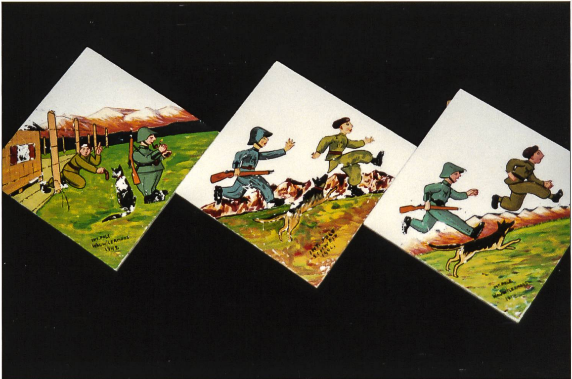
Bemalte Kacheln, welche Szenen im Zusammenhang mit dem Schäferbund-Detachement der schweizerischen Bewachungstruppen zeigen.