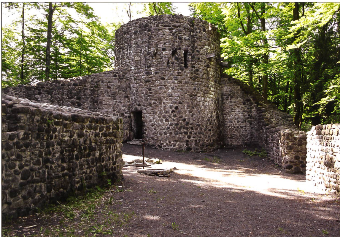
Die Ruine der Wildenburg, im 13. und 14. Jahrhundert einer der wichtigsten Sitze der Hünenberger, liegt auf einem Felsporn im Lorzentobel, auf der halben Strecke zwischen Baar und dem Ägerital. Sie ist als die einzige gut erhaltene Burganlage im Besitz des Kantons Zug. Zwei Fusswege führen zur ummauerten Anlage mit mächtigem Turm.