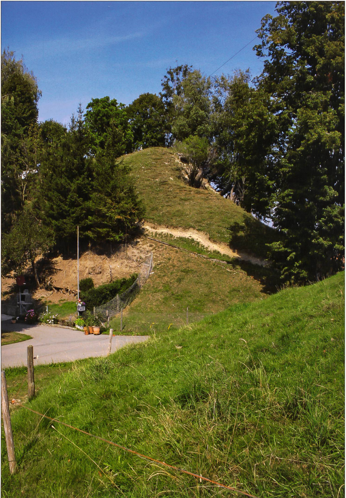
Die heutigen überwachsenen Reste der stolzen Walsburg in Luthern. Der mächtige, künstlich angelegte Halsgraben lässt auf eine ehemals beeindruckende Grösse schliessen.