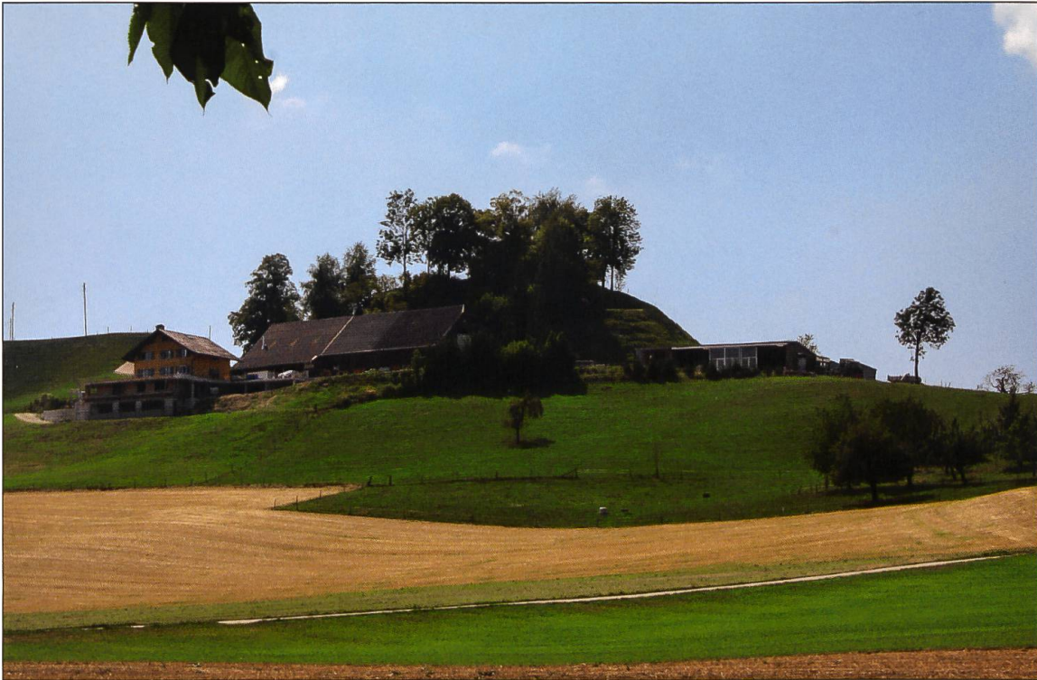
Der Hof «Schloss» vor dem Burghügel der Walsburg.