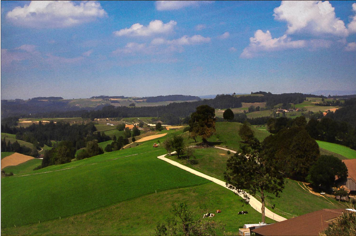
Blick von der Walsburg (Luthern) über den Baren bis Schönetüel und Bodeberg.