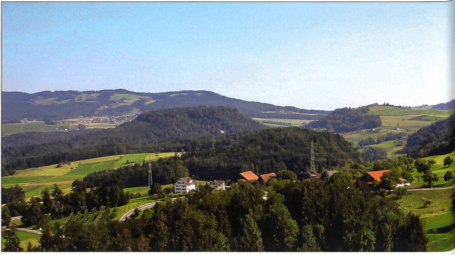
Die Liegenschaften Inkenberg (Baar ZG, vom linken Bildrand bis zum rechten Rand). Durch die Bildmitte führt noch heute die Strasse nach Ägeri.