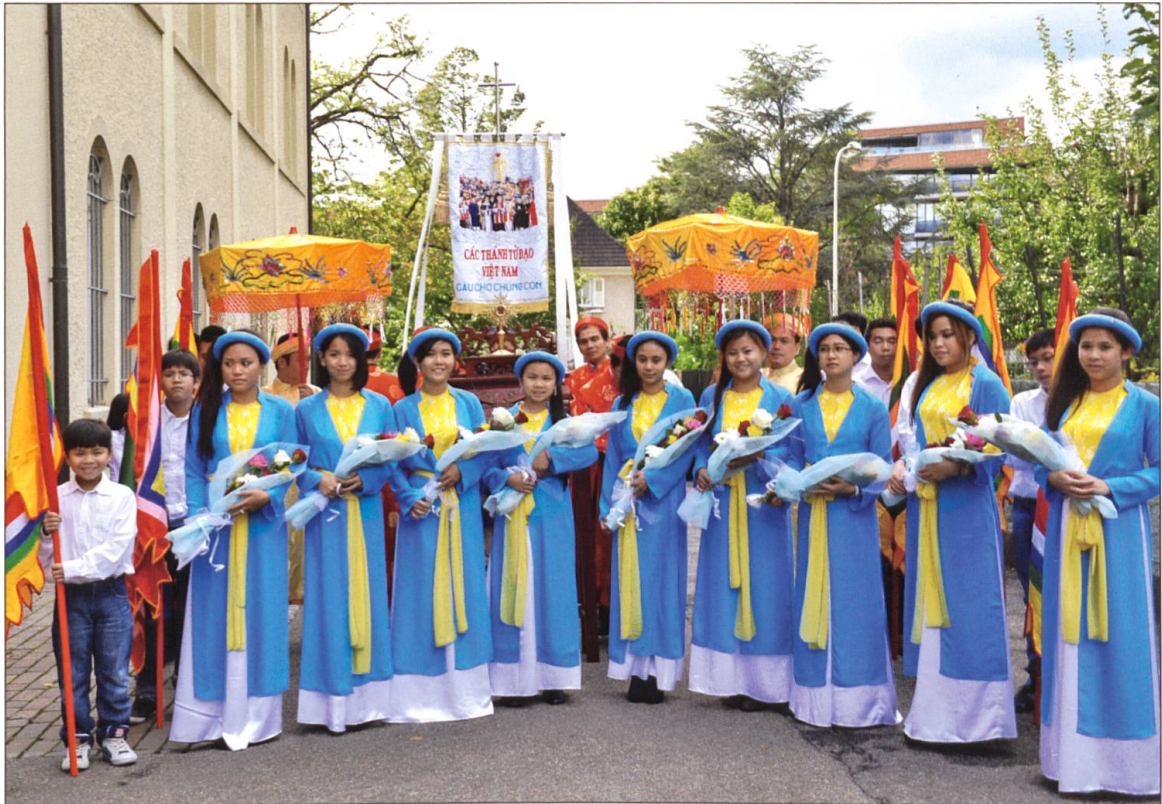
Gottesdienst zu Allerheiligen in Olten zu Ehren der 117 heiliggesprochenen vietnamesischen Märtyrer.

morgens in die Arztpraxis gehe, mit meinem Namen begrüsst werde und wenn ich den Menschen aus der Umgebung helfen kann. Das bedeutet für mich Heimat.