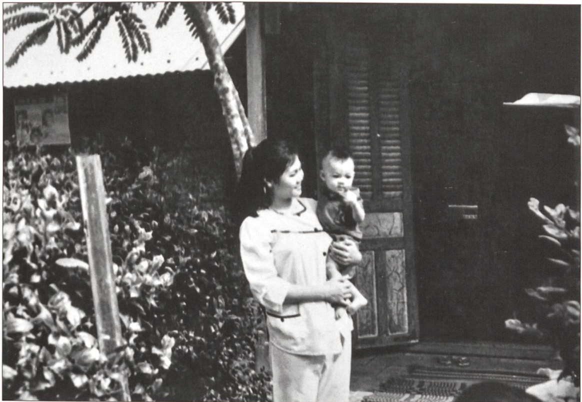
Mutter und Khanb vor dem Haus.