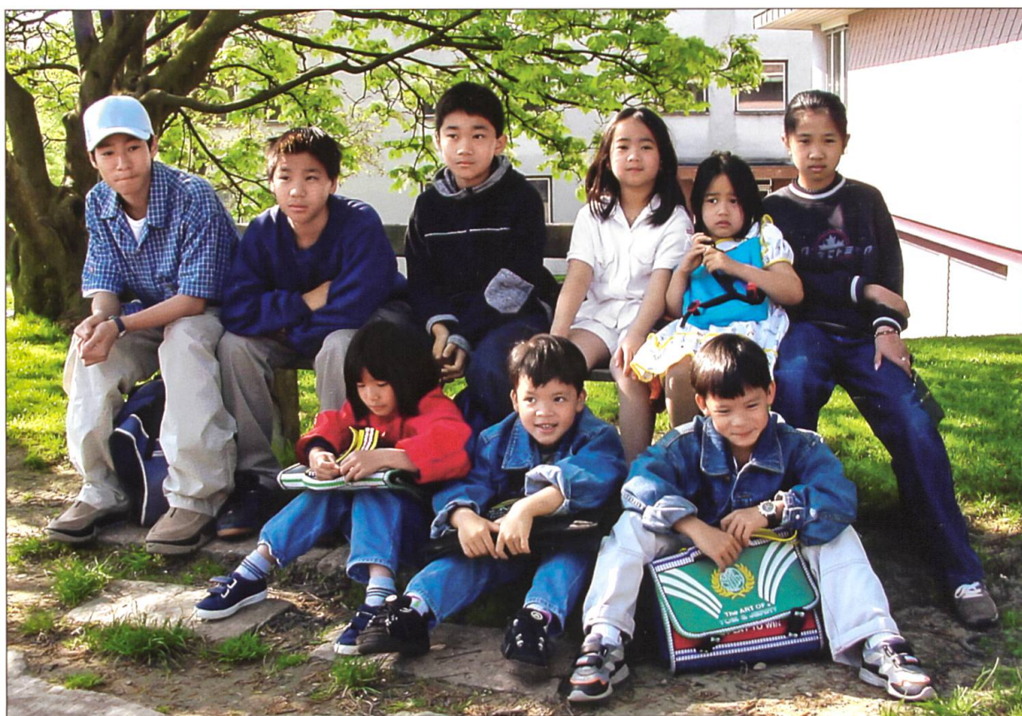
Kinder der vietnamesischen Schule in Luzern.

für uns einen hohen Stellenwert. Wir pflegen unsere Kultur auch ausserhalb der Familien, indem wir die vietnamesischen Gottesdienste oder Freunde und Bekannte besuchen. In Luzern gibt es eine kleine vietnamesische Schule, wo die Kinder auch Vietnamesisch schreiben lernen.