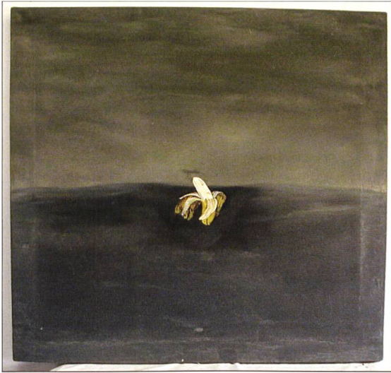
Alois Lichtsteiner AL1977.001 Banane (Trainingszeiten) 1977 Öl auf Leinwand 128 x 121 Zentimeter