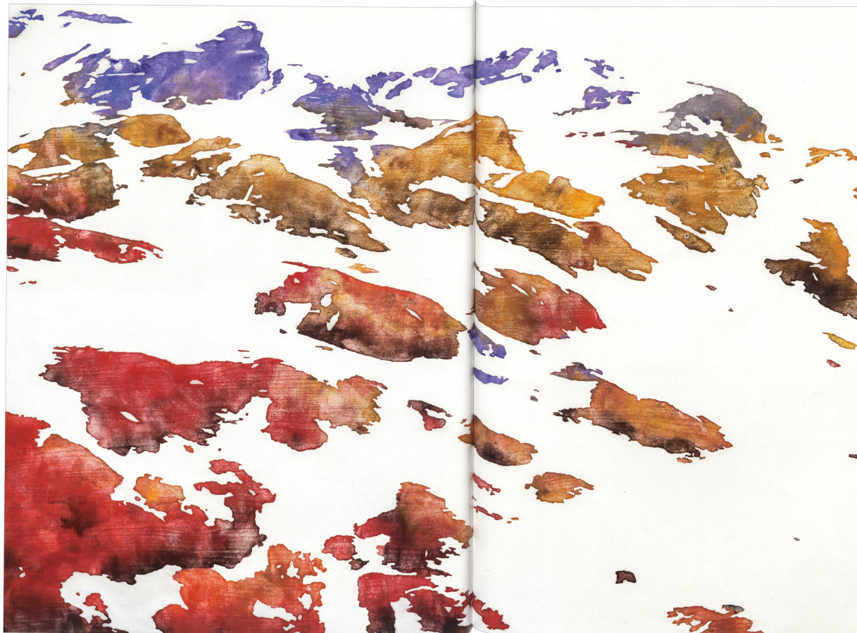
Alois Liebsleiter, Murten/Paris, AL2013.091, ohne Titel (Berg) , Monotypieartig eingefärbter Holzschnitt, Öl auf Tosa Sboji, Japanpapier, 100 x 149 Zentimeter, Heimattvereinigung Wiggertal, Aktion „Hab Sorg zur Heimat“, 2016.