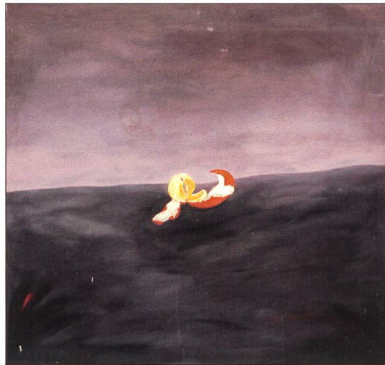
Alois Lichtsteiner AL1977.016 Orange (Trainingszeiten) 1976 / 1977 Öl auf Leinwand 128 x 121 Zentimeter

Alois Lichtsteiner beschreibt seine Empfindung wie folgt: «Die Leinwand ist der Körper, man legt mit Pinsel und Farbe eine Haut darüber und nochmals eine Haut. Es ist am Ende das, was man selber ist mit seinem eigenen Körper. Das Bild ist eine Art, die Gedanken nach innen zu richten und gleichzeitig nach aussen. Für mich ist das Gemälde auch ein Wesen, das den Kontakt mit anderen Wesen sucht. Beide, das Bild und der Mensch, stellen die grundlegenden Fragen nach dem inneren Zusammenhang der Welt.»