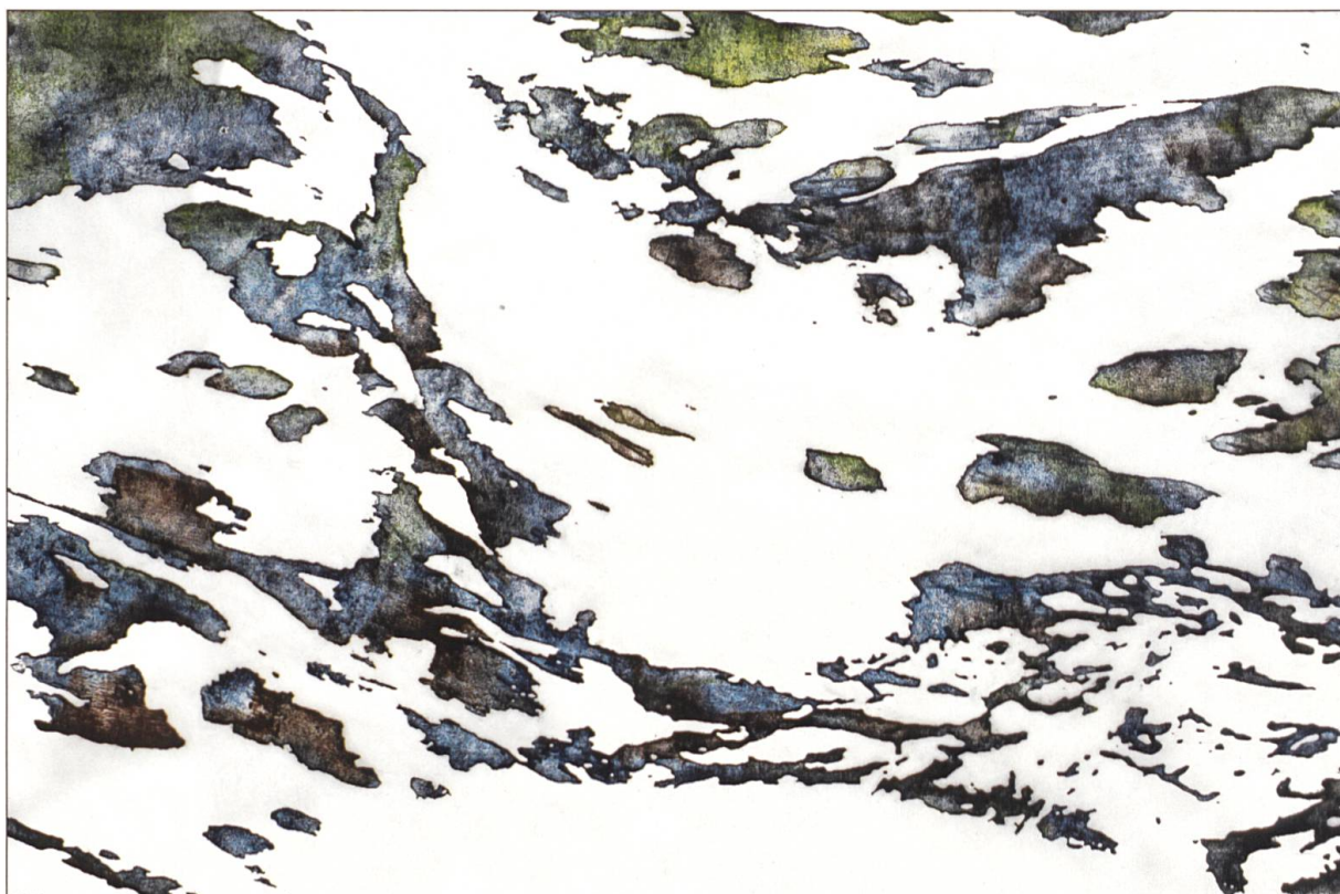
Alois Lichtsteiner, Murten/Paris. AL2014.129, ohne Titel (Berg). Monotypieartig eingefärbter Holzschnitt, Öl auf Tosa Shoji, Japanpapier, 59 x 89 Zentimeter. Heimatvereinigung Wiggertal, Aktion «Häb Sorg zor Heimet», 2016.