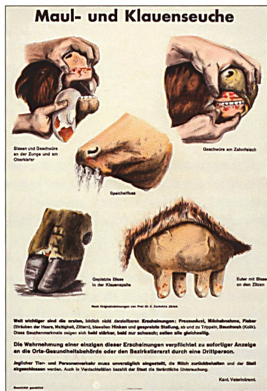
Schulungsplakat zum Thema Maul- und Klauenseuche.