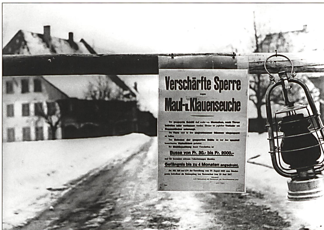
Bauernhöfe waren als Ganzes abgesperrt. Die Bauerfamilien auf diesen Betrieben durften den Hof nicht verlassen.