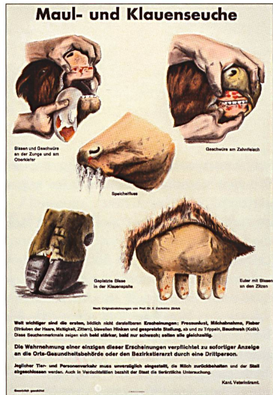
Schulungsplakat zum Thema Maul- und Klauenseuche.