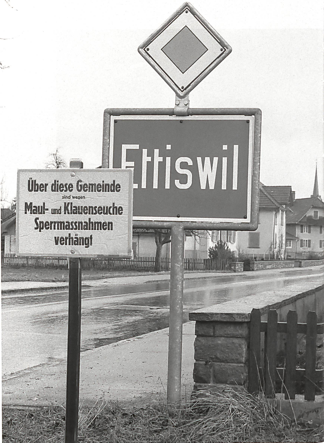
Hinweistafeln beim Dorfeingang.