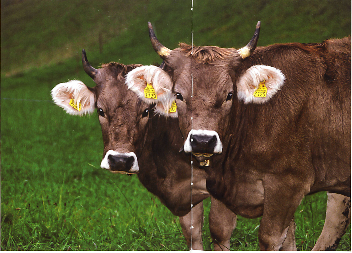
Heute genessenen Kübe die Freiheit, ohne Maul- und Klauenseuche befürchten zu müssen. Das war nicht immer so.