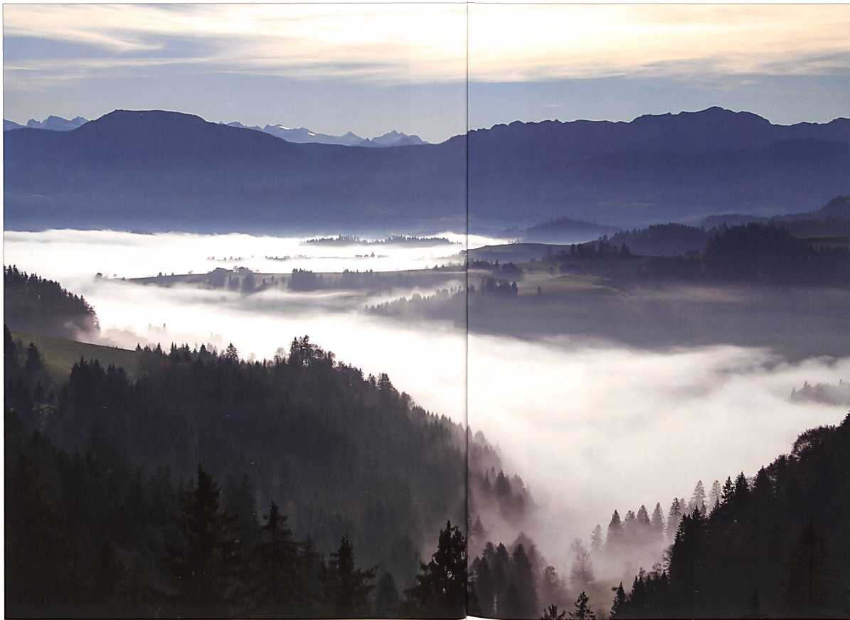
Wer in einem Staat lebt, dessen Strukturen nicht erkennbar sind, flüchtet in einen Staat, wo Sicherheit herrscht... Blick vom Menzberg Richtung Berner Alpen.