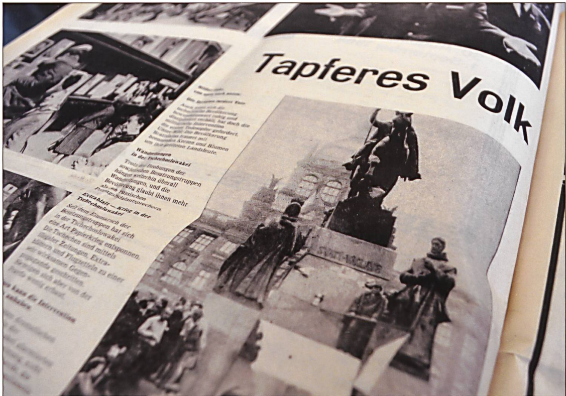
Das Ende des Prager Frühlings beschäftigte auch die Lokalmedien – wie hier im «Willisauer Boten» zu sehen ist.