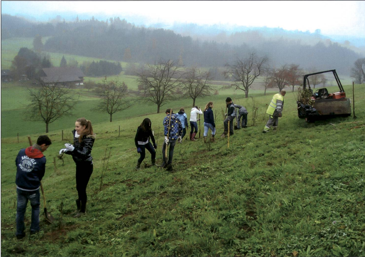
Grosswanger Schulklasse beim Pflanzen einer neuen Hecke.

gelang, einen Beitrag zur Fernvernetzung von bedeutenden Feuchtgebieten zwischen Ostergau und Hetzligermoos, Buttisholz, zu leisten.