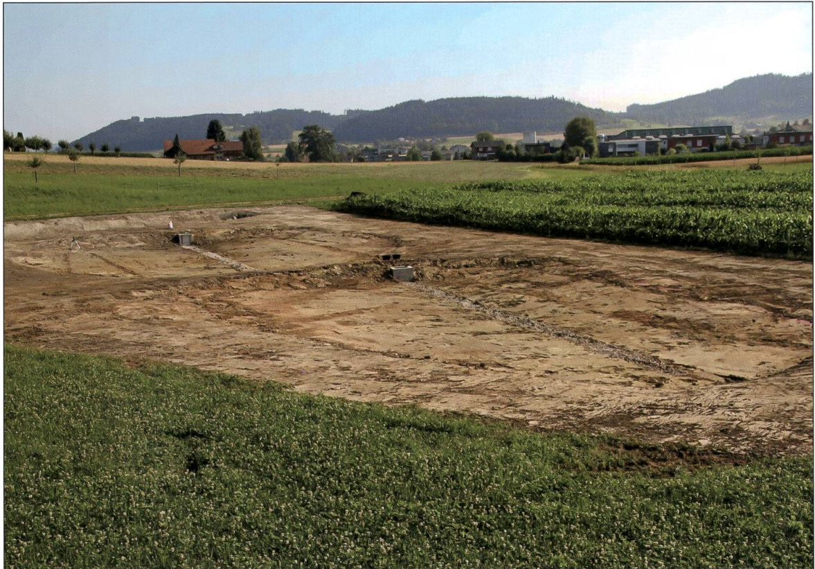
Flutmulde im Rohbau 2015.