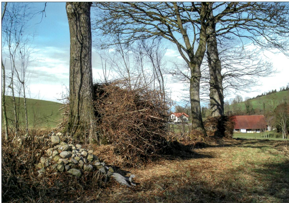
Gut dimensionierte Stein- und Asthaufen.

ten Listen in der Schweiz sind lang. Sehr oft treffen die verschiedenen Nutzungsansprüche zu engmaschig aufeinander. Im Projektgebiet gibt es kein richtiges Monitoring, also keine präzise Verfolgung der Entwicklung. Trotzdem treffen immer wieder Meldungen von posi-