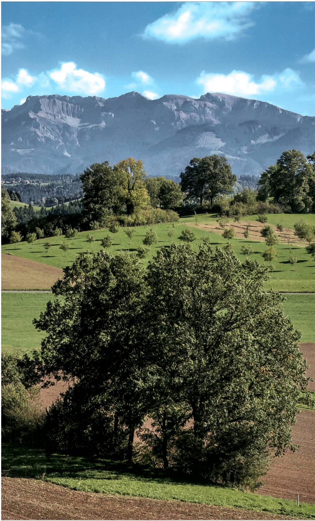
Einmalige Kulturlandschaft in Blochwil.