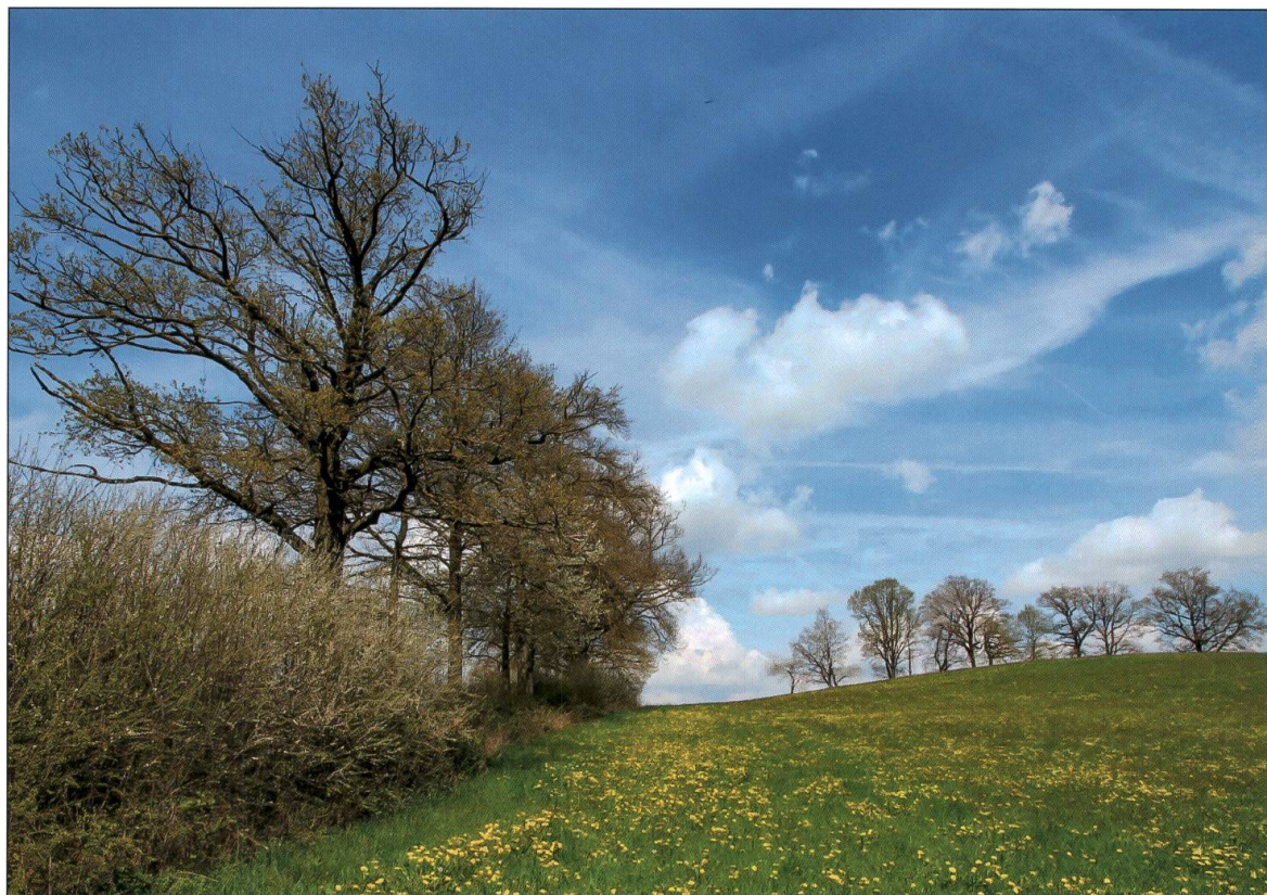
Typische Hecke aus dem Projektgebiet mit grossen Eichen.

solche naturnahen Elemente engagieren würden.