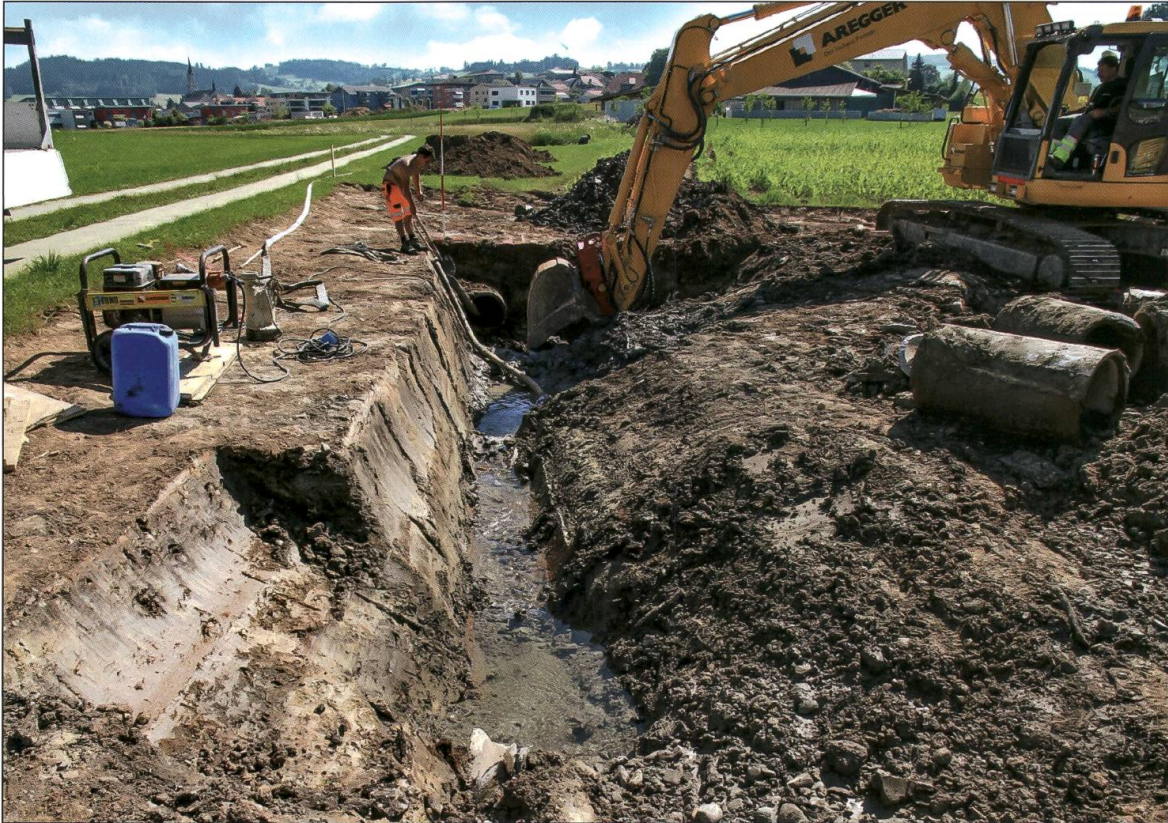
Ein Stück des Heubächlis in Grosswangen wird ans Tageslicht geholt.

nahe Lebensräume sind keine Garantie für den Erhalt von Arten, aber ohne sie ist ihr Verlust programmiert.