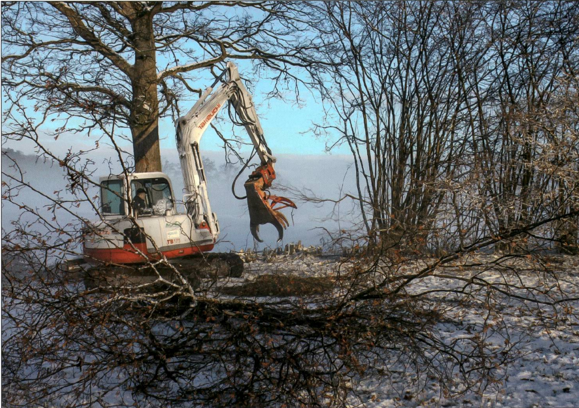
Fällgreifer beim Auslichten einer Haselhecke.

werden, nur wie? Erste Wahl ist die Motorsäge, doch wächst die Hasel sehr schnell nach und muss fast jährlich eingekürzt werden. Speditiver war der Fällgreifer, ein Anbaugerät am Bagger. Recht radikal Schluss mit Haseln machte die Stockfräse, die zum Einsatz kam, wo das Gelände es zuliess und der Heckenbestand bloss aus Haseln bestand. Insgesamt konnten auf diese Weise knapp sechs Kilometer Hecke aufgewertet werden. Es wurden über 6000 Sträucher und gegen 150 Jungeichen, unter anderem mit der Unterstützung von Schulklassen und eines Rotary-Clubs, eingepflanzt. Die Aufwertungsarbeiten erfolgten in Absprache mit den Bewirtschaftern. Das Projekt organisierte und finanzierte das Pflanzenmaterial und leistete Beiträge an die Aufwertungsarbeiten.