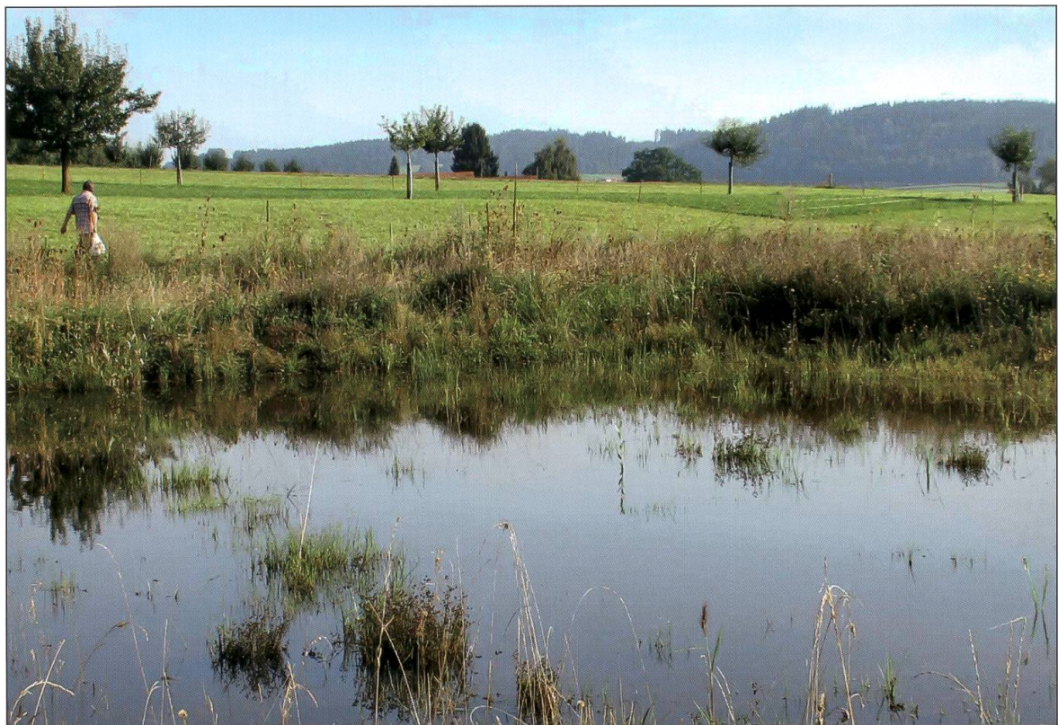
Flutmulde in Betrieb 2017.