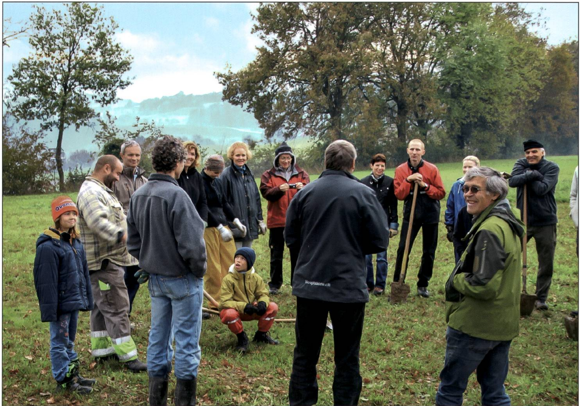
Mitglieder des Rotarys Luzern beim Pflanzen von Heckensträuchern.

Schweiz. Mit diesen Wiesen verabschieden sich auch sehr viele Sommervögel/Schmetterlinge, Käfer, Bienenarten, aber auch deren Räuber wie Vögel oder Eidechsen. Darum heisst es neu ansäen, was aber nicht leicht zu bewerkstelligen ist. Geeignete Flächen müssen mit einer für Luzerner Verhältnisse abgestimmten Samenmischung angesät werden.