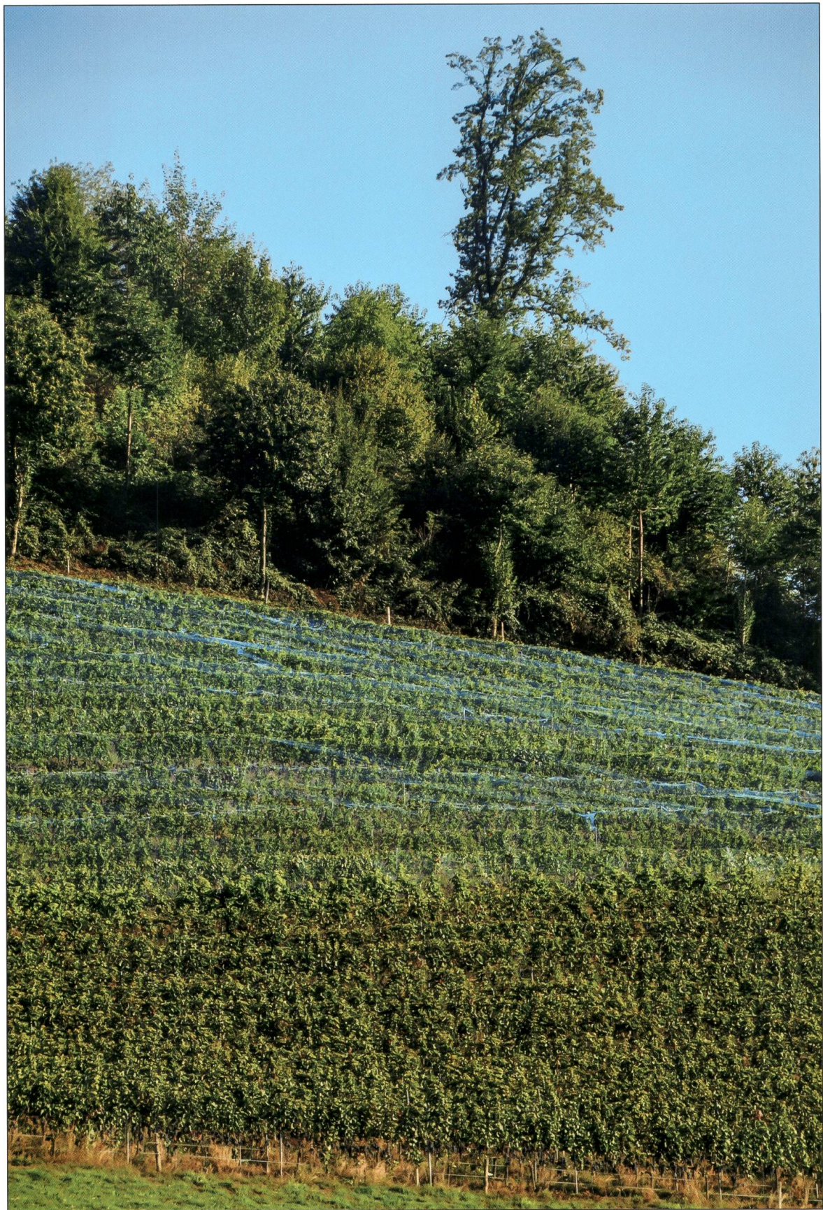
Rebberg Castelen, Alberswil.