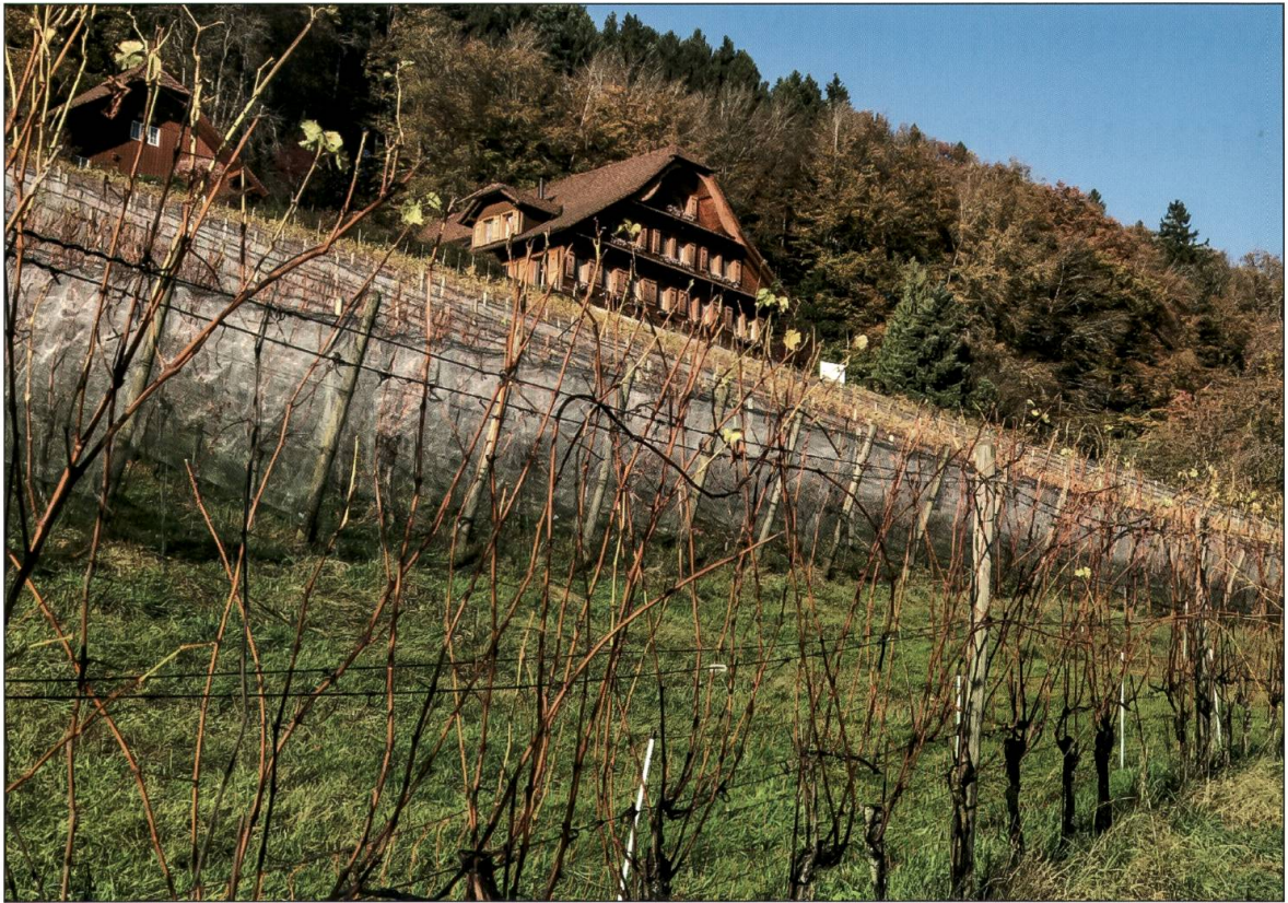
Der Hof Aengelberg über Egolzwil.