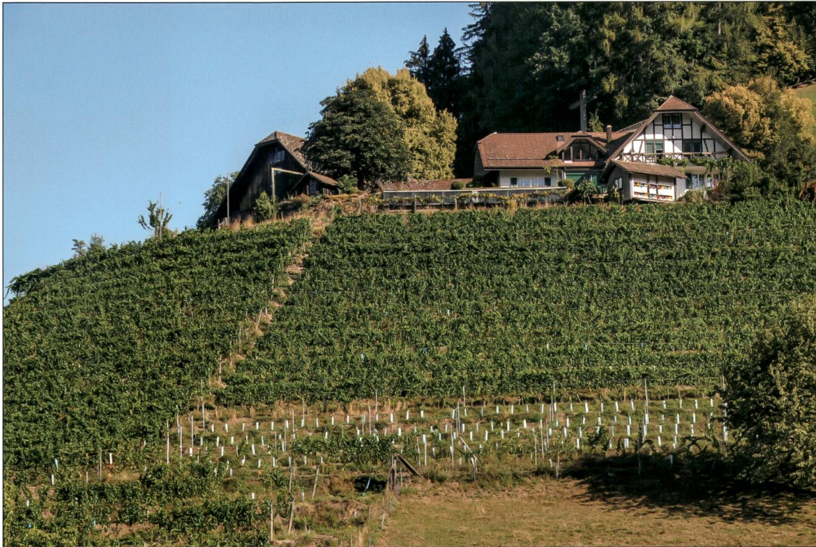
Rebberg Chrüzberg, Dagmersellen.