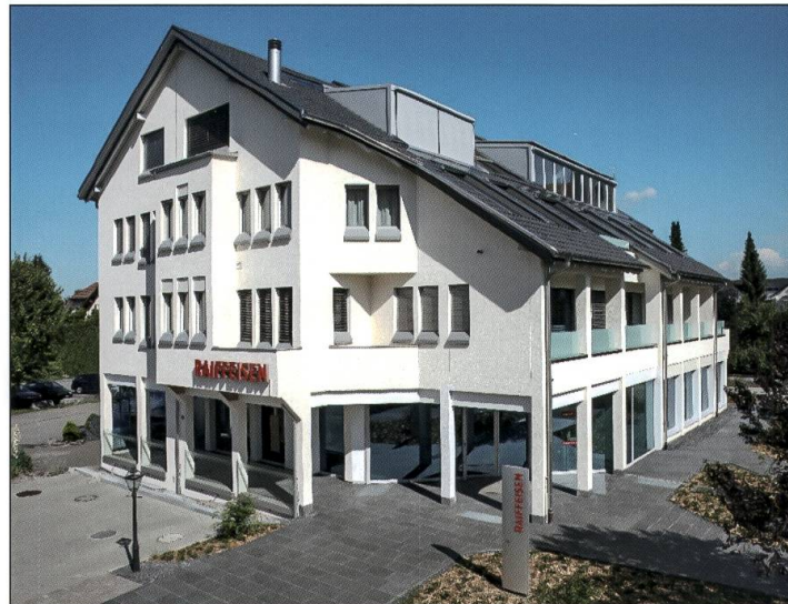
Raiffeisenbank Luzerner Landschaft Nordwest, Schötz.