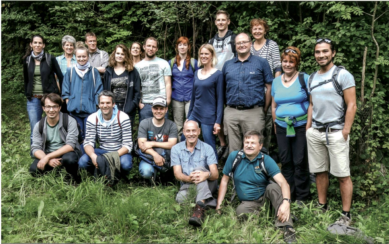
Das ilu-Team beim Geschäftsausflug auf dem Santenberg, Egolzwil-Wauwil.