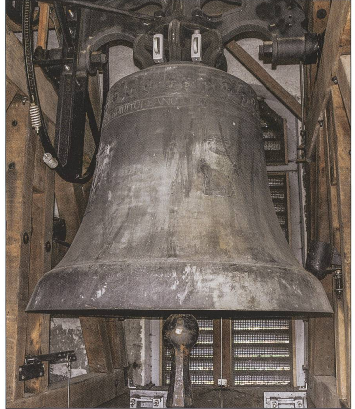
Im südlichen Turm hängen vier Glocken, links zwei kleine, in der Mitte des Glockenstuhls die grösste Glocke (rechts). Die Glocken dieses Turmes werden auch für die Viertelstunden- und Stundenschläge genutzt.