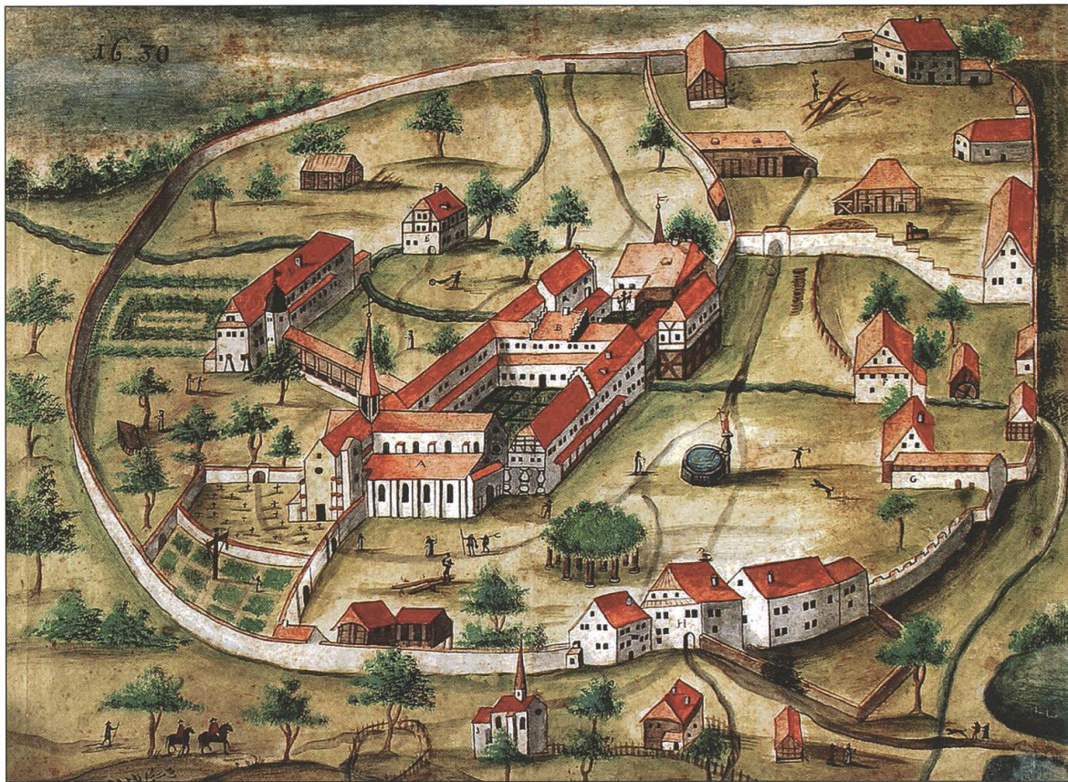
Ansicht der mittelalterlichen Klosteranlage von Nordwesten mit dem einfachen Dachreiter über der Vierung der Kirche, der mit zwei 1514 gegossenen Glocken ausgestattet war, 1630, Aquarell auf Papier, Staatsarchiv Luzern.