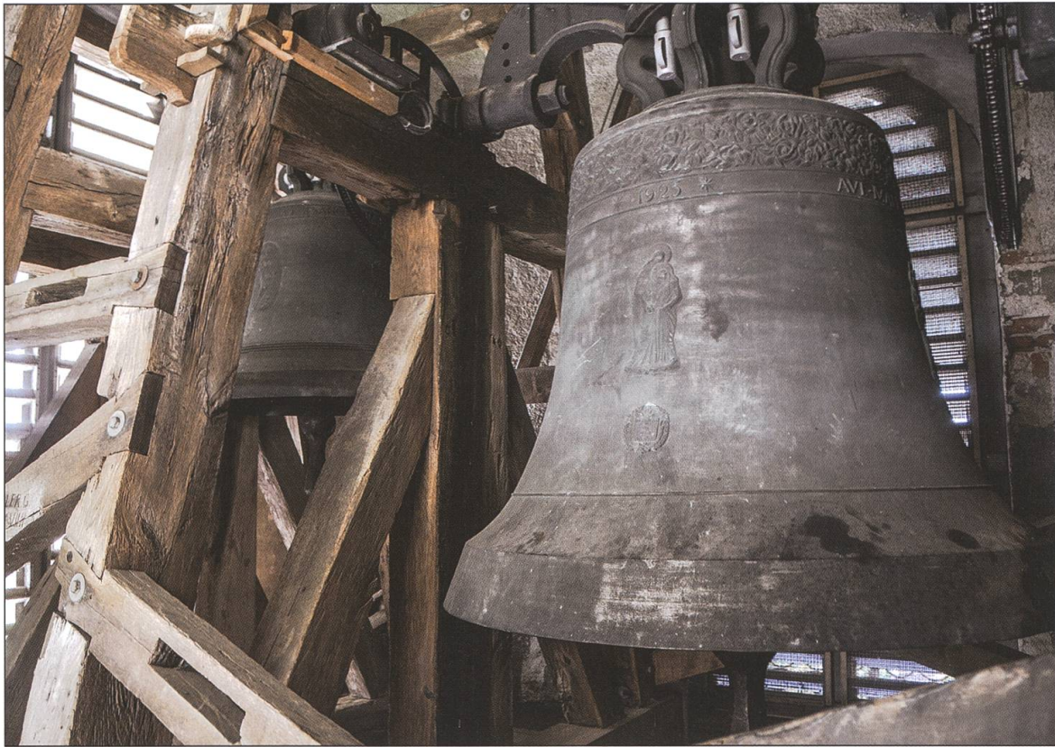
Im nördlichen Glockenturm hängen zwei Glocken.