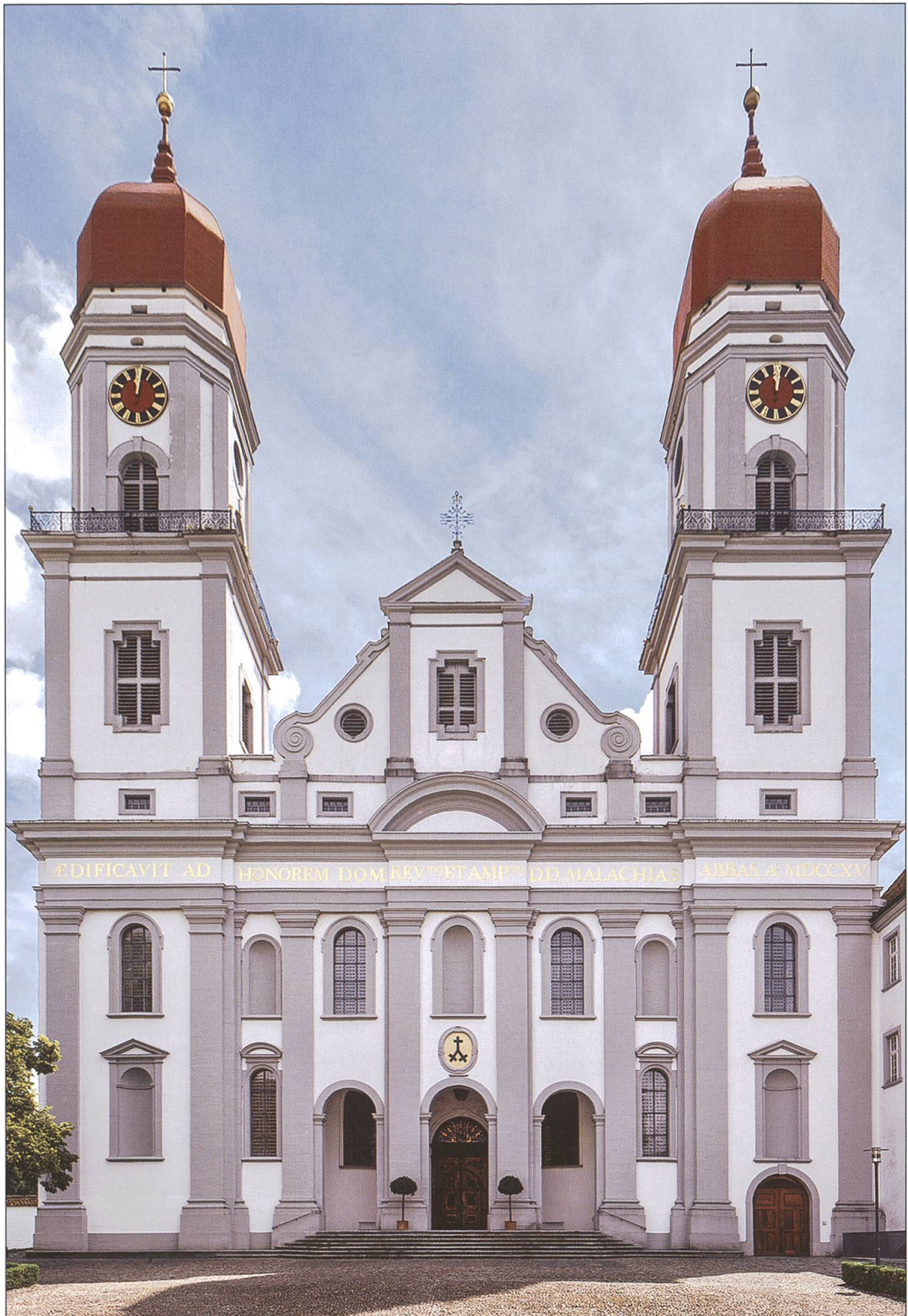
Die Hauptfassade der 1711–1717 vom Konstanzer Architekten Franz Beer geschaffenen Klosterkirche Sankt Urban mit den beiden Glockentürmen.