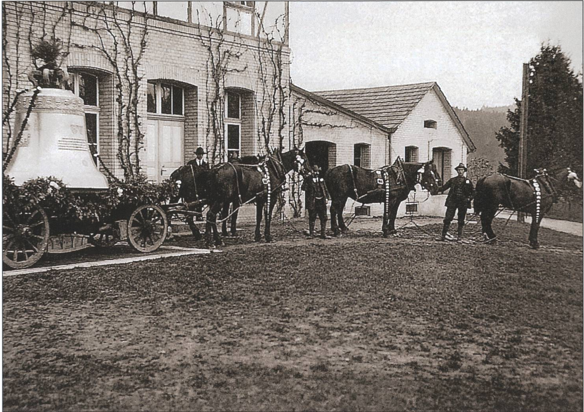
Die sechsspännig von Aarau nach Sankt Urban transportiere 4385 Kilogramm schwere Dreifaltigkeitsglocke.