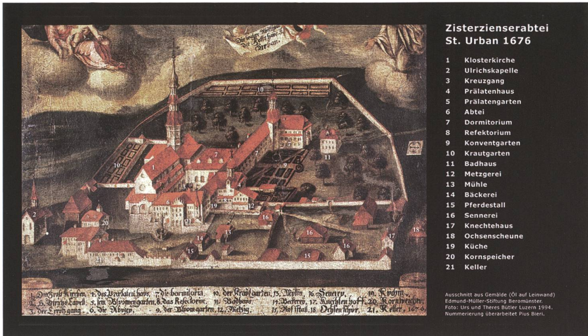
Ansicht der Klosteranlage von Südwesten mit dem 1674 erbauten barocken Vierungsturm, 1676, Öl auf Leinwand, Edmund-Müller-Stiftung, Beromünster.

Verfügung stehenden Fonds. Vor der Montage seien die Konstruktionspläne dem Regierungsrat zur Genehmigung zu unterbreiten. Schliesslich wurde festgehalten, dass die neuen Glocken im Sinne von Artikel 644 des Zivilgesetzbuches ein Zubehör der Anstaltskirche Sankt Urban, deren Besitzer der Kanton Luzern ist, werden. 7 Pfarrer Fries war über diesen Beschluss der Regierung sehr enttäuscht. Er strebte den Ankauf von sechs Glocken an, konnte nicht begreifen, warum sich der Kanton Luzern als Eigentümer der Kirche nicht daran beteiligen wollte, und dies trotz mündlicher Zusagen einzelner Regierungsratsmitglieder. Vor allem empörte ihn, dass er den gesammelten Fonds zur Vermehrung durch Zins- und Zinseszinsen der Regierung abzuliefern hatte.