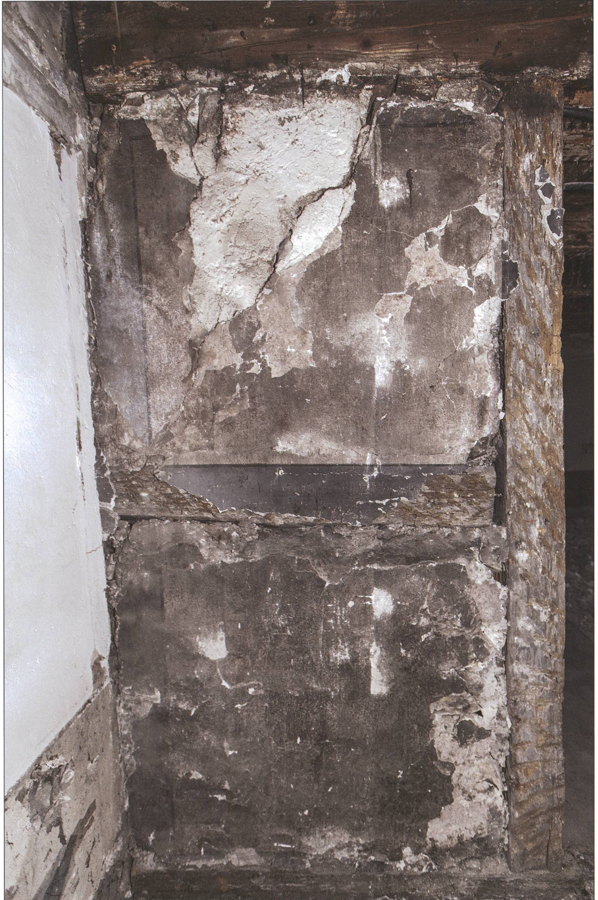
Graue Bandfassung des 17. Jahrhunderts auf der Binnenwand im 1. Obergeschoss.