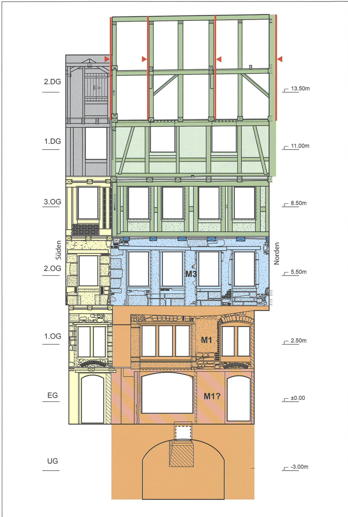
Bauphasenplan 3. Längsschnitt mit Innenansicht der gassenseitigen Südwestwand.