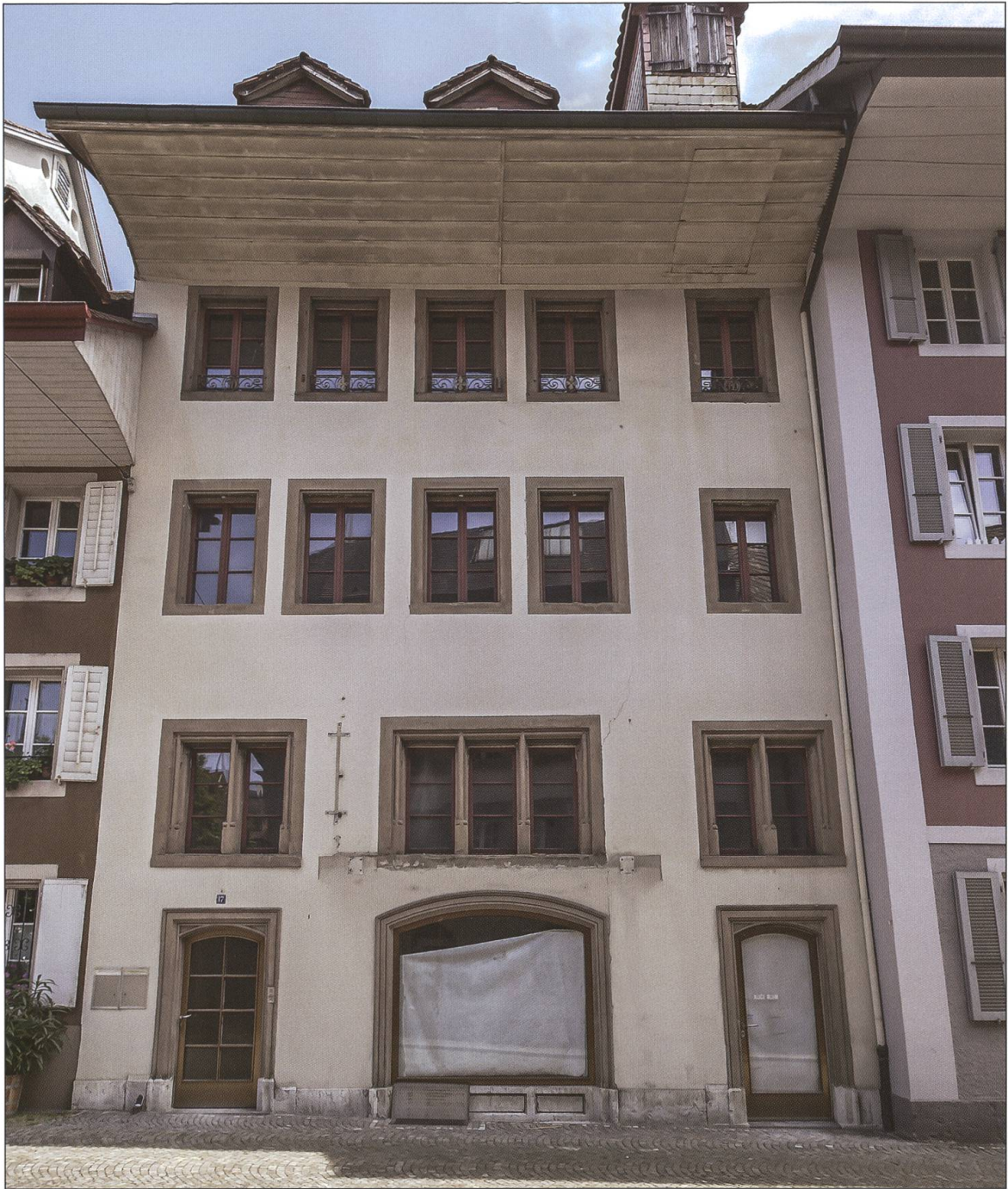
Rathausgasse 17, Ansicht von der Rathausgasse her (von Südwesten).

Vermutlich diente das Erdgeschoss als Keller und Werkstatt, während im 1. Obergeschoss Stube und Küche lagen. Im 2. Obergeschoss waren die Schlafkammern untergebracht. Der Zugang zum Haus erfolgte einerseits von der Rathausgasse her (E1), zum ande-