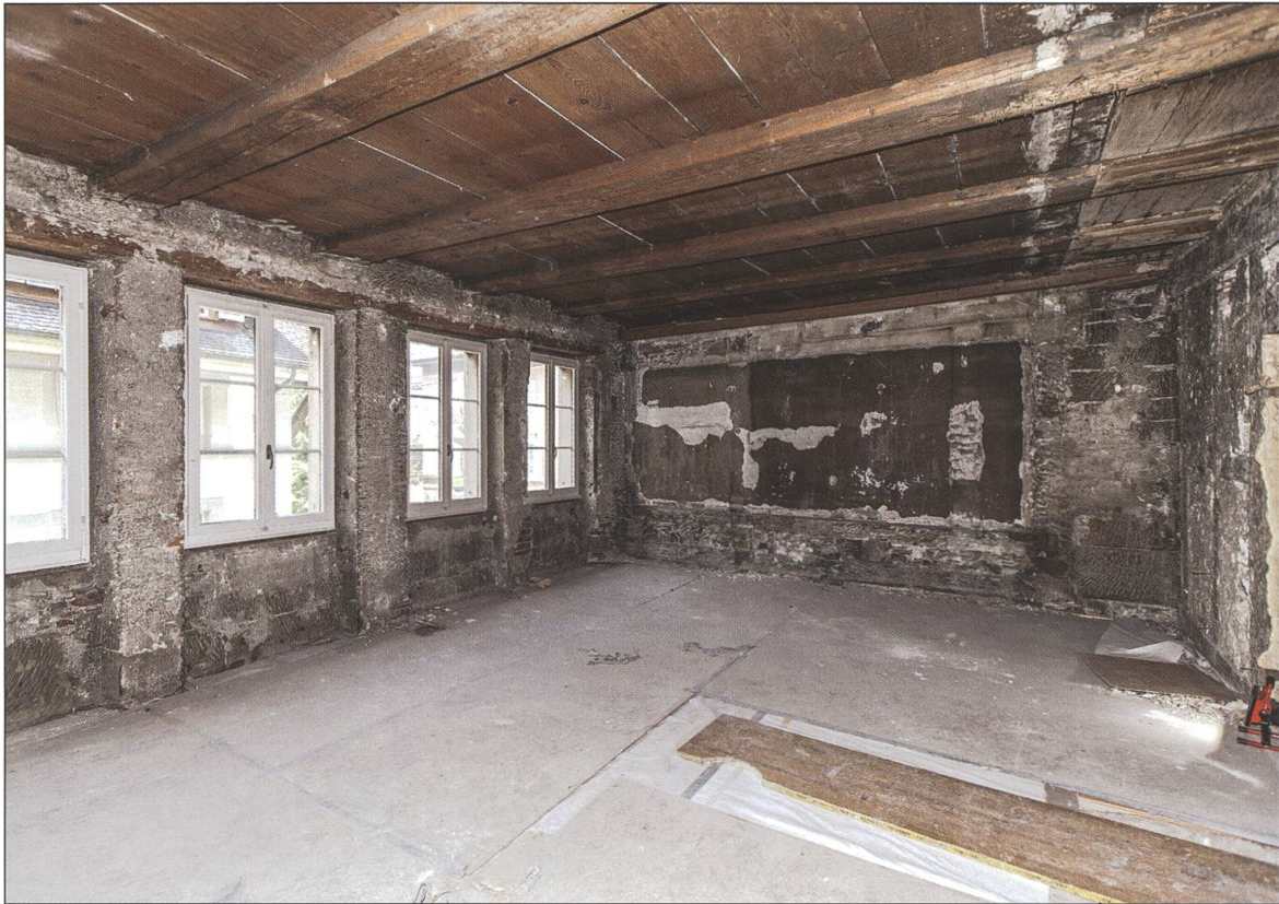
Übersicht über die zusammengelegten Kammern im 2. Obergeschoss. Ausbau von 1729. Blick von Südosten.

in Form grauer Bandfassungen auf der geriegelten Binnenwand im 1. Obergeschoss (stubenseitig) und auf der Binnenwand zum Nachbargebäude im 3. Obergeschoss.