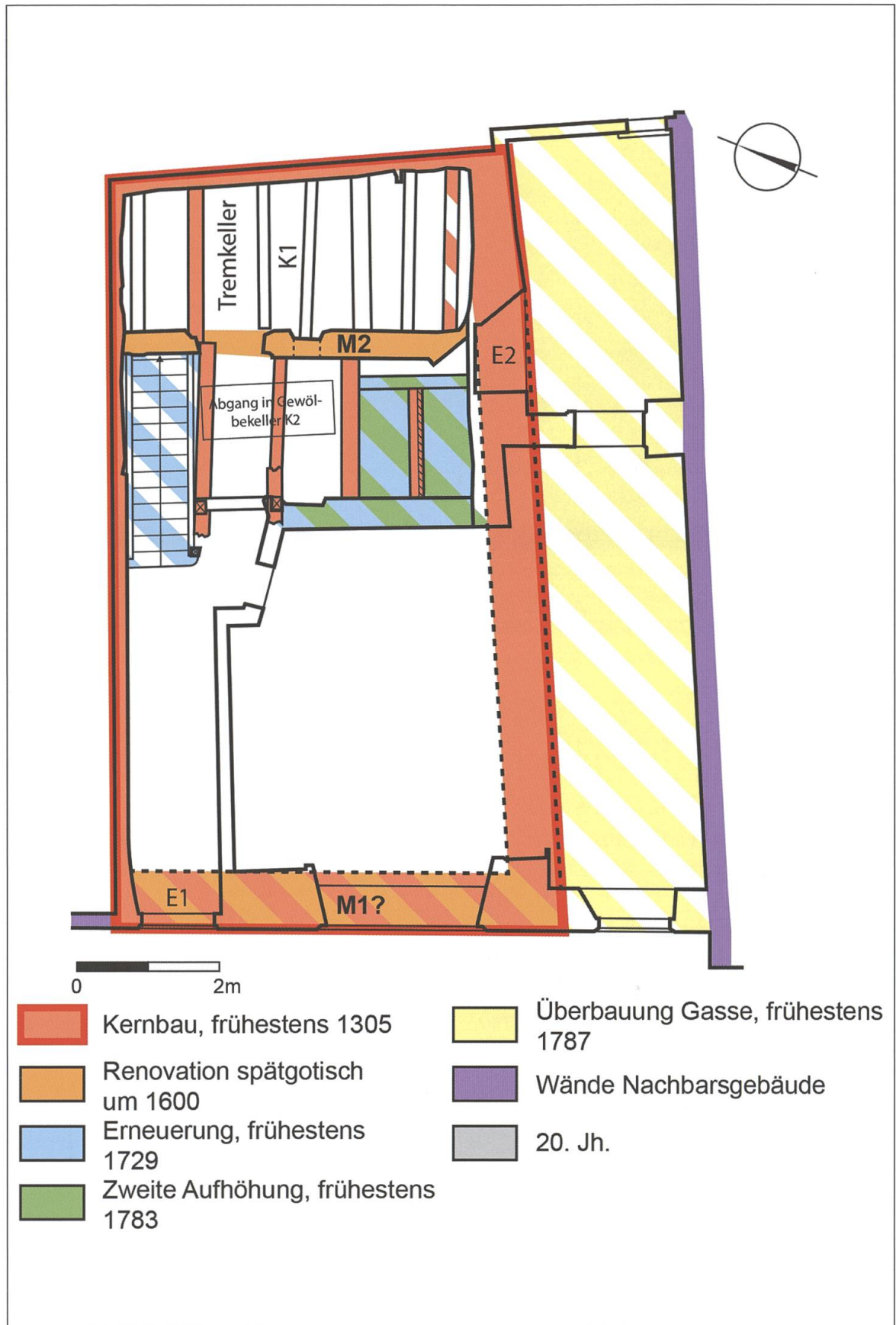
Bauphasenplan 1. Grundriss Erdgeschoss.