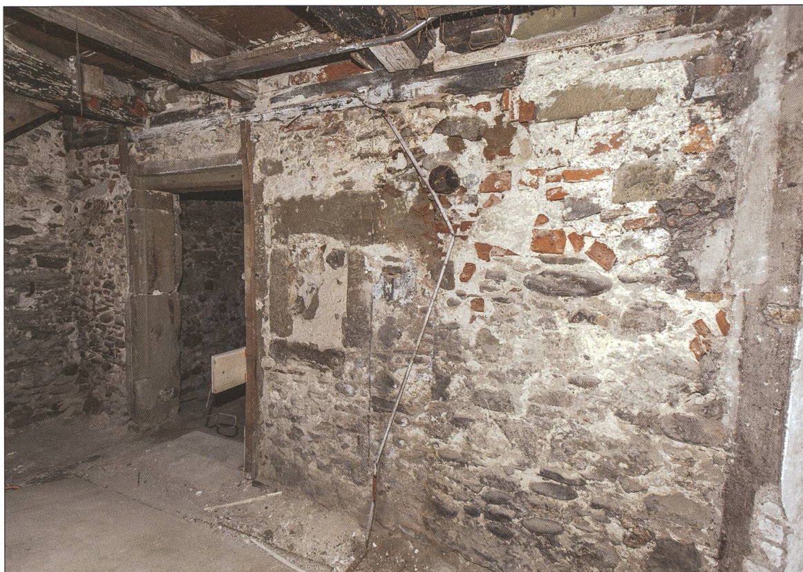
Steinmauer M2, die den Tränkeller vom Hauptraum abtrennt. Die Tür- und Fenstergewände bestehen aus Spolien.