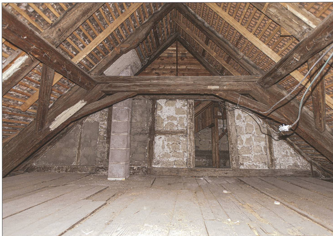
Die Dachstuhlkonstruktion von 1782/83 im 2. Dachgeschoss, Blick nach Süden. Hinter der Riegelwand ist der Dachstuhl über der überbauten Gasse zu sehen.

Wie bei Baumassnahmen jener Zeit üblich, wurde durch die neu errichtete, sandsteinerne Aussenwand das Fassadenbild vereinheitlicht. Die Fenster sind sehr gross und lassen dadurch viel Licht ins Innere. Die Deckenbalken sind auf Sicht gefasst und an den Wänden finden sich Spuren eines Knetäfers.