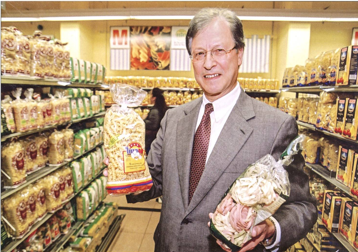
Erster Medienauftritt 2001 als Migros-Chef im MM am Limmatplatz, Zürich.