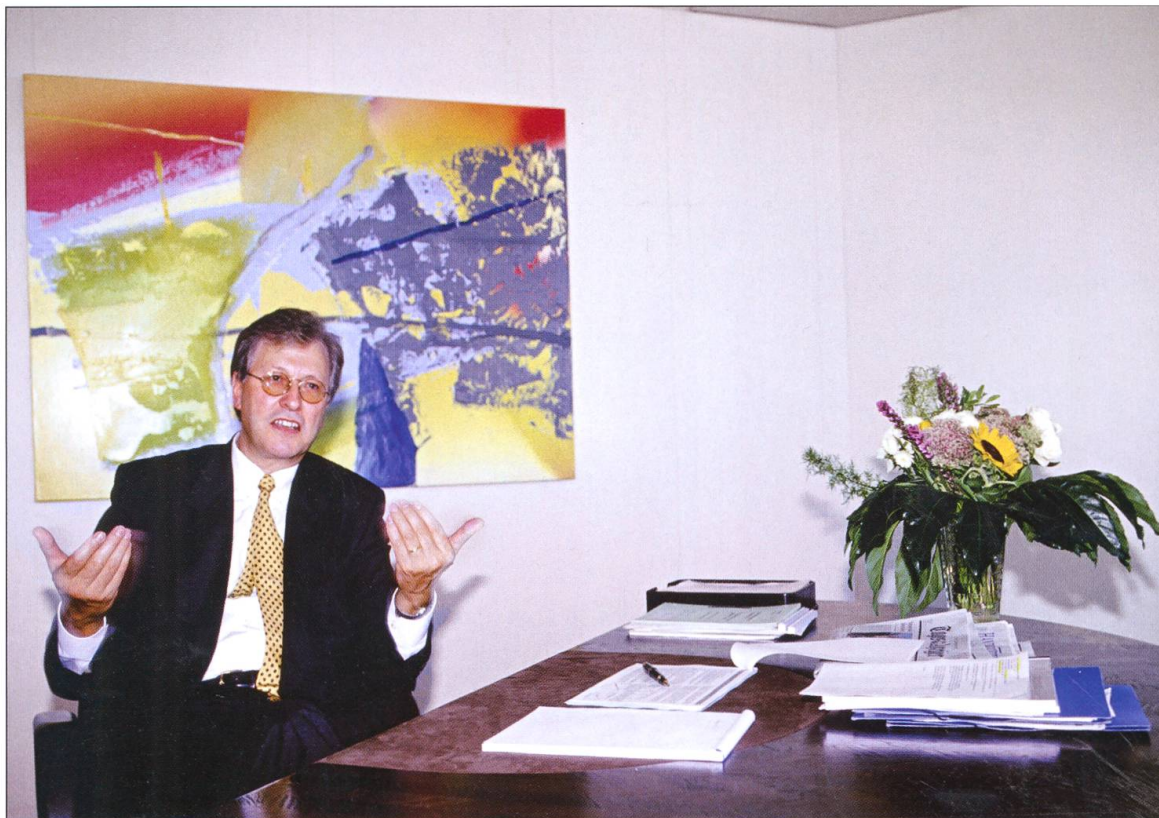
Interview als CEO des Migros-Genossenschafts-Bundes am Hauptsitz.