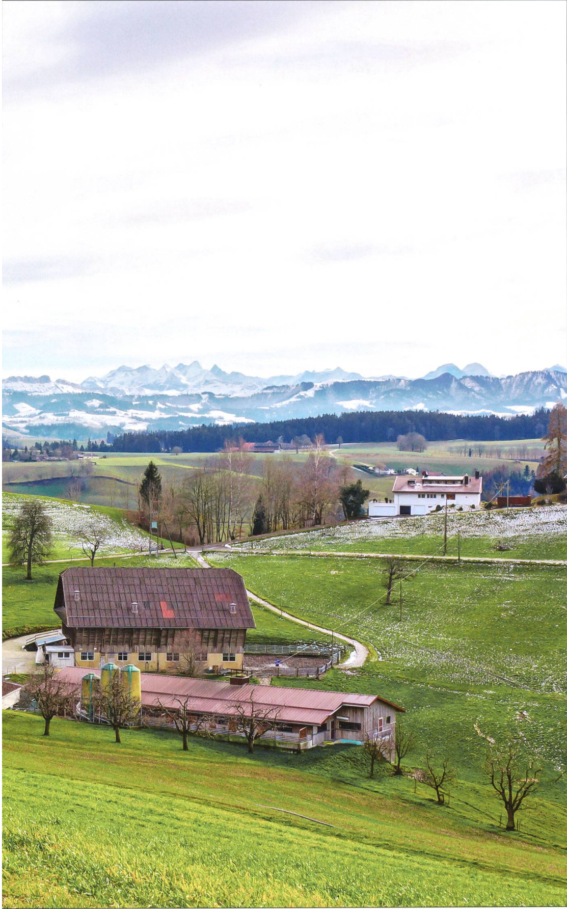
Der Bründlenhof Zell mit Blick in die Berner Alpen. Links das Geburtsbaus von Anton Scherrer.