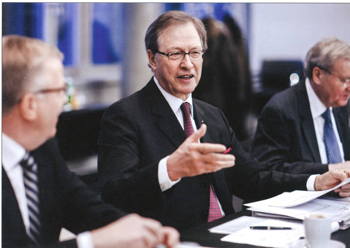
Präsident von Swisscom, Situation aus einer Verwaltungsrats-Sitzung 2009.