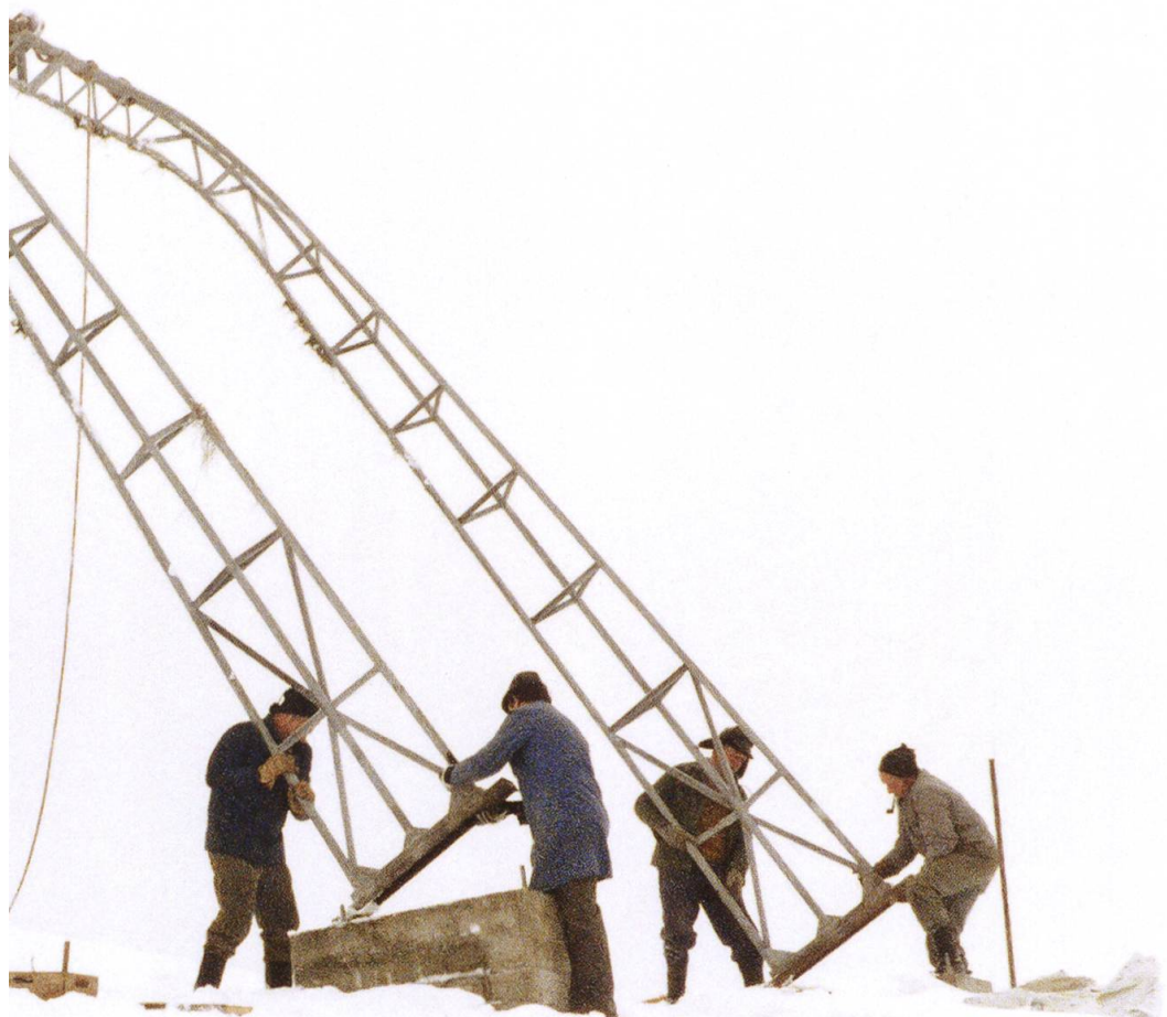
Aufrichten der Gittermasten.