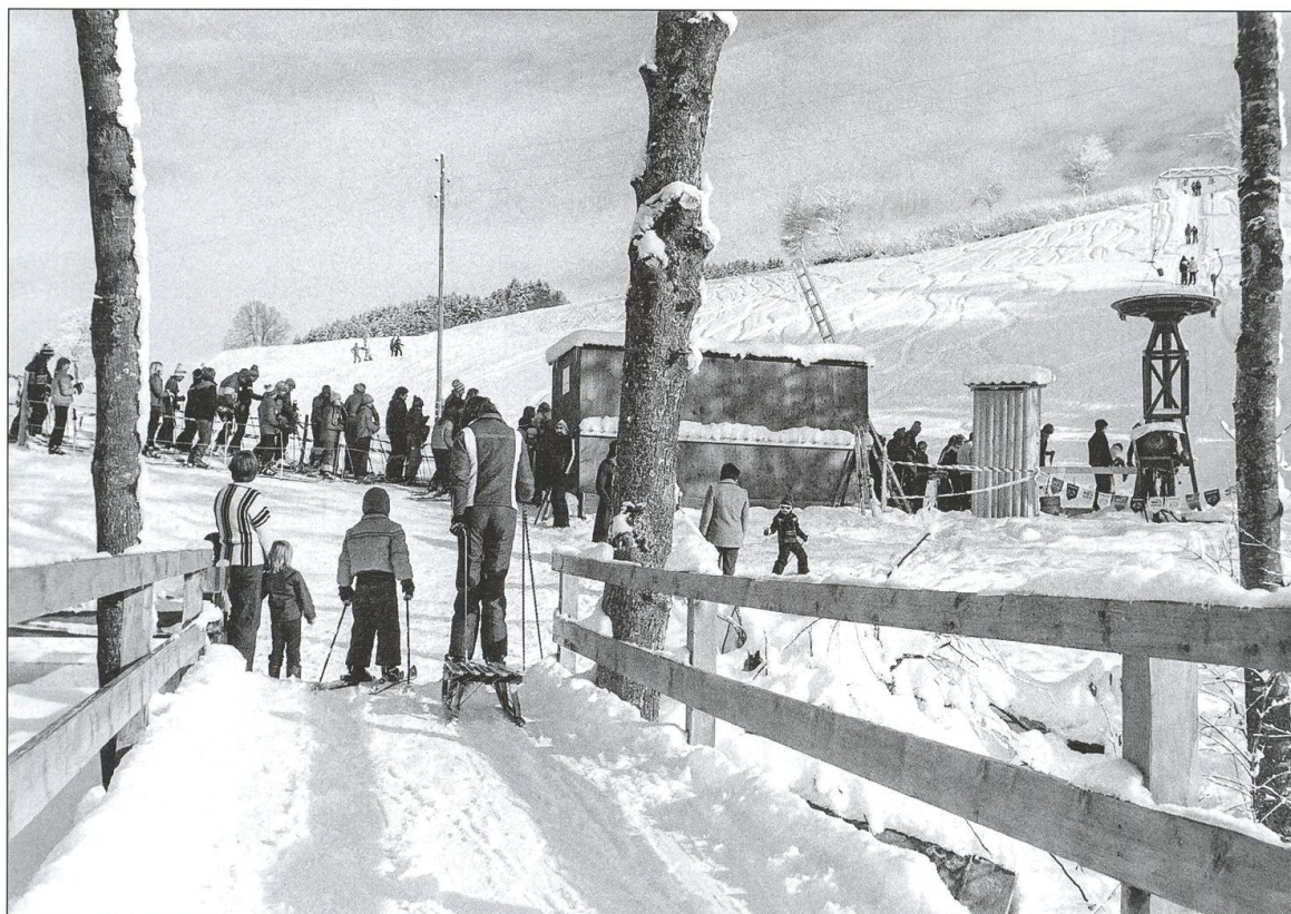
Anstehen vor dem neuen Skilift im Hübeli.

vor, scheiterte aber damit. Für die initiative Bauernfamilie Roos war das ein harter Schlag. Aber die Erschließung der Bauernhöfe war wichtiger und hatte natürlich Priorität.