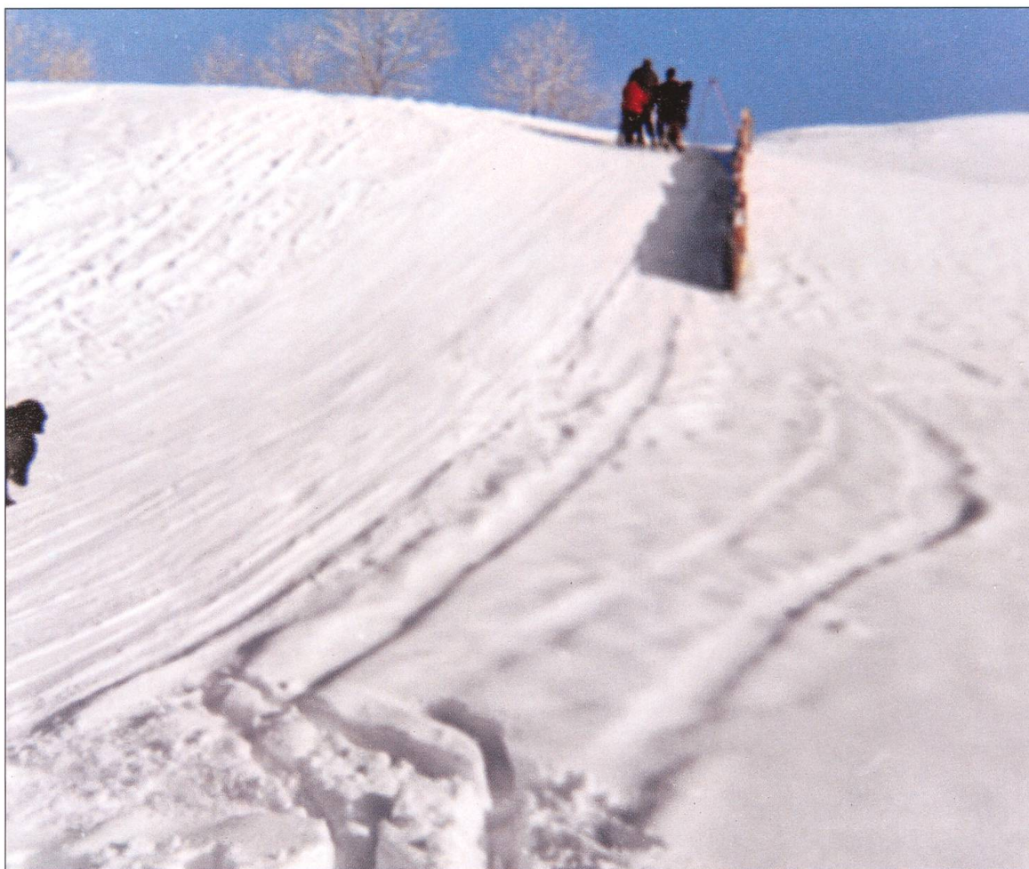
Skifahrer bei der Bergfahrt beim alten «Anti-Schilift».