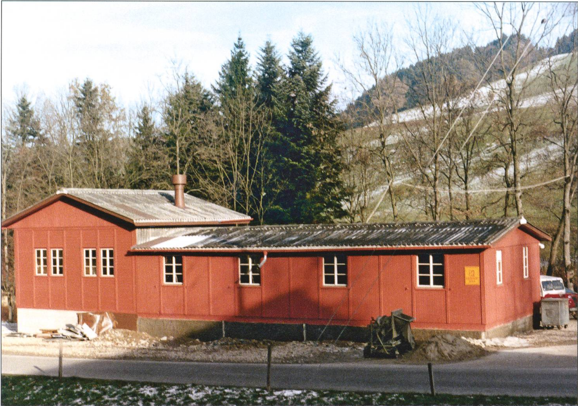
Skilift-Beizli im Hübeli. Während der Saison ist das Beizli regelmässig geöffnet. Es kann aber auch unter dem Jahr gemietet werden und ist ein beliebter Treffpunkt.