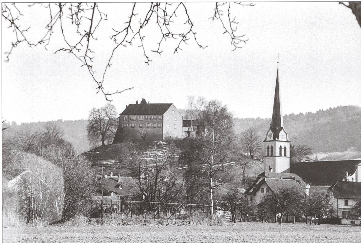
Blick von Nordwesten auf die Reider Pfarrkirche und die Johanniterkommende vor der Restaurierung.