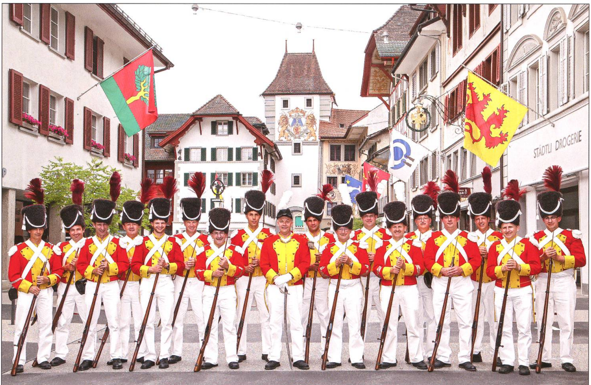
Gruppenfoto im Städtchen.