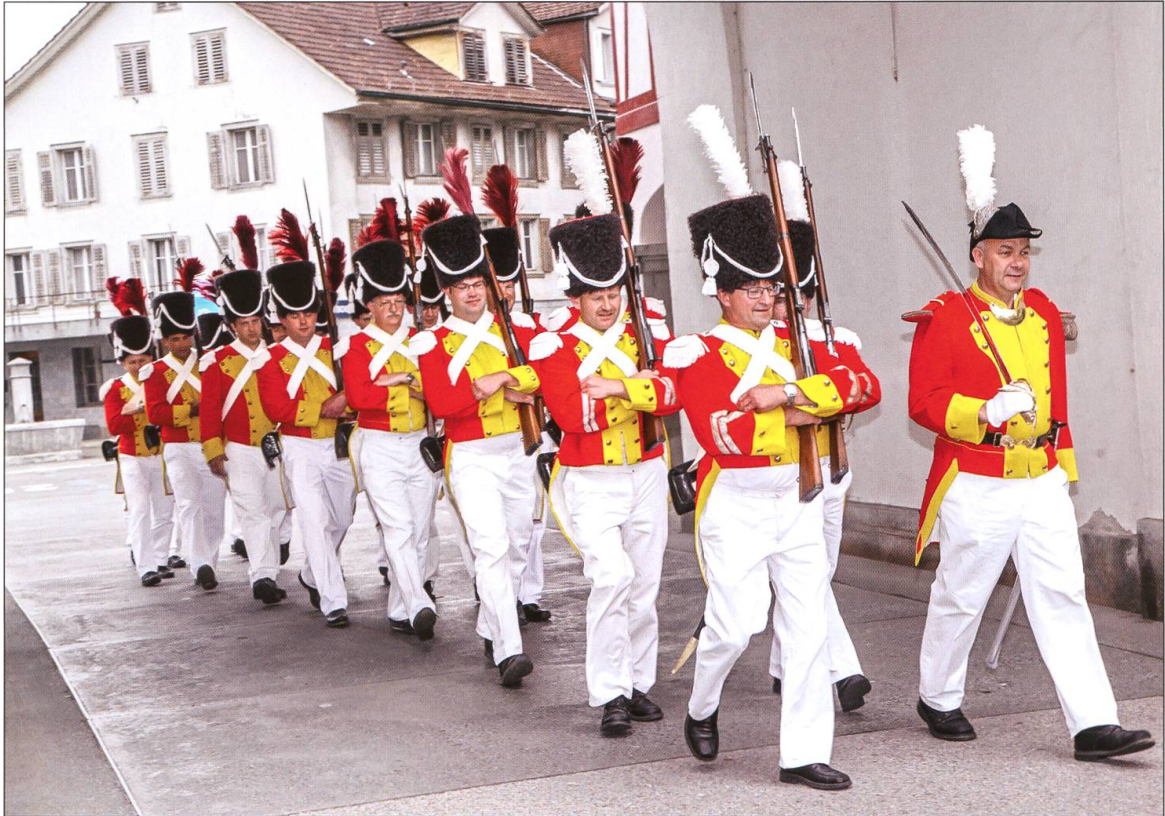
Einmarsch ins Städtchen nach der Prozession.