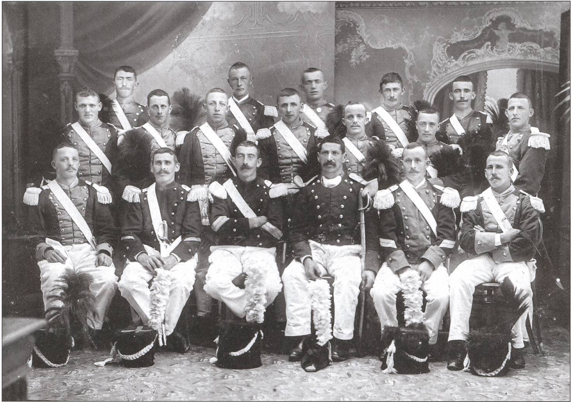
Die Willisauer Herrgottsgrenadiere 1911.