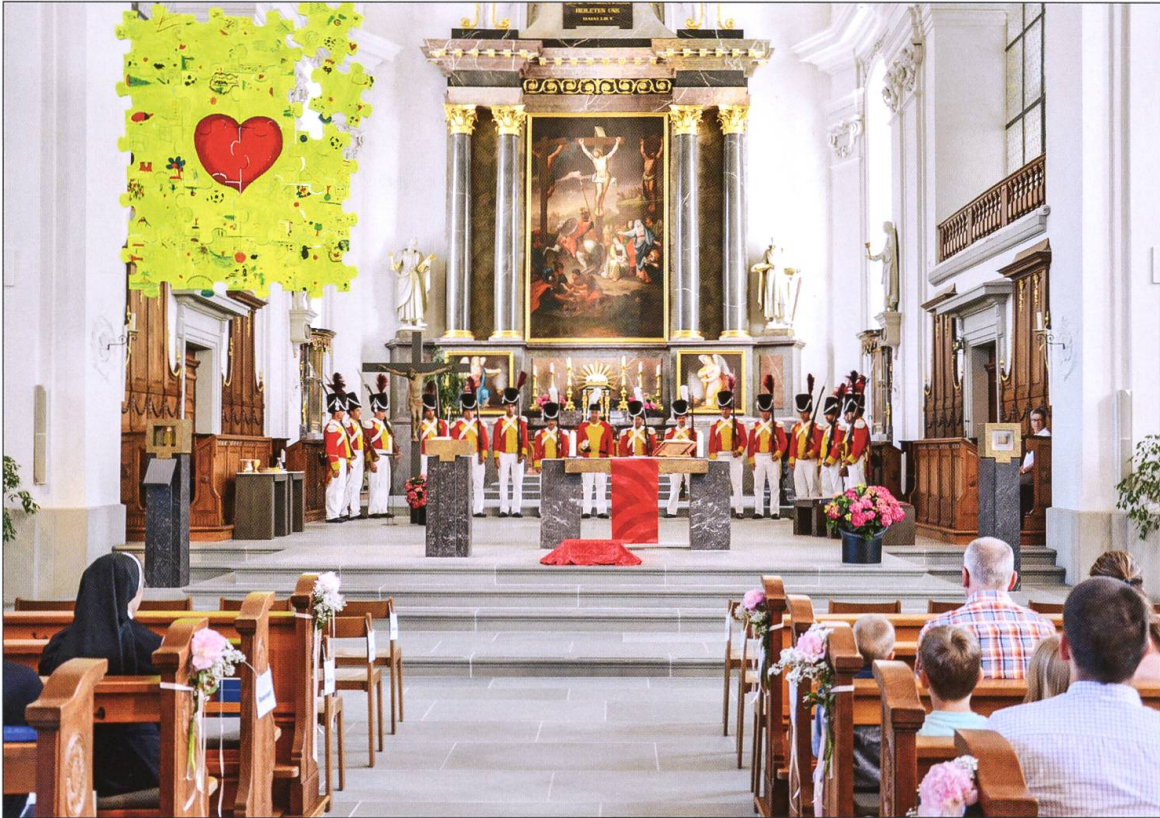
Begleitung der Messe im Chor der Pfarrkirche am Heilig-Blut-Ablassfest vom 18. Juni 2017.