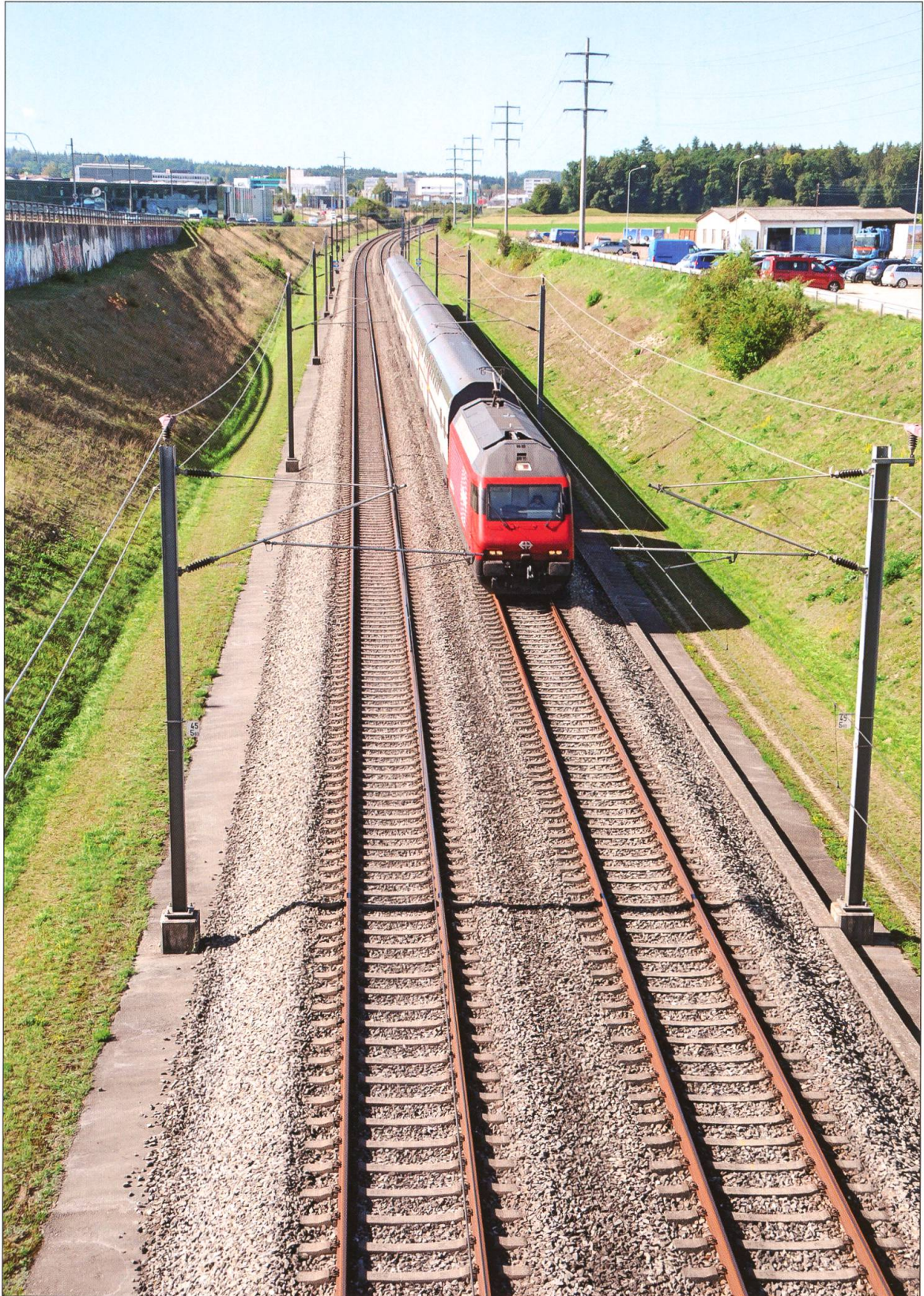
Mit der Schnellfahrstrecke Mattstetten–Rothenburg ist der erste Teil der Schnellbahnstrecke Bern–Zürich realisiert worden. Inter-City-Zug bei Langenthal Richtung Olten.