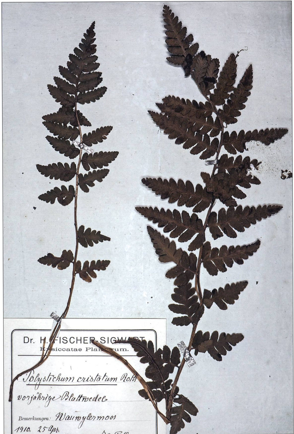
Kamm-Wurmfarn aus dem Herbarium von Fischer, Museum Zofingen.