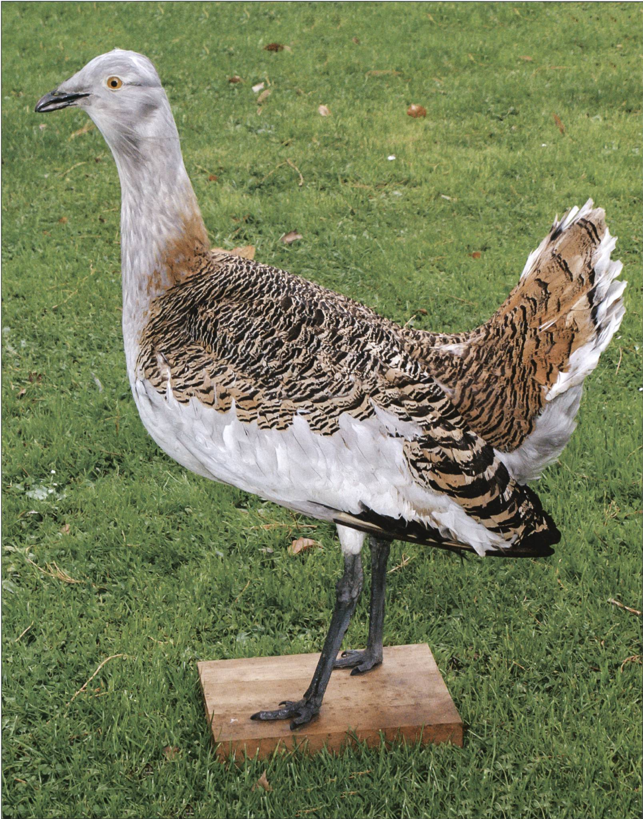
Grosstrappe, Schötzermoos 1855, Museum Zofingen.