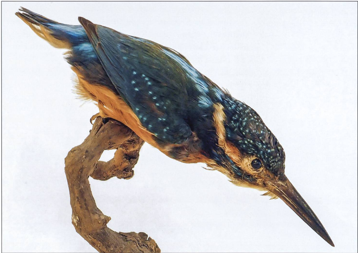
Eisvogel, Wauwiler Ebene 1899, Museum Zofingen.

folgt. «1899 ist die Elster im Wiggertal vollständig verschwunden. Man will sie auch in anderen Tälern vertilgen.» 1 1918 wurden für Eichelhäher-, Elstern- und Krähenabschüsse 70 Rappen bezahlt, während der Uhu im ganzen Kanton ausgerottet war und Prämien gestrichen wurden. 1915 ordnete der Luzerner Regierungsrat den vermehrten Abschuss von Sperber, Habicht und Wanderfalken an.