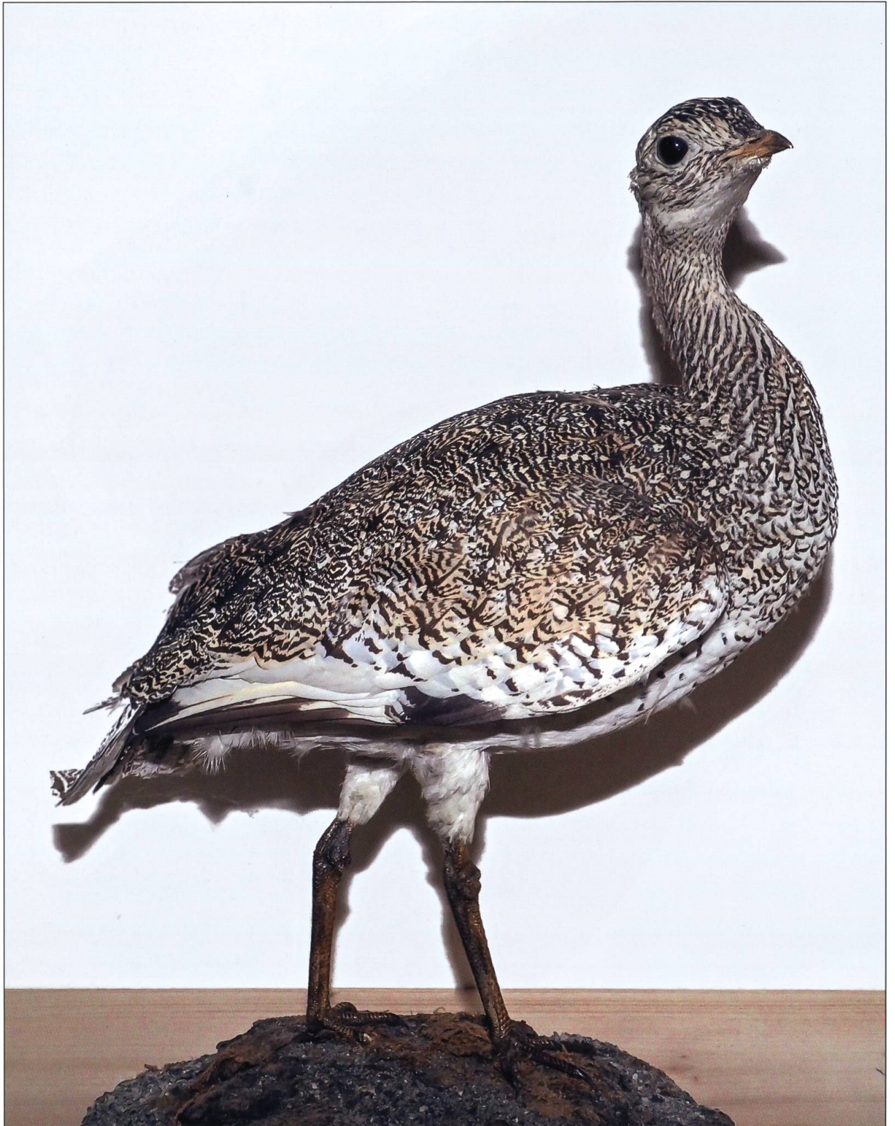
Zwergtrappe, Nottwil 1891, Museum Zofingen.