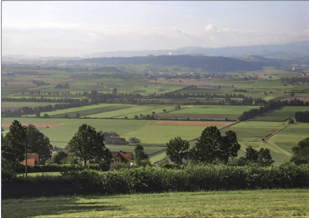
Die Wauwiler Ebene ist auch heute noch eine Insel für viele Tiere, die sich dort ausruhen und stärken können.