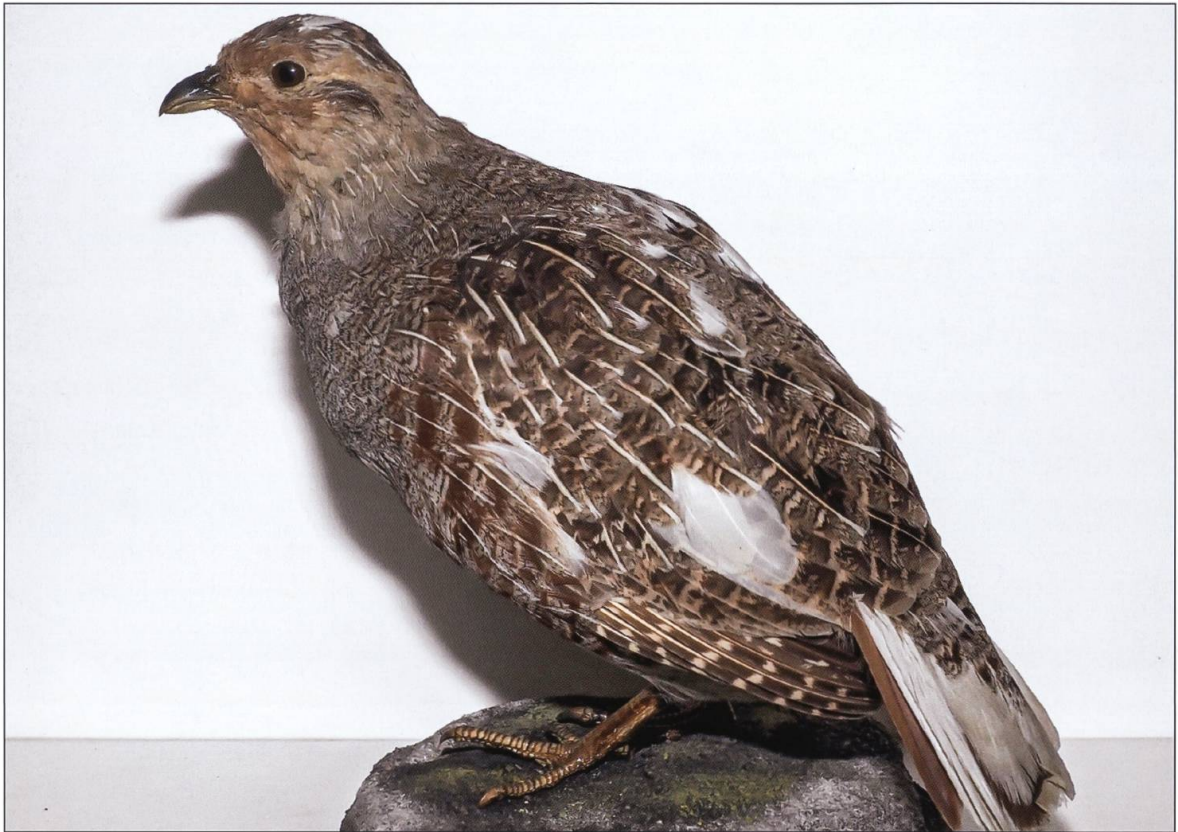
Rebhuhn, Wauwiler Ebene 1899, Museum Zofingen.