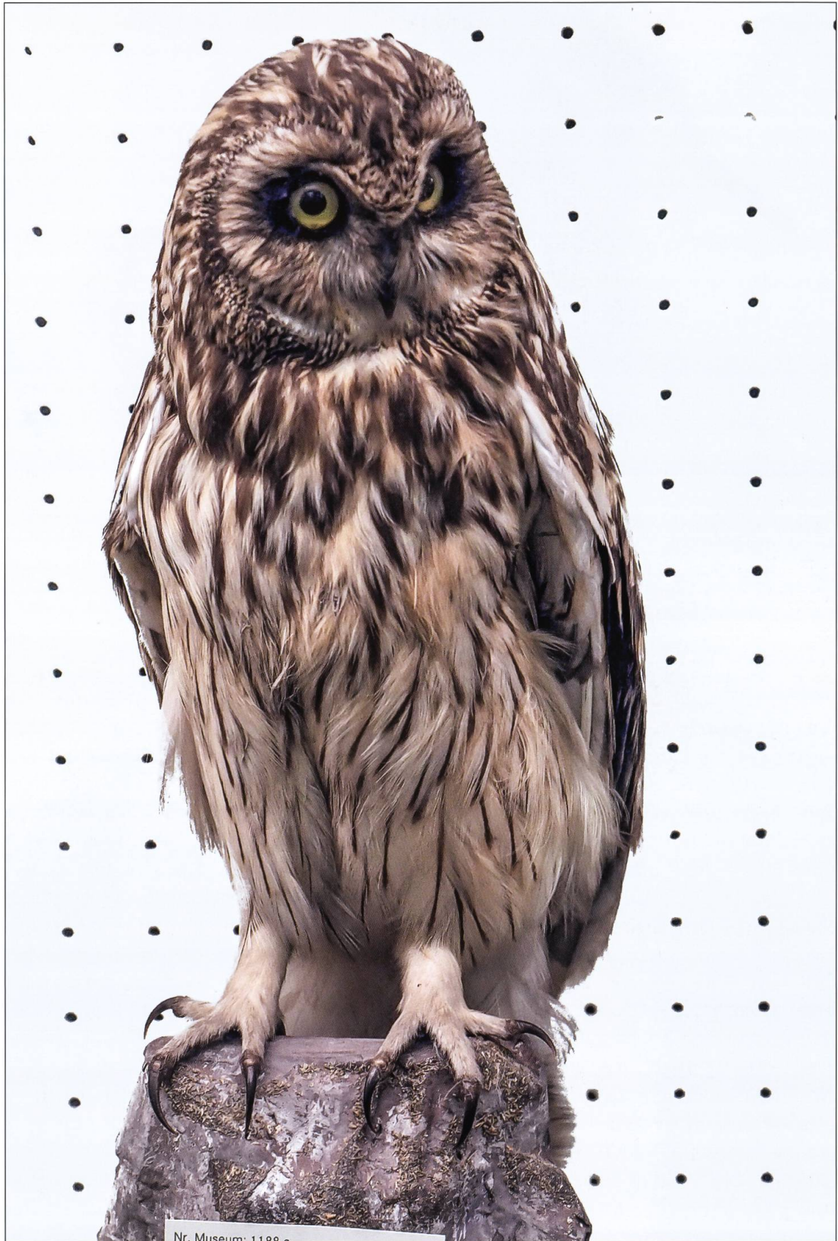
Sumpfohreule, Wauwiler Ebene 1881, Museum Zofingen.