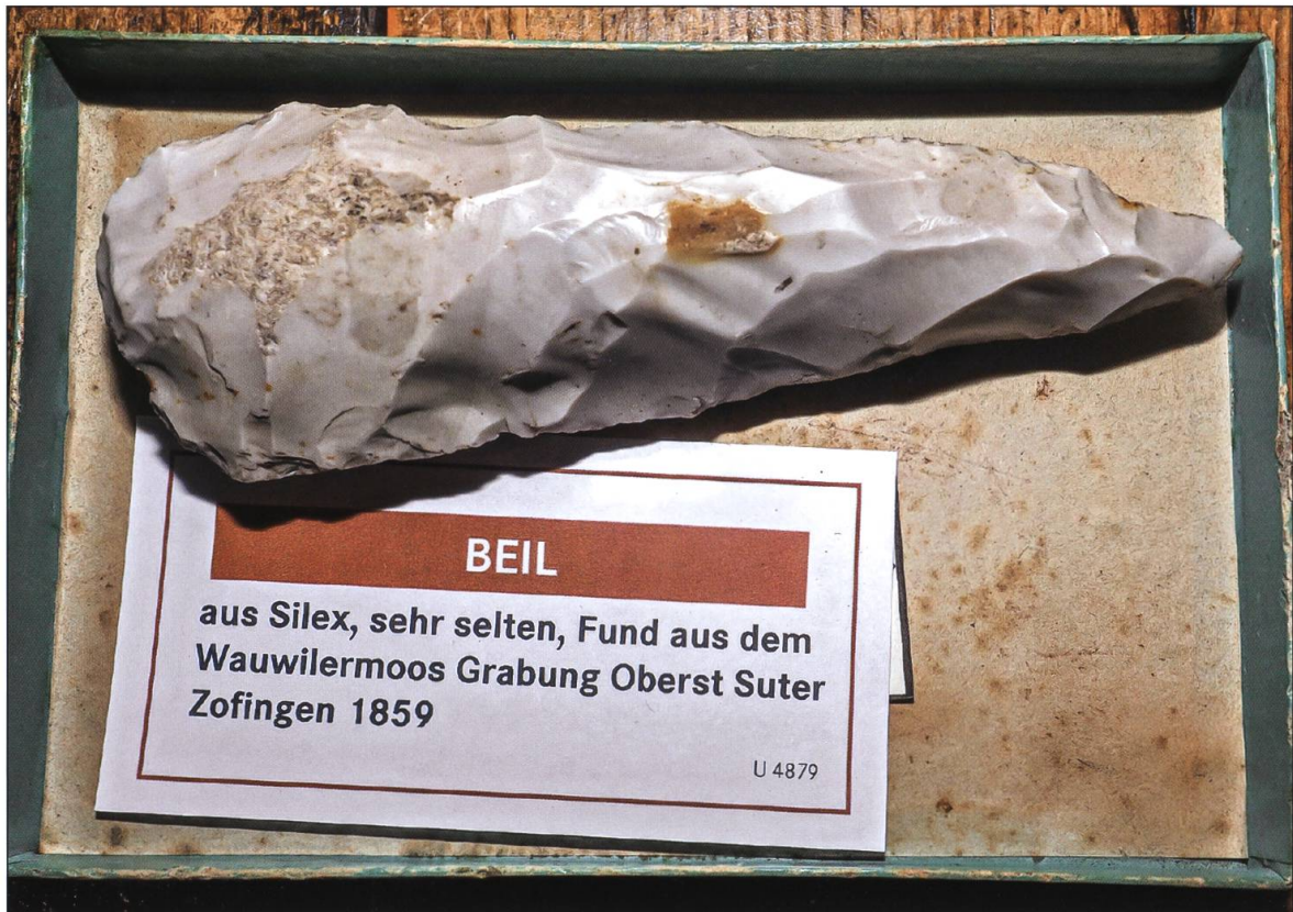
Silexbeil aus der Grabung Suter 1859, Museum Zofingen.

die Freundschaft mit Fischer ins Zofinger Museum. In 26 Schubladen finden sich Werkzeuge, Waffen, Tontöpfe und auch tierische und menschliche Knochen. Nebst dem Rothirsch fanden sich auch Reste von Auerochsen, Elch, Reh, Wolf, Torfrind und Torfschwein. Von besonderer Bedeutung sind eine Stein- und eine Kupferaxt aus den Ausgrabungen von Egolzwil 3.