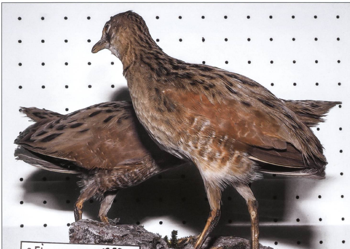
Junge Wachtelkönige, Wauwiler Ebene 1890, Museum Zofingen.

wieder Eier und Jungvögel. Heute sind alle diese Arten bis auf die Feldlerche verschwunden, Wachtel und Wachtelkönig brüten nur noch selten. Die Intensivlandwirtschaft mit grossflächigen Feldern, Pestizid- und Düngereinsatz, sowie fehlende Kleinstrukturen haben ihnen den Garaus gemacht.