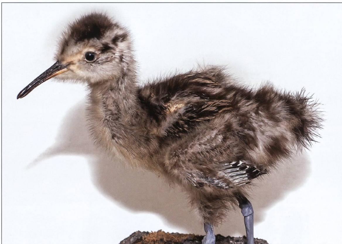
Grosser Brachvogel, Jungvogel, Wauwiler Ebene 1916, Museum Zofingen.

See ein. Dieser brütet in Island und Grönland und galt damals als besondere Jagdtrophäe. «Ein Jäger verfolgte einen auf dem Sempachersee mit einem Kahn den ganzen Tag hindurch, verschoss all sein Pulver und Blei und bekam ihn doch nicht.» 1