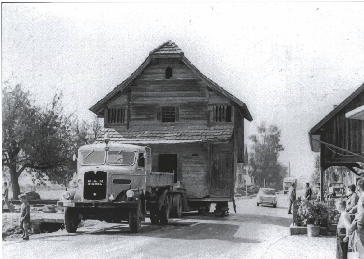
Der Transport des Spychers von Gettnau nach Oberwil (1963).