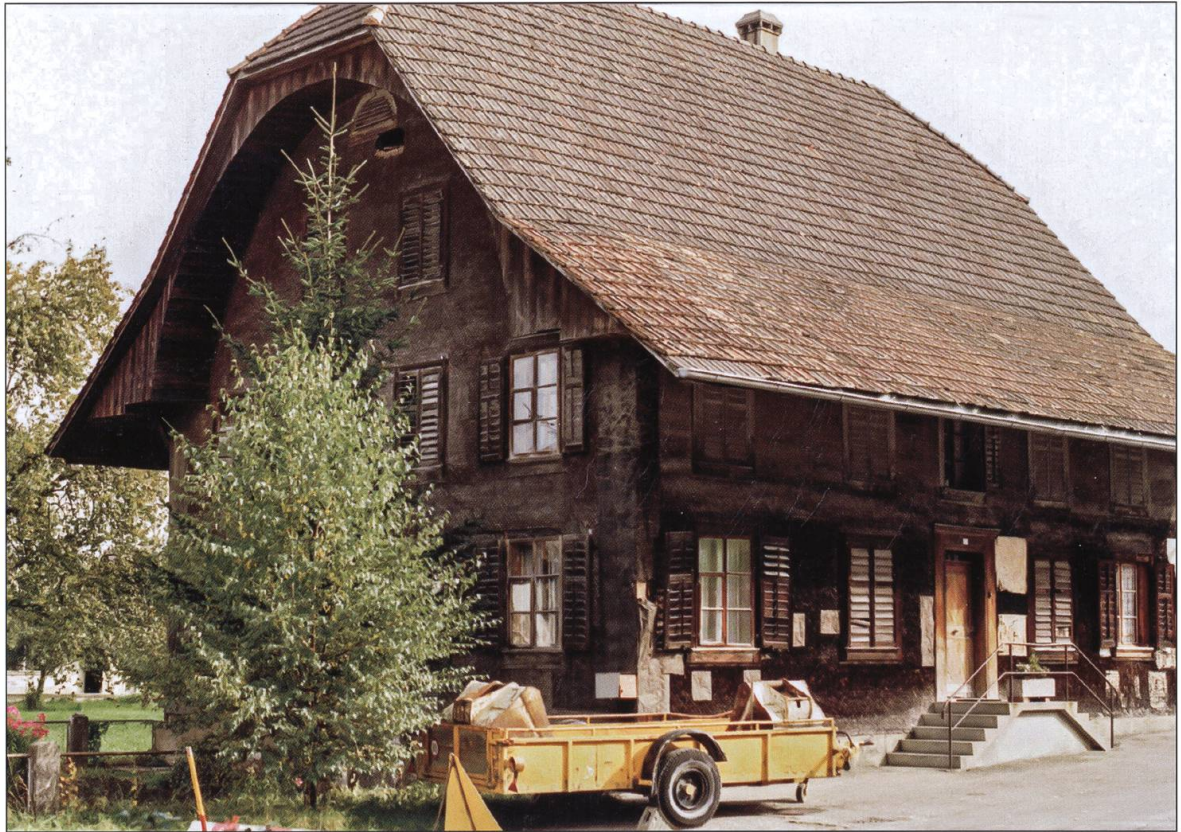
Ziegelhaus vor rund 40 Jahren.

Dielen Abdrücke im Originalboden entdecken, die laut Franz Stadelmann auf Schulbänke hinweisen könnten. Der grosse Raum diente zeitweise auch als Kanzlei und Versammlungsort. Als besonderes Prunkstück sticht das 300-jährige Buffet mit Tabernakel, das 1716 eingebaut wurde, ins Auge.