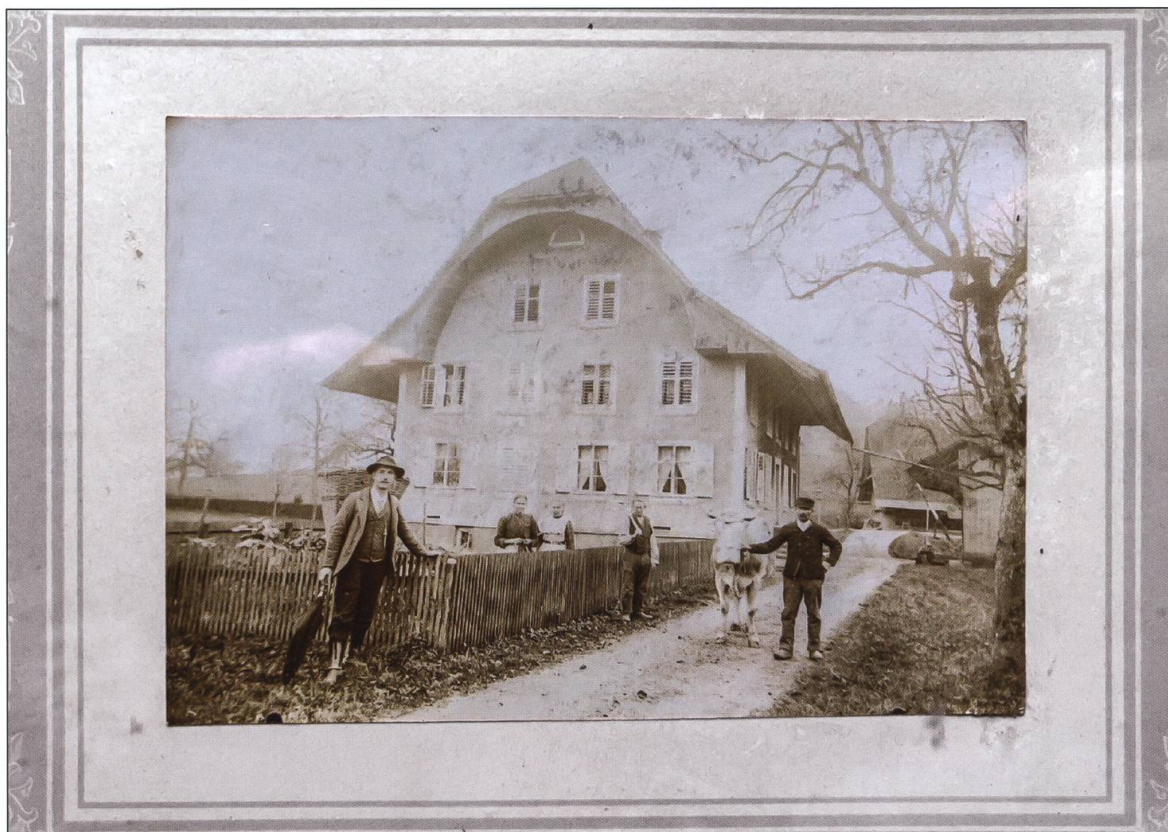
Historisches Foto mit Familie Wey um 1937.

gewachsen. Als schliesslich im Herbst 2011 die Kirchgemeinde beschloss, das Ziegelhaus zu verkaufen, meldete Franz Stadelmann sein Interesse und bekam den Zuschlag.