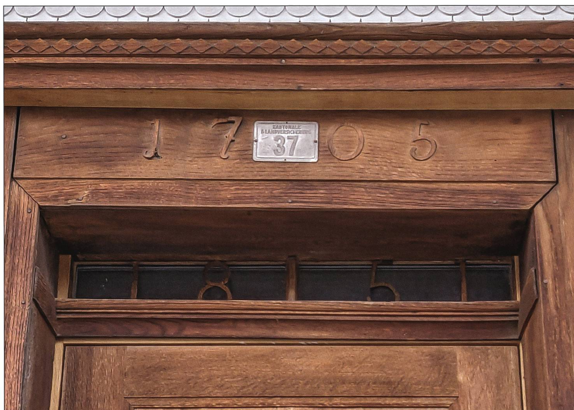
Jahreszahl über der Eingangstür.