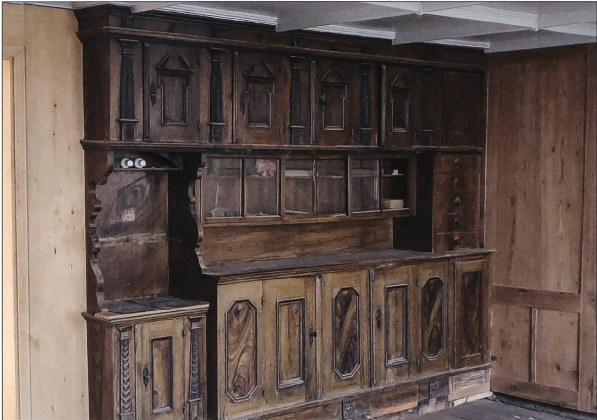
Buffet von 1716.

nissen, mit zwei Kachelöfen sehr gut beheizt. Das Ziegelhaus wurde 1705 erbaut und ist 1851 umgebaut worden. Der Zustand ist gut, es wurde im Lauf der Jahre wenig verändert.»