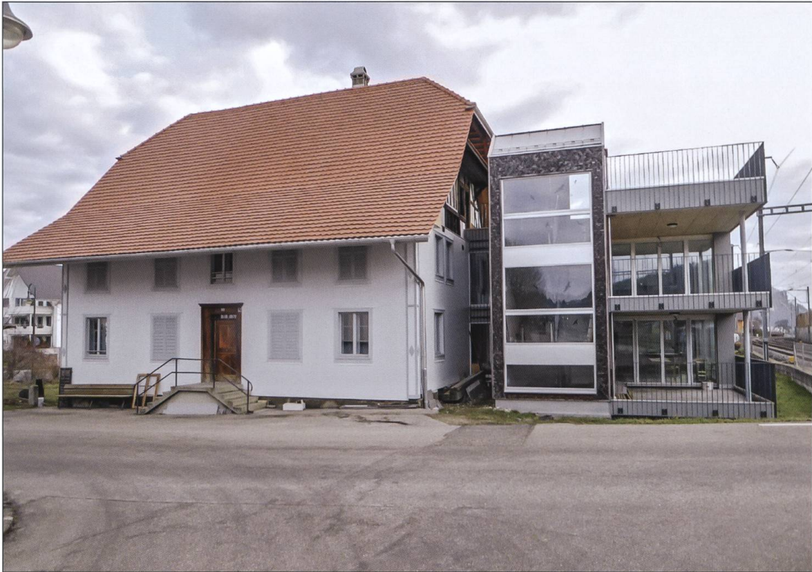
Der neue, moderne Anbau.