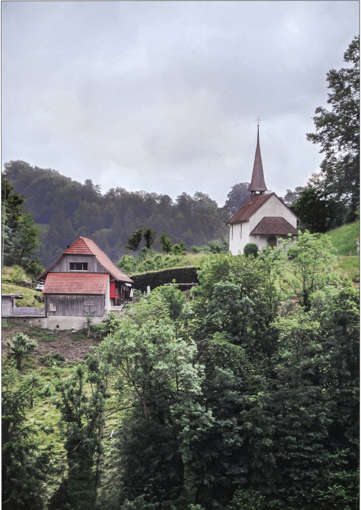
Die Kapelle St. Niklaus auf dem Berg war Teil einer ehemaligen Burg, die zusammen mit der Stadt Willisau am 8. Juli 1386 von den Habsburgern zerstört wurde. Dabei blieb die Kapelle verschont, vielleicht aus religiöser Ehrfurcht.