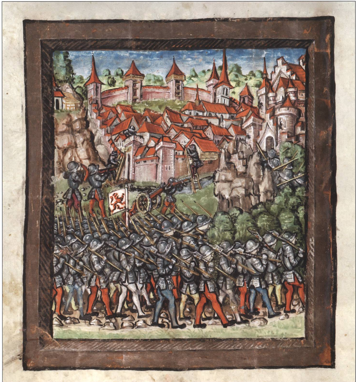
Willisau im Sempacherkrieg 1386. Eidgenössische Chronik des Luzerners Diebold Schilling 1513, S. 40.

garten, und eine gewaltsame Einnahme der Stadt fand nicht statt. Doch die Missverständnisse gehen noch weiter. Schilling schreibt in der Erklärung zu diesem Bild, wie die von Bremgarten gegen Willisau gezogen seien, «gewunend die statt und darzuo Hasenburg das schloss, brantend und wüstend sy beide und zugend wider heim. Diss be-