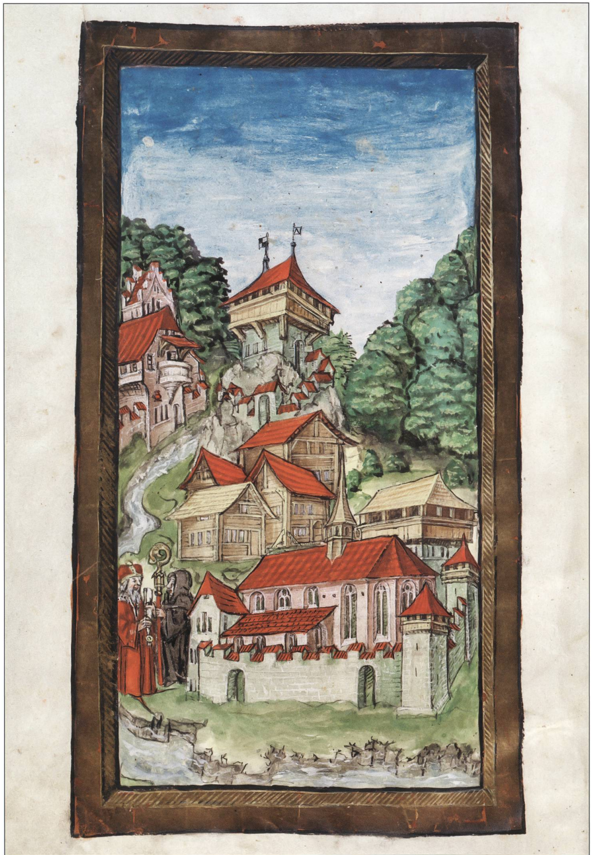
Ansicht der Stadt Luzern kurz nach der Gründung. Eidgenössische Chronik des Luzerners Diebold Schilling 1513, S. 18.