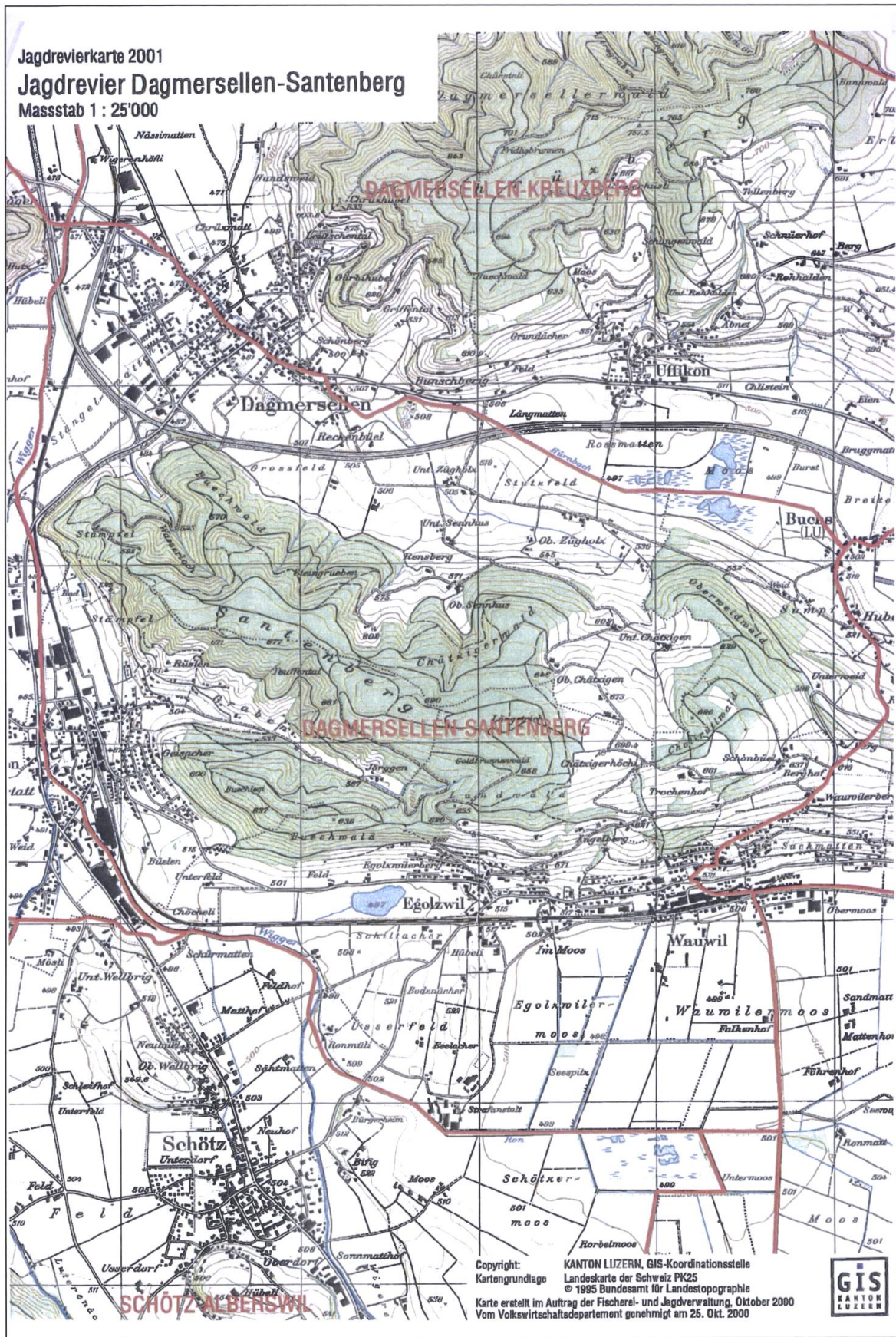
Revierkarte des Jagdreviers Santenberg, Dagmersellen.