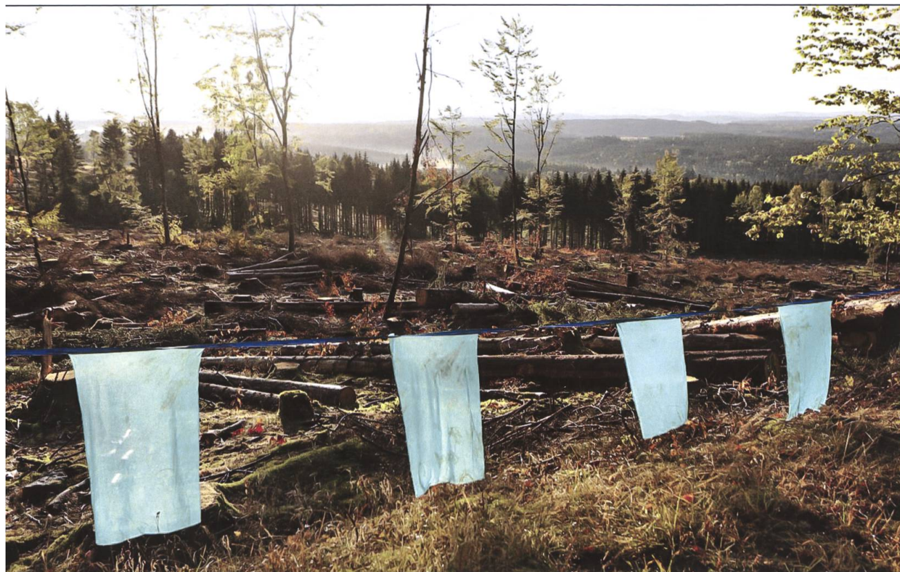
«Durch die Lappen gehen» (Weidmannssprache und Jägerlatein).