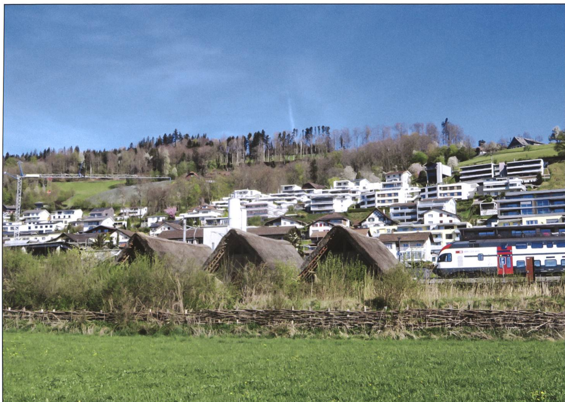
Blick von der Wauwiler Ebene zu den Wauwiler Wohn- und Pfahlbauten.

Wildverwerter, Jagdaufseher, Hundeführer und Schweisshundeführer.