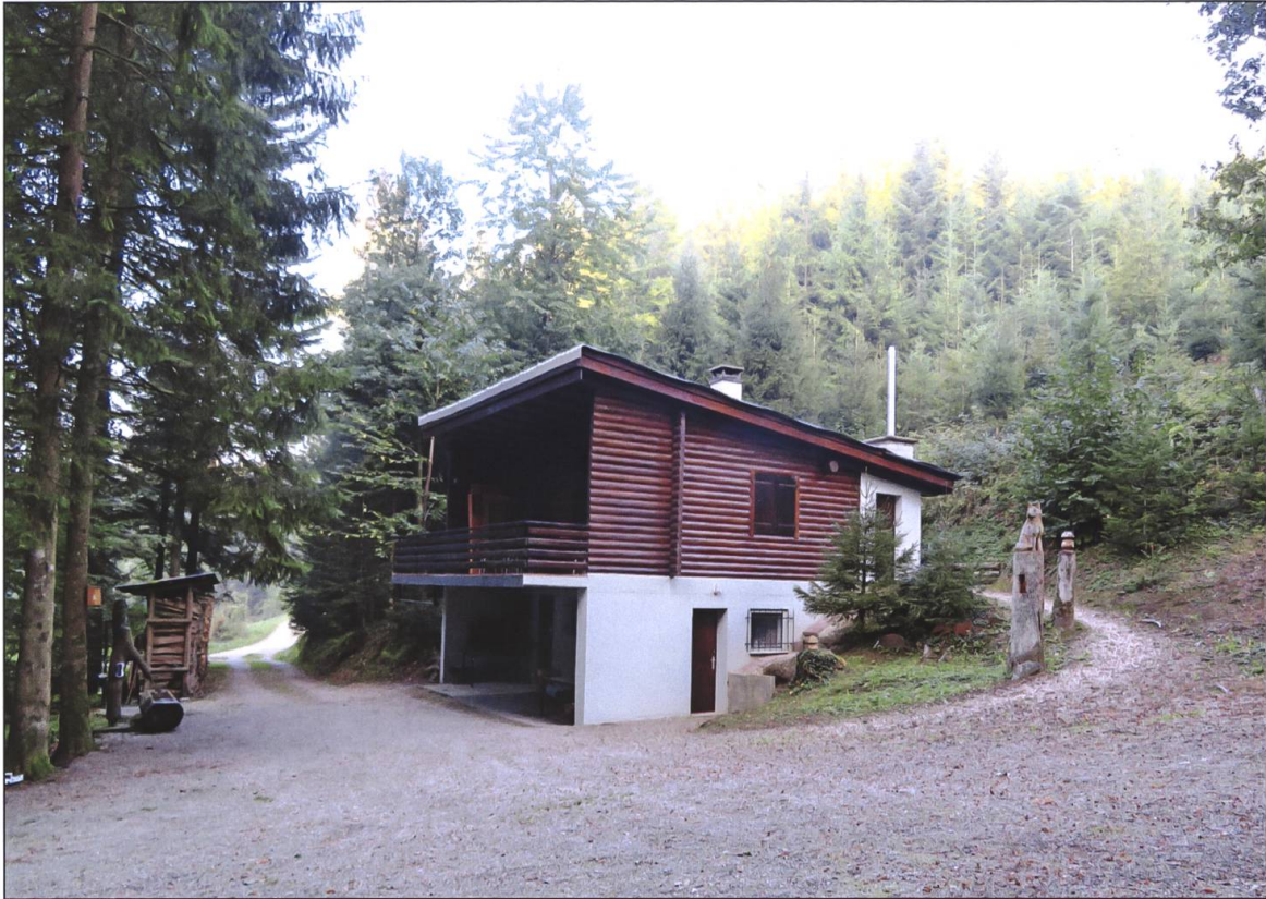
Die Jagdhütte Goldbrunnen der Jagdgesellschaft Santenberg.

Santenberg um halb neun bei der Jagdhütte. Eröffnet wird die Jagd durch die Jagdhornbläser. Nach der Begrüssung durch den Obmann gibt der Jagdleiter bekannt, was erlegt werden kann und welche Triebe am heutigen Jagdtag gemacht werden. Anschliessend nehmen die Jäger ihren festgelegten und nummerierten Stand ein (siehe Planausschnitt). Die Treiber warten zusammen mit den Jagdhunden, bis der Treiberchef zum Starten bläst; die Verständigung untereinander erfolgt durch Hornstösse und Hornsignale.