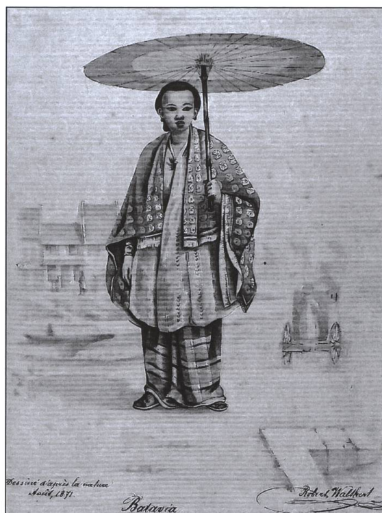
Robert Walthert, Frau mit Sonnenschirm in indonesischer Tracht, Federzeichnung, 1871.

Im Oktober erkrankt Walthert an der Ruhr, leidet unter ständigem Durchfall und magert so stark ab, dass ihn die Ärzte an Weihnachten ins Hospital von Baya Combo (heute Bajakumbuh) überweisen. Hier begegnet er der malaiischen Bevölkerung, die mehrheitlich muslimisch ist und für die er eine gewisse Bewunderung hegt: «Diese lichtbraunen Eingeborenen von sehr schönen Gesichtsfarbe und beneidenswerthem Gliederbau tragen alle 1 bis 1½ Fuss lange blankgeschliffene Messer im Gürtel und sehen so stolz und herrisch darein, dass einem oft eiskalt über den Rücken läuft, wenn man durch diese Menge hindurch muss». 14 Sie verachten die Europäer als ungläubi-