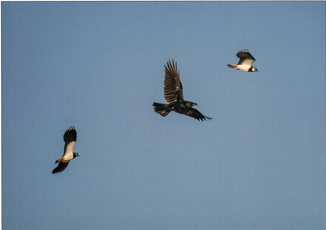
Kiebitzeln attackieren Feinde in der Luft, wenn diese ihren Gelegen oder Küken zu nahe kommen. Je mehr Paare auf einer Fläche brüten, desto besser funktioniert die Luftabwehr.

Wiesen und Weiden. In der Wauwiler Ebene kehren Ende Februar die ersten Kiebitze aus ihren Winterquartieren an der Atlantikküste und im Mittelmeerraum zurück. Die Kiebitzmännchen beziehen ab Anfang März ihre Reviere und verteidigen diese gegen Rivalen. Zur Verteidigung und auch um ein oder mehrere Weibchen anzulocken, führen die Männchen ihren auffälligen Balzflug vor, bei dem sie den namensgebenden Balzruf «ki-wuit» ausstossen. Die Weibchen kehren ab März ins Brutgebiet zurück und sind in den ersten Tagen vor allem damit beschäftigt, ihre Reserven zu füllen. Unter die teils grossen, futtersuchenden Trupps mischen sich zu dieser Jahreszeit auch Durchzügler, die sich auf dem Weg in nördlicher gelegene Brutgebiete befinden. Nach