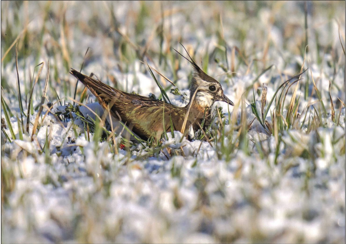
Kiebitze brüten am Boden und relativ früh im Jahr. Es ist nicht aussergewöhnlich, dass während der Brutzeit noch Schnee fällt. Die Weibchen sind aber beharrlich und trotzen den widrigen Umständen.

tion nicht selbsterhaltend. Mitarbeiter der Vogelwarte markierten daher als erste Massnahme die Nester, damit die Landwirte sie bei der Bewirtschaftung erkennen und verschonen können. Zudem umzäunte man die Brutflächen mit Schafzäunen, um den Rotfuchs abzuhalten. Diese Massnahmen zeigten schnell Wirkung.