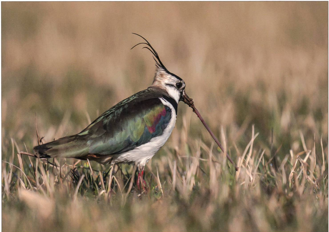
Kiebitze suchen im feuchten Oberboden nach Nahrung. Besonders beliebt sind Regenwürmer.

in der Schweiz zu stabilisieren. Die in der Wauwiler Ebene gewonnenen Erkenntnisse und getesteten Förder- und Schutzmassnahmen kommen an anderen Kiebitz-Brutplätzen in der Schweiz und Europa zur Anwendung. Heute brüten rund 200 Kiebitz-Paare in der Schweiz. Der Bestand hat sich dank der Schutz- und Fördermassnahmen folglich innert knapp 20 Jahren wieder mehr als verdoppelt. Einige traditionelle Brutplätze wurden wiederbesiedelt – ein grosser Erfolg für den Erhalt des gefiederten Juwels! Trotzdem gilt der Kiebitz nach wie vor als stark gefährdet, und von den ehemals 900 Brutpaaren sind wir noch weit entfernt. Das Projekt geht also weiter und wird sich auch in Zukunft mit der Weiterentwicklung geeigneter Schutz- und Fördermassnahmen auseinander-