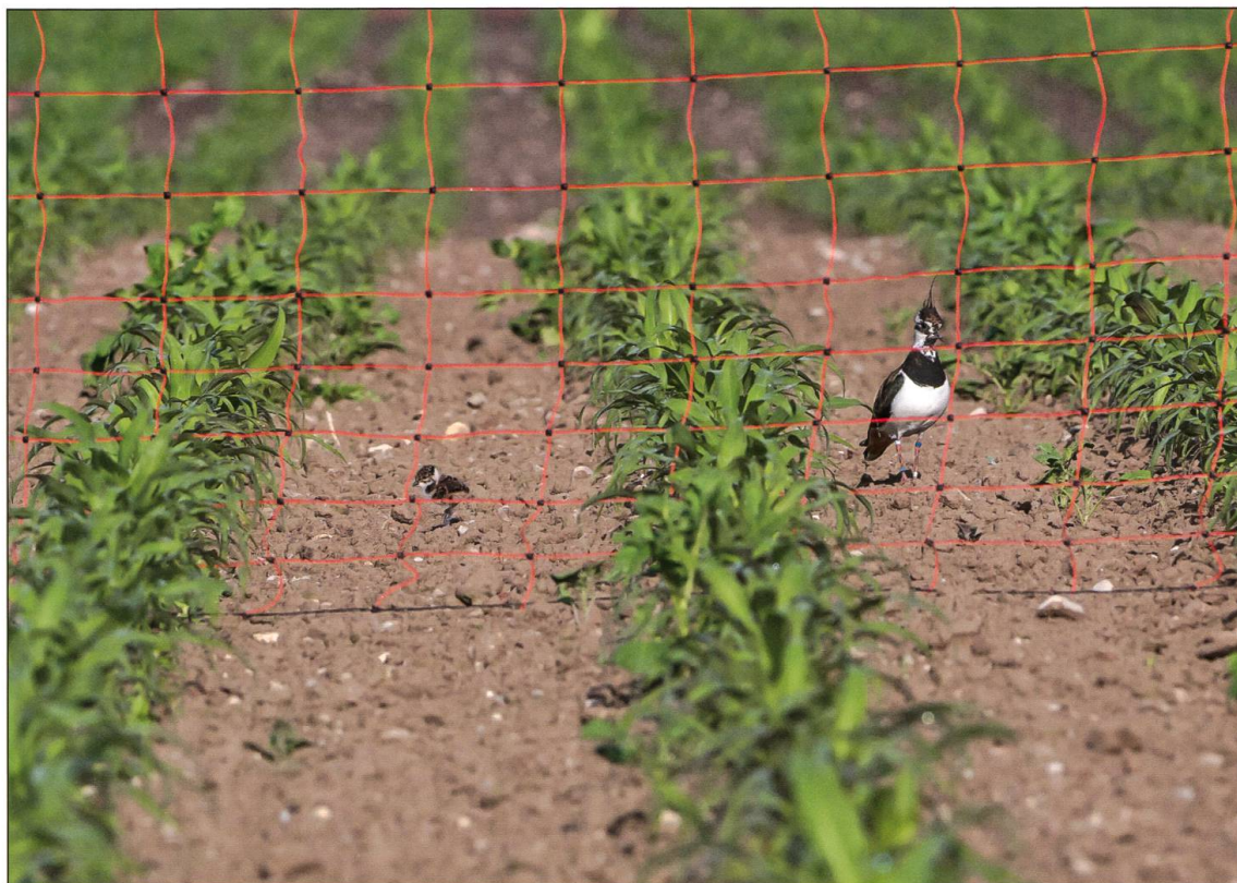
Zäune halten Bodenprädatoren wie den Rotfuchs davon ab, die Gelege zu plündern und Küken zu erbeuten. Innerhalb der Zäune ist die Schlupfrate deutlich erhöht.

30 Tagen Brutdauer alle vier Küken gleichzeitig schlüpfen. Die Küken zeigen typische Eigenschaften von Nestflüchtern: Sie tragen bereits ein bräunliches Daunenkleid, das sie vor der Witterung schützt und gut tarnt. Weiter haben sie robuste Beine sowie im Gegensatz zu Nesthockern bereits gut entwickelte Augen. Bereits am ersten Lebenstag verlassen die Küken das Nest und suchen selbständig nach Nahrung, vorzugsweise an feuchten Stellen. Die Eltern kümmern sich aber trotzdem um sie, indem sie den Nachwuchs in gute Nahrungsgebiete führen, von Zeit zu Zeit hudern und vor nahenden Feinden warnen und diese attackieren. Im Alter von rund 35 Tagen sind die Küken flugfähig. Ein Teil der Alt- und Jungvögel ver-