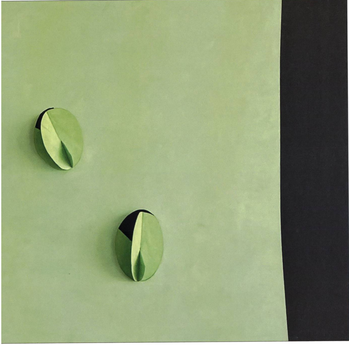
Fettkreide Holz, 70 x 40 Zentimeter, 2021 Zentimeter von Thomas Heini.