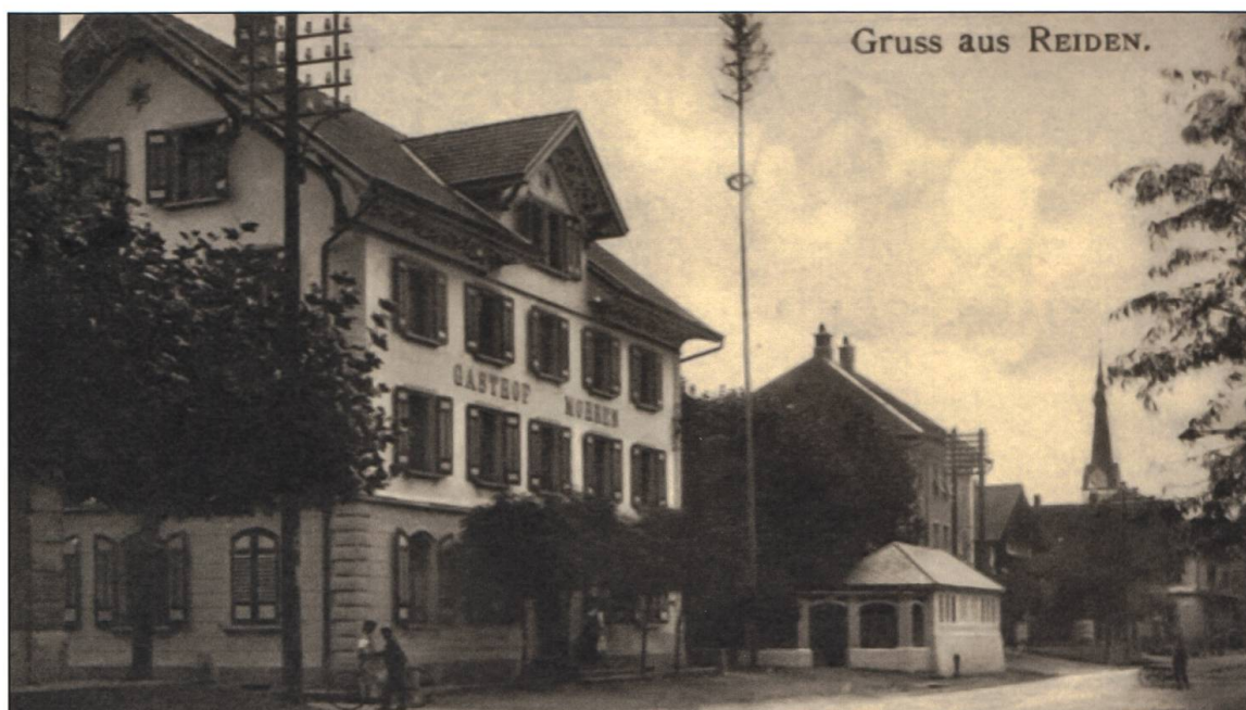
Der «Mohren» als Streikzentrale: Von hier aus wurden die Arbeitskämpfe geführt und koordiniert.

Samstag, 15. Mai, in Luzern statt. Der Vorschlag der Behörde für eine Einigung war für die Streikenden niederschmetternd. Die Löhne sollten, statt 17 Prozent im Durchschnitt, wie gefordert, um 5 Prozent angehoben werden; um weniger als das letzte Angebot der Firma vor dem Streik. Die Arbeit müsse am 18. Mai wieder aufgenommen werden. Zusätzlich wurde das Amtsgericht Willisau vom Einigungsamt beauftragt, die Streikenden per Strafbefehl mit je 5 Franken zu büssen. Bossart triumphierte und behauptete in einer Zeitungseinsendung, die Schuldfrage sei geklärt, der Streik sei leichtsinnig «vom Zaun gerissen» worden.