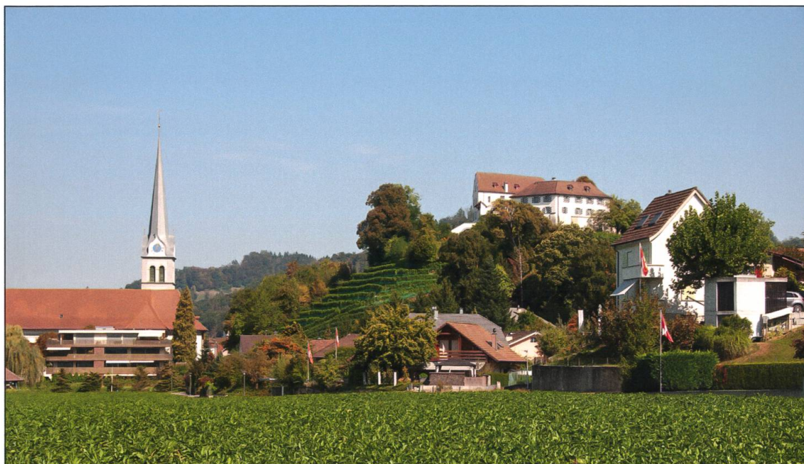
Reiden heute, immer noch ein lebendiger Industriestandort, der in den letzten Jahren stark gewachsen ist.