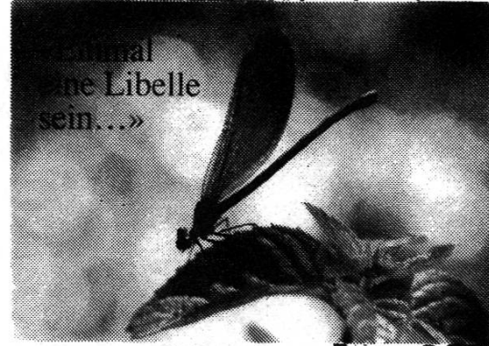
INSEKTEN Ein Zytglogge Poesie-Sachbuch