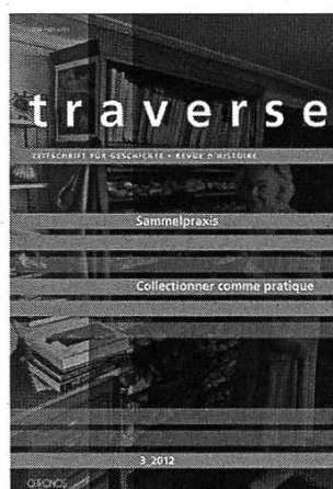
Traverse 2012/3 Sammelpraxis – Collectionner comme pratique 216 S. 20 Abb. Br. CHF 28

Die Beiträge ermöglichen Einsichten in lokale und individuelle Problemsituationen sowie in spannungsvolle Entwicklungen der Gesundheitspolitik, im Spitalwesen, in der Psychiatrie, der Physiotherapie, in der Krankenpflege und in der ausserhäuslichen Kinderbetreuung.