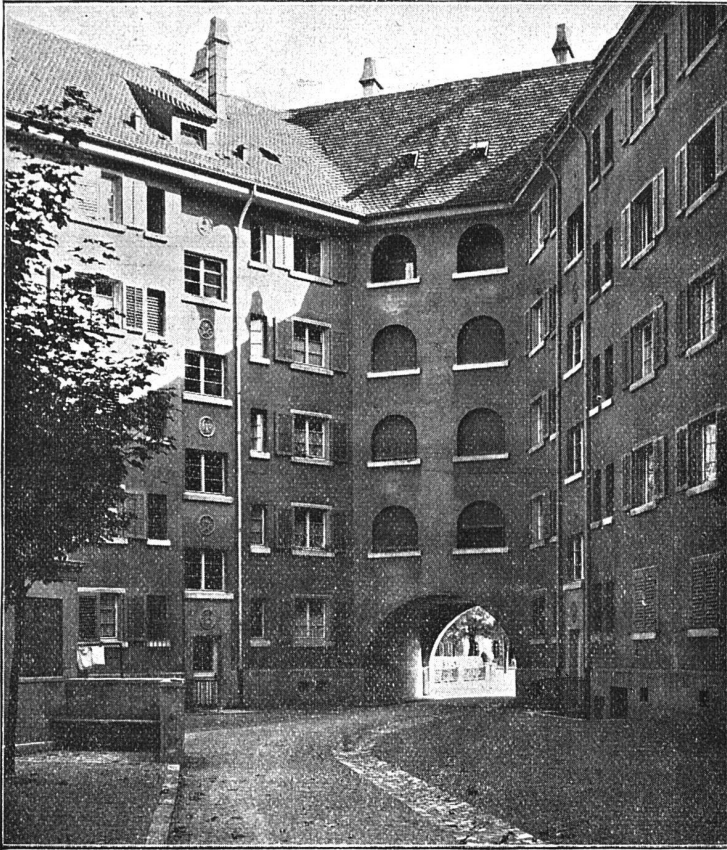
Hofansicht aus der Wohnkolonie an der Josef-Röntgen-Albertstrasse der Baugenossenschaft des eidgen. Personals Zürich