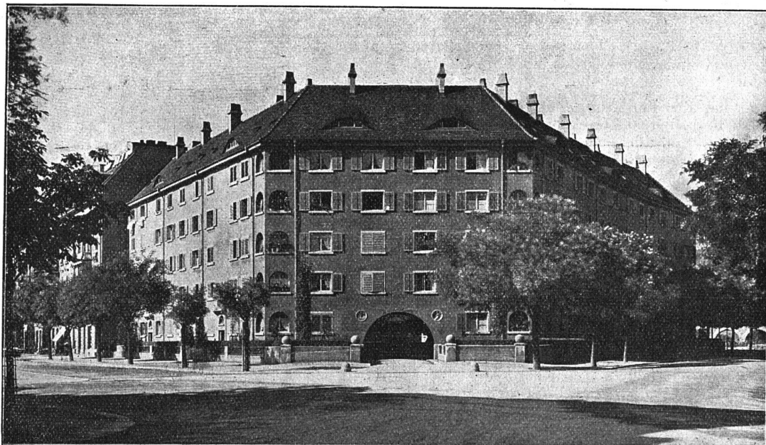
Die Wohnkolonie der Baugenossenschaft des eidgen. Personals Zürich an der Josef-Röntgen-Albertstrasse.

4. die Vorortgemeinden aber finanziell nicht in der Lage sind, den gemeinnützig genossenschaftlichen Wohnungsbau zu unterstützen und demmassen zu fördern, dass der Wohnungsnachfrage und der Bekämpfung der zu hohen Wohnungsmietpreise dauernd Rechnung getragen werden könnte, und