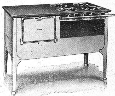
Fig. 2. Gasherde mit halbhochliegendem Bratofen und warmer Abstellplatte über dem letzteren.