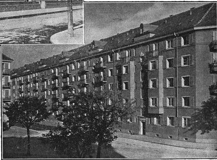
Wohnkolonie der Gemeinn. Bau- genossenschaft Röntgenhof, Zürich

Schweiz nicht gleichmässig gelöst werden könnten, und dass es fraglich sei, ob die Baugenossenschaften das nötige Geld einmal vollständig selber beschaffen könnten. In allen diesen Fragen müsse der Verband seine neutrale Stellung wahren. Der Zentralvorstand sei aber gerne bereit, bestimmte Anträge entgegen zu nehmen.