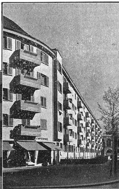
Wohnkolonie der Gemeinn. Bau- genossenschaft Röntgenhof, Zürich