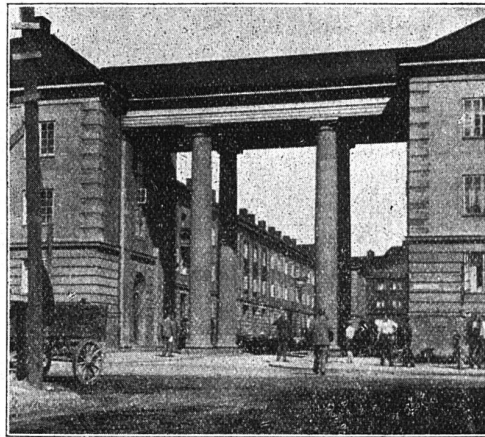
Abb. 2 Oslo, Wohn- kolonie Nor- dre Aasen Pompöser Eingang