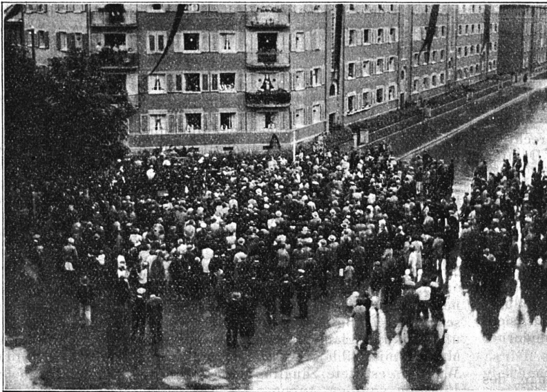
Nationalrat Redaktor Nobs (auf dem Balkon) spricht am Genossenschaftstag am Röntgenplatz

Erzeugung fischer... (mirrored text from reverse side)