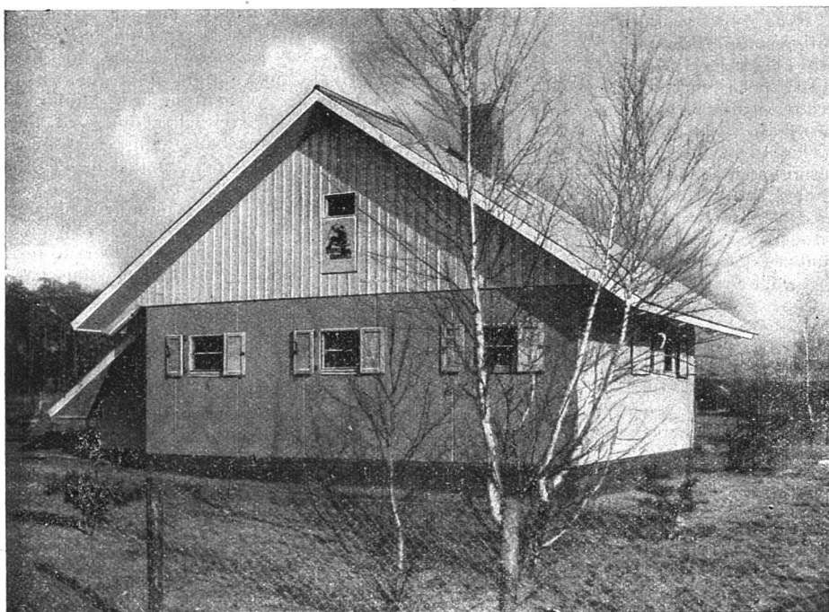
Das fertige Stahllamellen-Siedlungshaus