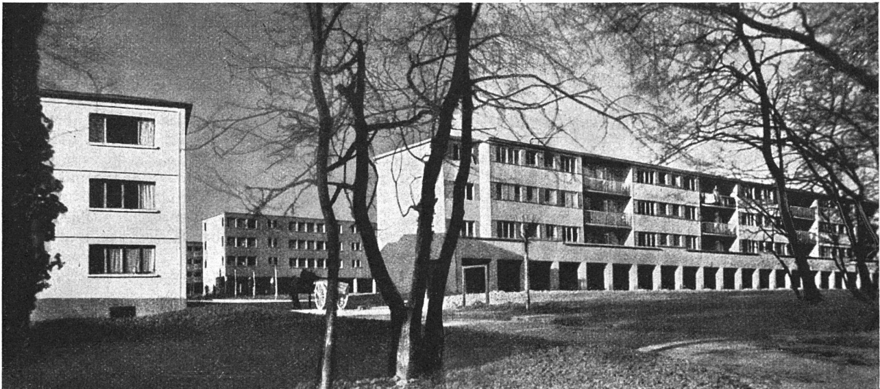
Moderner Baukomplex in Genf

zweckmässig sauber zu haltende und freundlich eingerichtete Wohnung dazu beitragen kann, den Wirtshausbesuch bzw. den Alkoholismus und dessen Schäden an der menschlichen Gesellschaft zu bekämpfen.