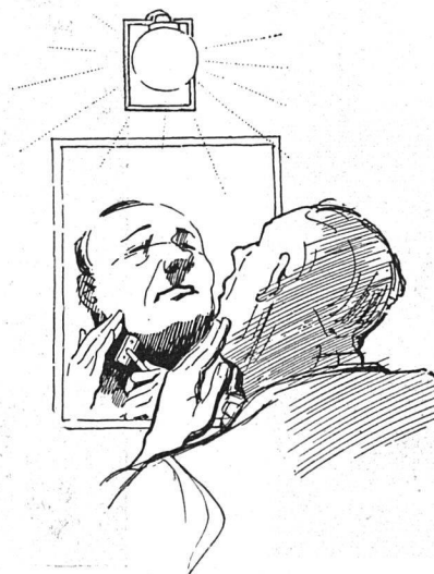
Ungenügende und falsch montierte Spiegelbeleuchtung