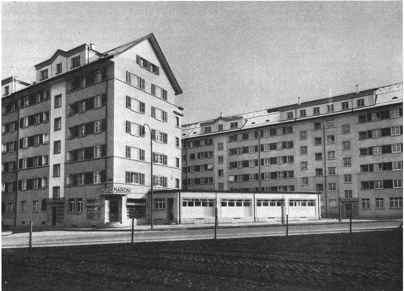
A. B. L., VII. Baustappe