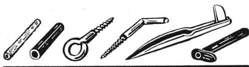
Dübel, Schrauben und Haken als praktische Helfer im Haushalt

Für jede Wand geeignet ist ein « Patent-Steinwandhaken » aus Stahlrohr, meist vermessingt. Das Rohr ist an dem einen Ende angeschärft, am andern Ende ist der Haken festgenietet. Das Rohr biegt sich beim Einschlagen nicht und bricht auch bei einem ungeschickten Schläge nicht ab. Man treibt diesen Haken am besten mit leichten, schnellen Schlägen ein und dreht ihn, solange er noch im Putz geht, nach jedem Schlag ein wenig, muss aber darauf achten, dass er nachher in der richtigen Lage sitzt. Beim Einschlagen bildet sich in dem in die Wand eindringenden Rohr ein fester Steinkern, der ihn unverrückbar in der Wand festhält. Einen solchen