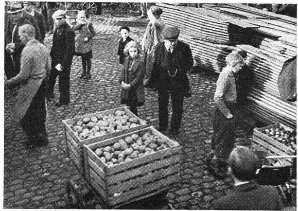
Arbeitslose erhalten verbilligtes Obst

wendet werden kann. 3000 Wagen Obst der Ernte 1937, die sonst hätten zu Branntwein verarbeitet und von der Alkoholverwaltung übernommen werden müssen, wurden eingedickt. Auch hier leistete die Alkoholverwaltung Zuschüsse, denn damit wurde das Obst volkswirtschaftlich viel besser verwertet, indem vor allem der Fruchtzucker erhalten blieb. Wären diese Mengen gebrannt worden, so wären gewaltige Werte verlorengegangen. Der Vorrat an Obstkonzentrat, der damit geschaffen wurde, entspricht etwa 25 Millionen Liter Süßmost, in welchem beinahe alle wertvollen Stoffe des frischen Obstes noch erhalten sind.