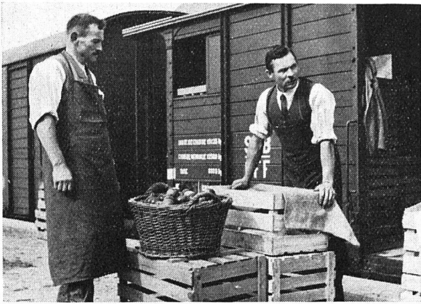
Obstabnahme auf der Verladestation