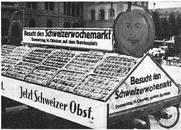
Propagandawagen für den Schweizerwochenmarkt

nur haben diese unter kundiger Aufsicht zu stehen. Schließlich liegt der Ausbau der Marktkontrolle sowohl im Interesse des Verkäufers wie des Käufers. Alles Minderwertige, das den Appetit verdirbt, muß vom Markt verschwinden; das gilt auch für alle Obstprodukte, ob fest oder flüssig.