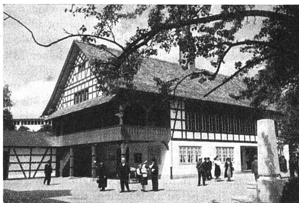
Unser Tagungsort: Das Gemeindehaus im Dörfli