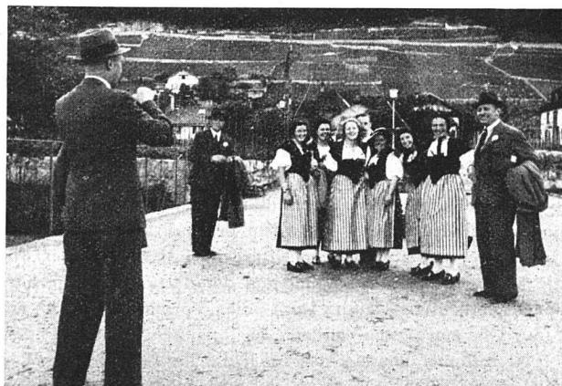
Die Trachtengruppe hoch im Kurs!