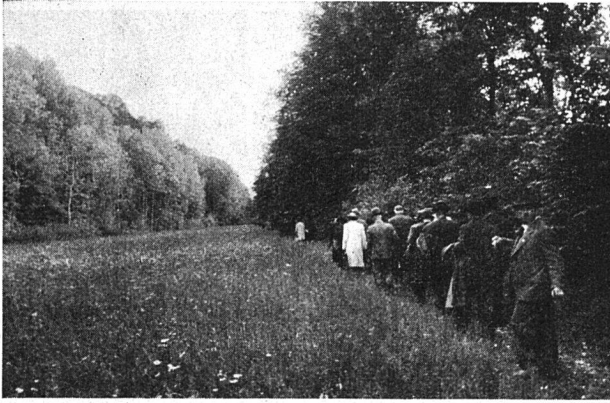
Eine Irrfahrt — und doch vergnüglich

zu nehmen gewillt ist. Er gibt seiner Freude Ausdruck über die gute Zusammenarbeit innerhalb des Vorstandes und mit den einzelnen Sektionen und Genossenschaften.